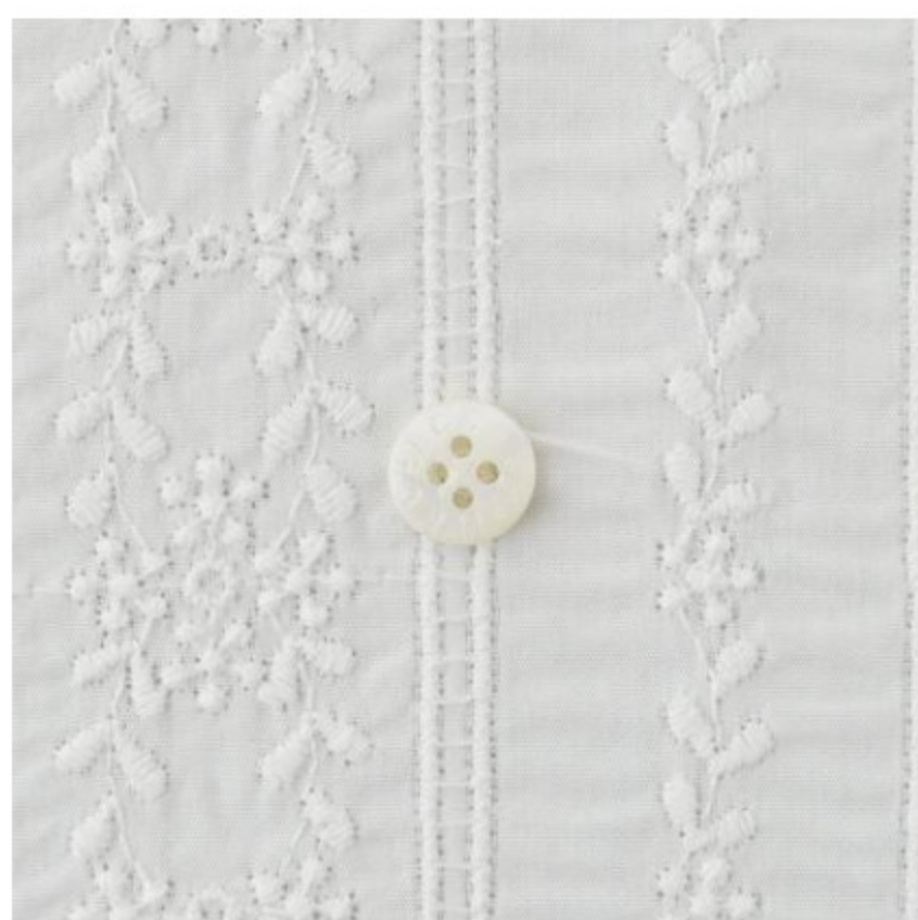
ホワイトにオフホワイト