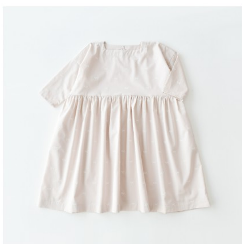
グレイッシュピンクにオフホワイト：『CHECK&STRIPEの子ども服 ソーイング・ナーサリー』（文化出版局）スクエアネックのギャザーワンピース