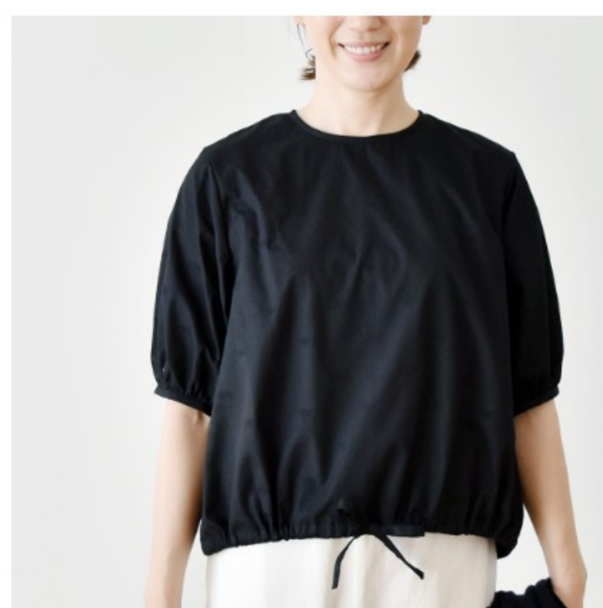
ブラックにブラック：『CHECK&STRIPE COLOUR BOOK 色を楽しむソーイングブック』（文化出版局）フロントリボンのパフブラウス