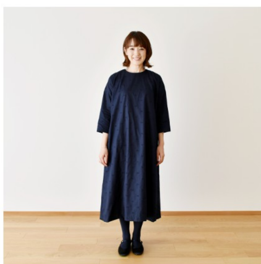
スタンダードネイビーにブラック：『CHECK&STRIPEのおとな服 ソーイング・レメディィー』（文化出版局）シンプルAラインワンピース