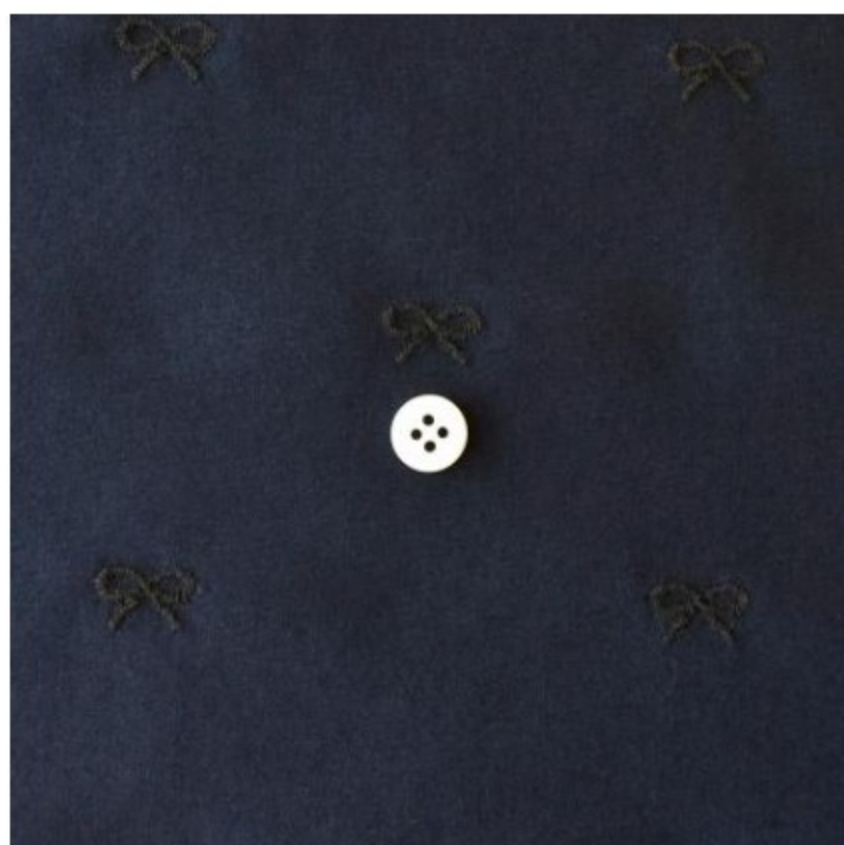
スタンダードネイビーにブラック