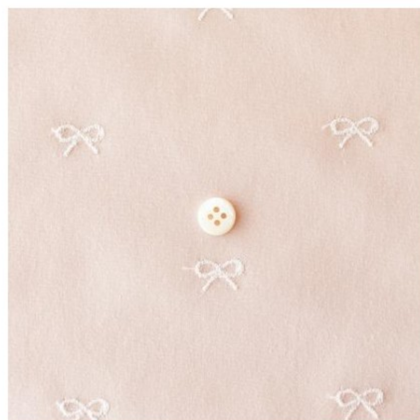
グレイッシュピンクにオフホワイト