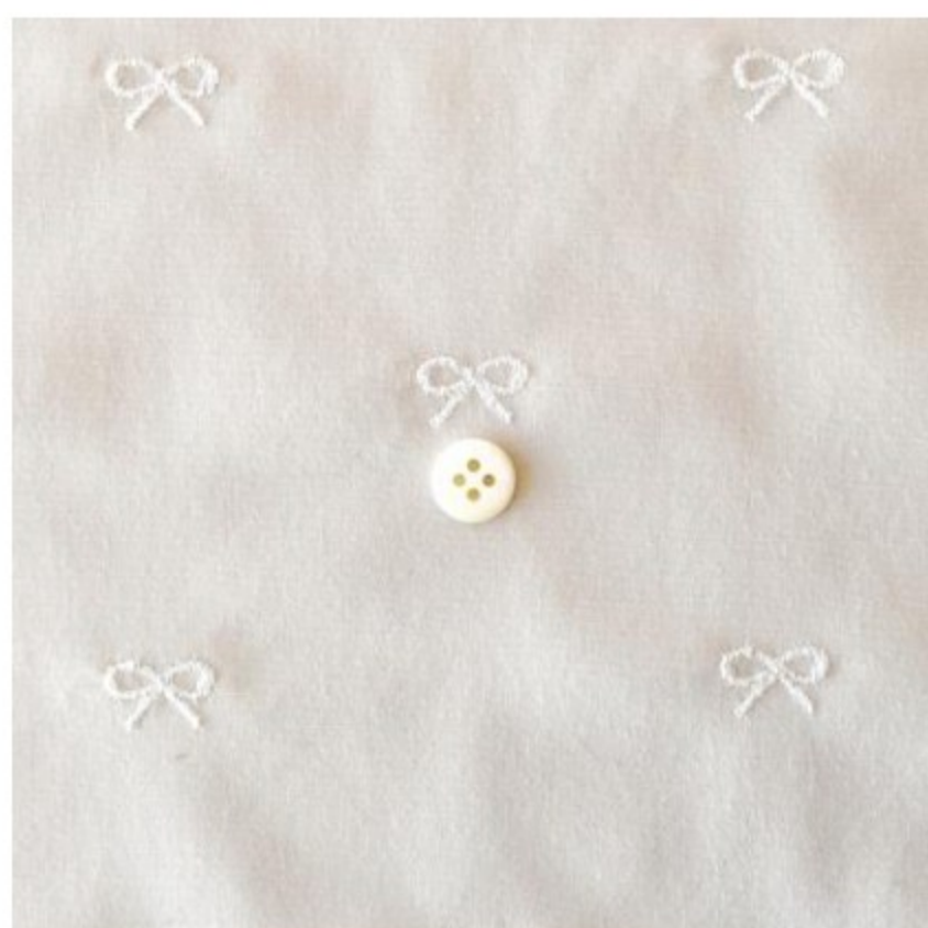
マッシュルームにオフホワイト