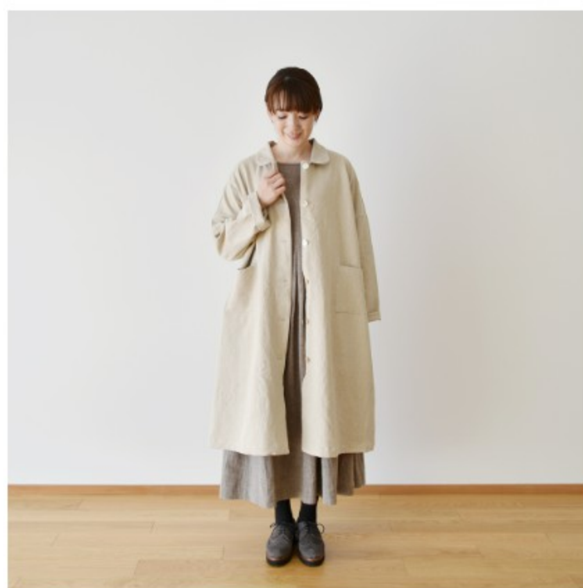
ベージュ:『CHECK&STRIPE COLOUR BOOK 色を楽しむソーイングブック』(文化出版局) プリティッシュコート