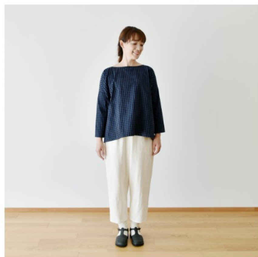
ホワイト:『CHECK&STRIPE COLOUR BOOK 色を楽しむソーイングブック』(文化出版局) シンプルテーパードパンツ