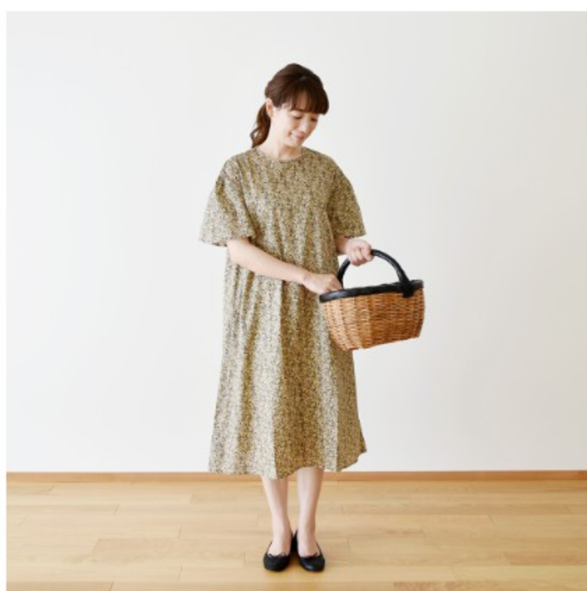
©J11F(あずきミルク系): 『CHECK&STRIPE COLOUR BOOK 色を楽しむソーイングブック』(文化出版局) ギャザーズリーブのワンピース