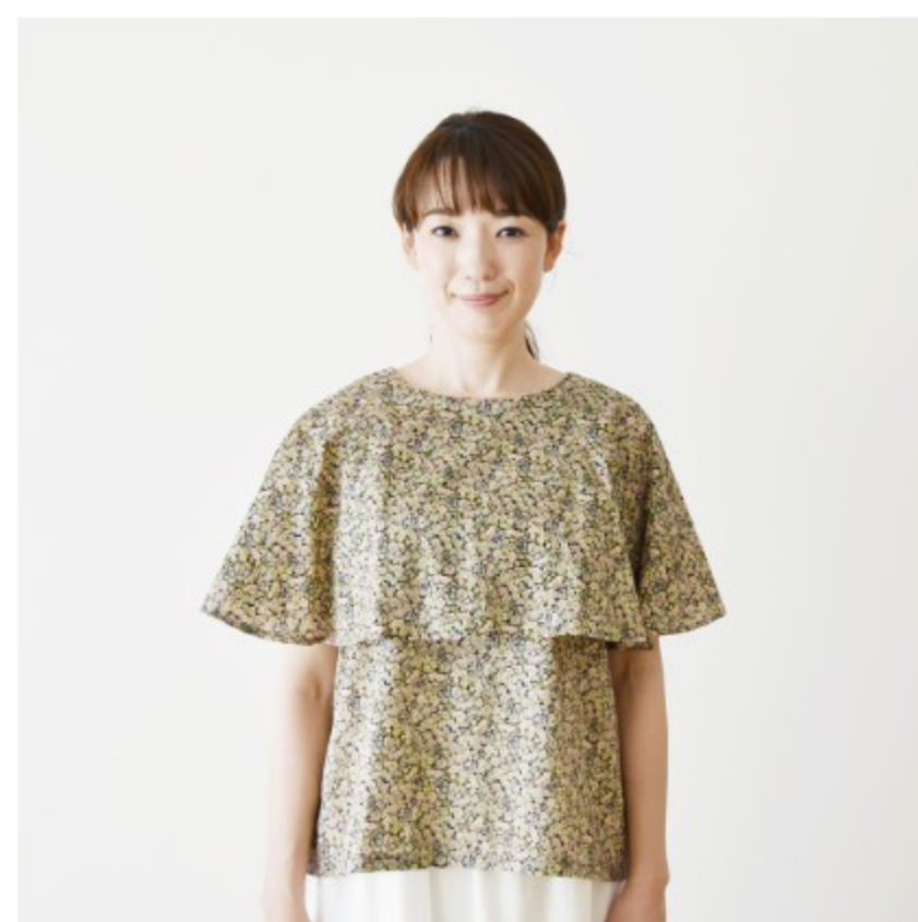
©J11F(あずきミルク系): 『CHECK&STRIPE my favorite 私の好きな服』(主婦と生活社) ケープブラウス