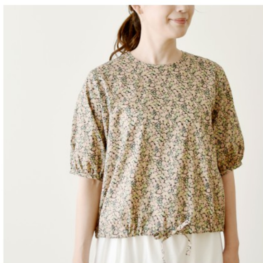
©J11E(スモーキーピンク系): 『CHECK&STRIPE COLOUR BOOK 色を楽しむソーイングブック』(文化出版局) フロントリボンのパフブラウス