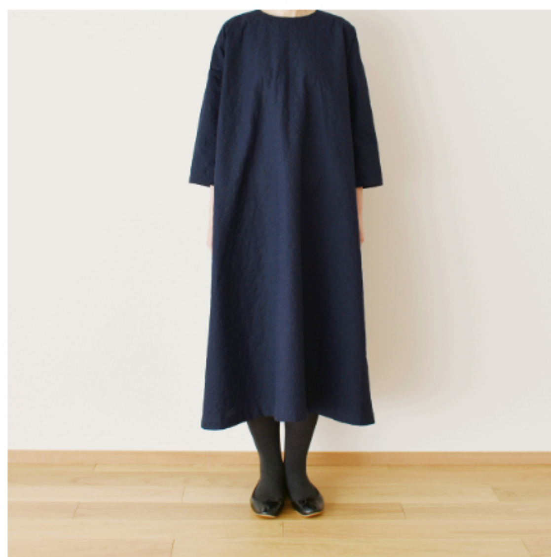
スタンダードネイビーにダークネ イビー:『CHECK&STRIPEのお とな服 ソーイング・レメディ ー』(文化出版局) シンプルAライン ワンピース ※用尺:S 3.1m、M 3.4m、L 3.5m