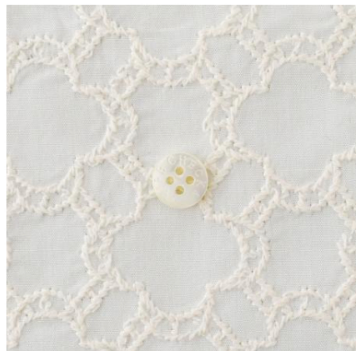
ホワイトにアイボリー