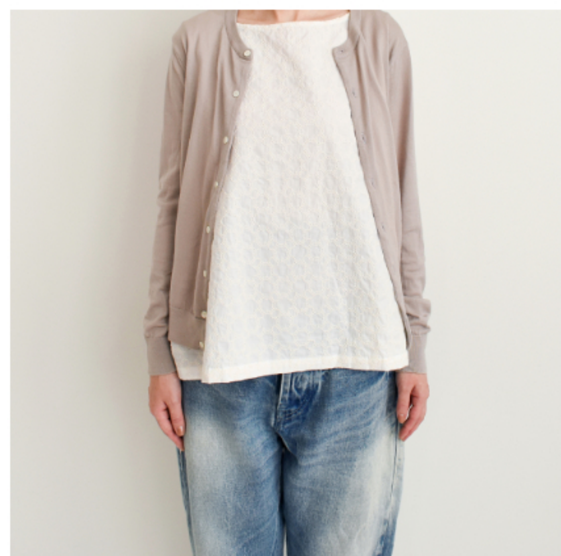
ホワイトにアイボリー: 『CHECK&STRIPE SEW HAPPY』(世界文化社)サイドタ ックのポートネックブラウス