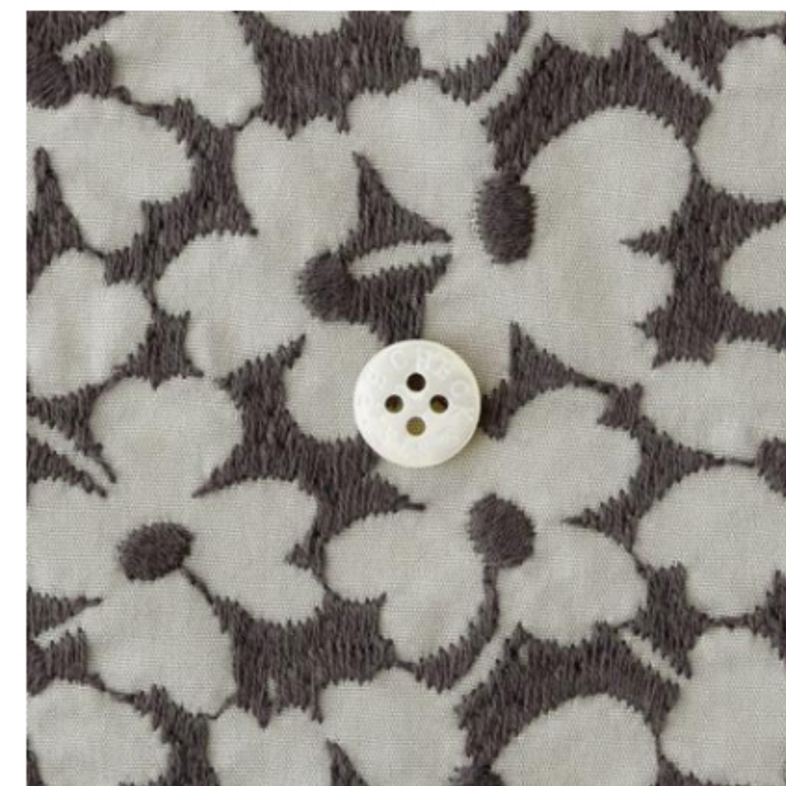
ストーンにスチールグレー