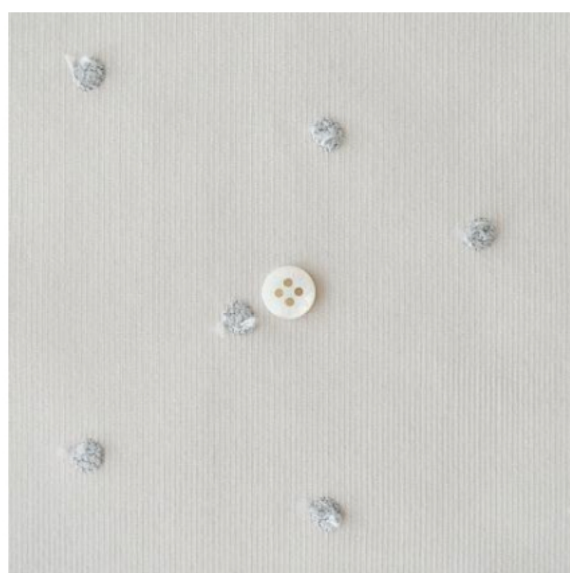
マッシュルームにアッシュ