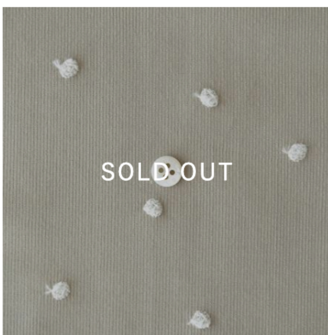
ソイラテにアイボリー