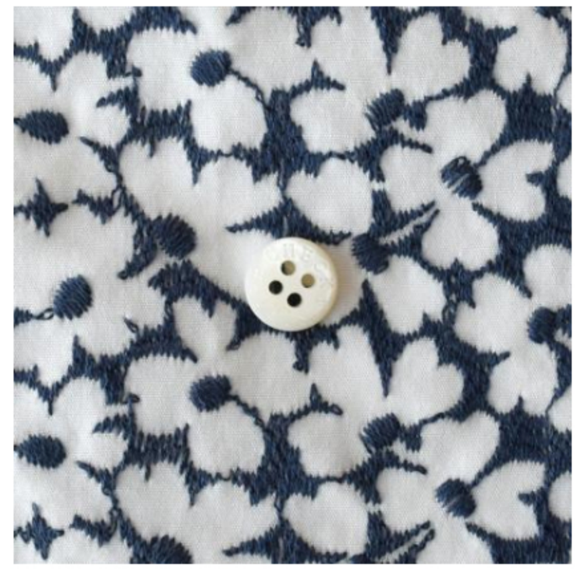
白にアイアンブルー