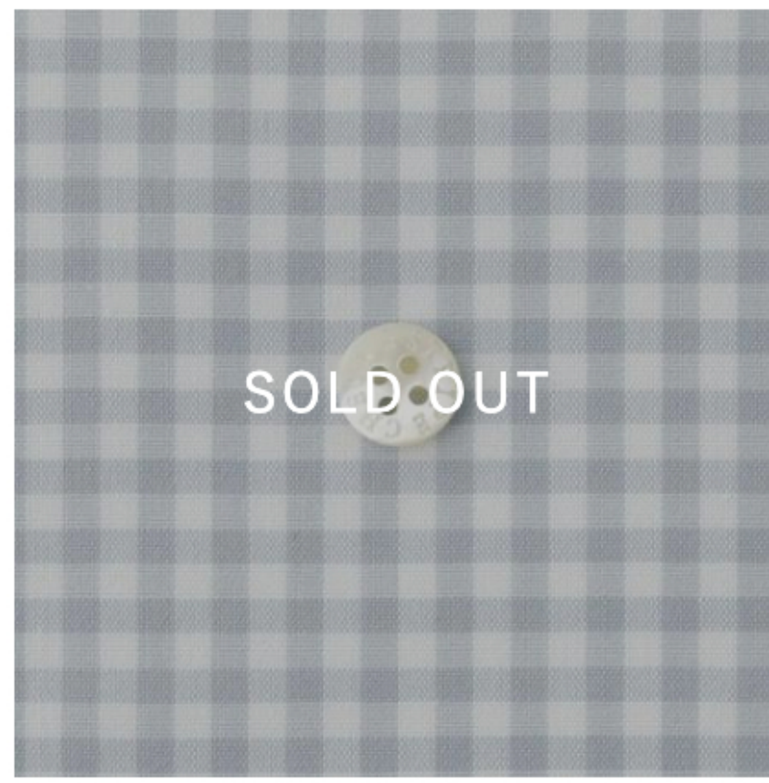
ライトブルーグレー