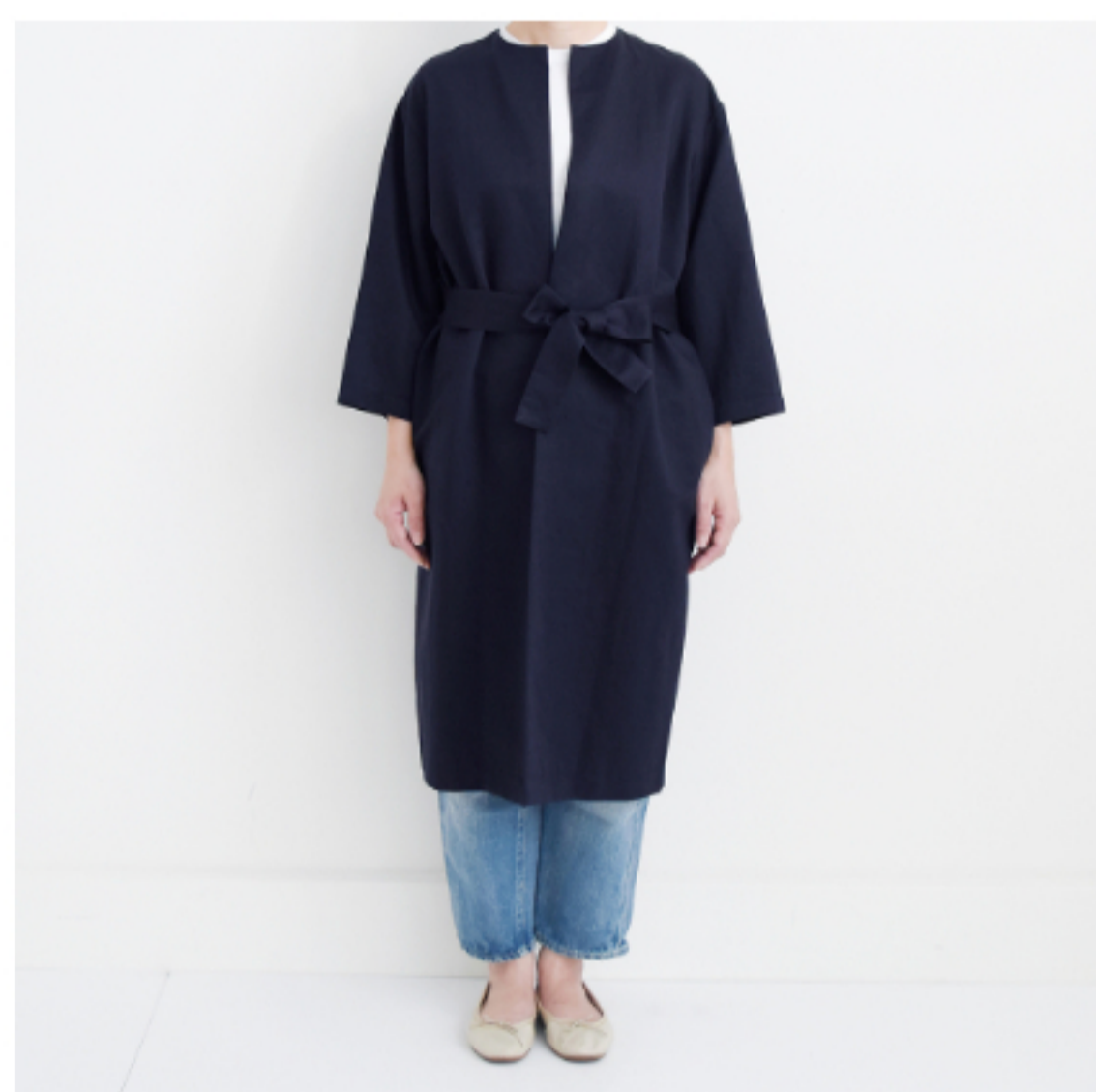
ダークネイビー: 『CHECK&STRIPE 北欧てづくり散歩』(集英社) よそいきのシンプルコート