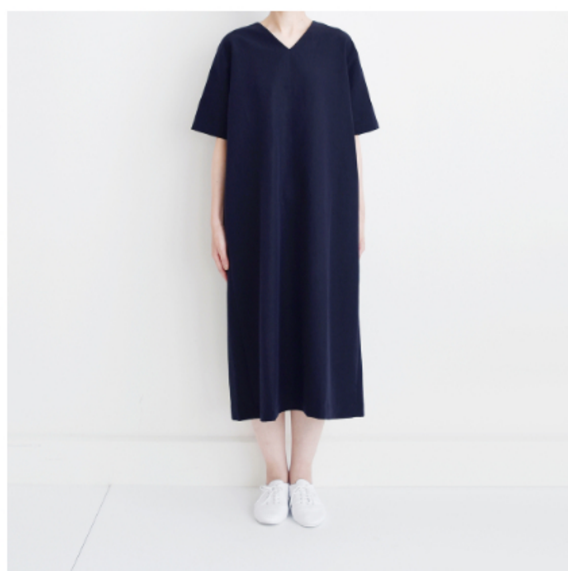
ダークネイビー:「パターン177」 (後ろボタンのVネックワンピース)