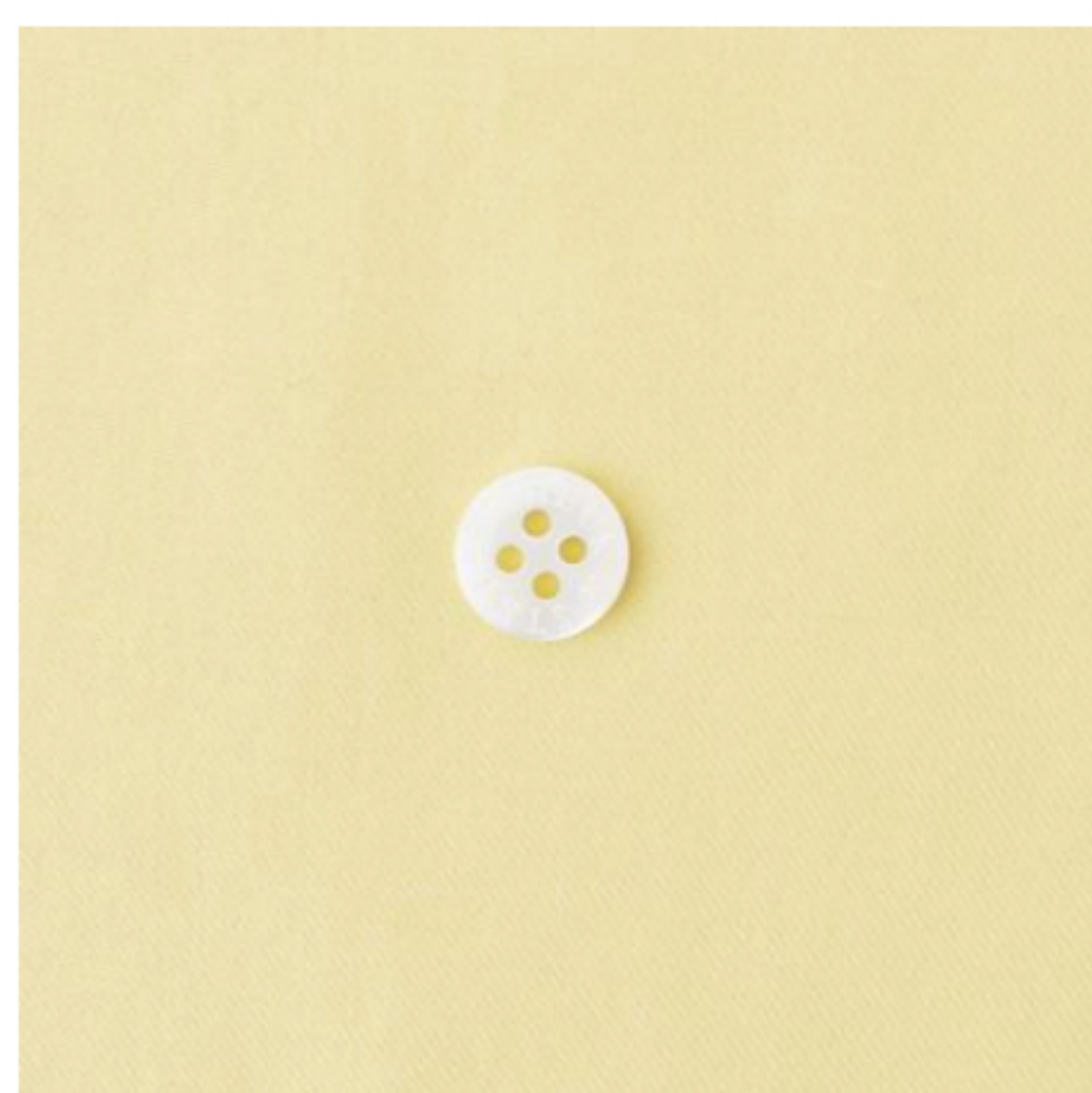
カナリーイエロー