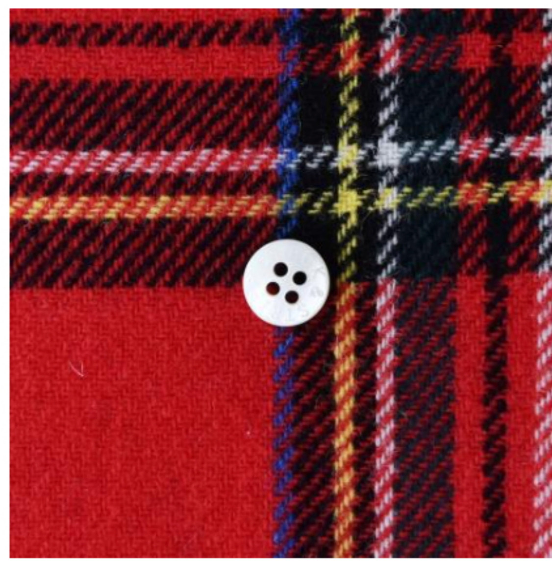
ロイヤルシュワート