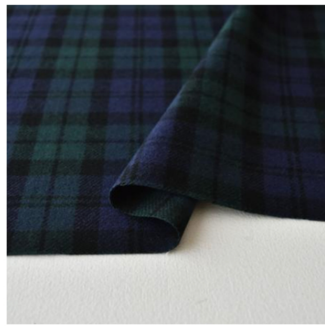
ブラックウォッチ