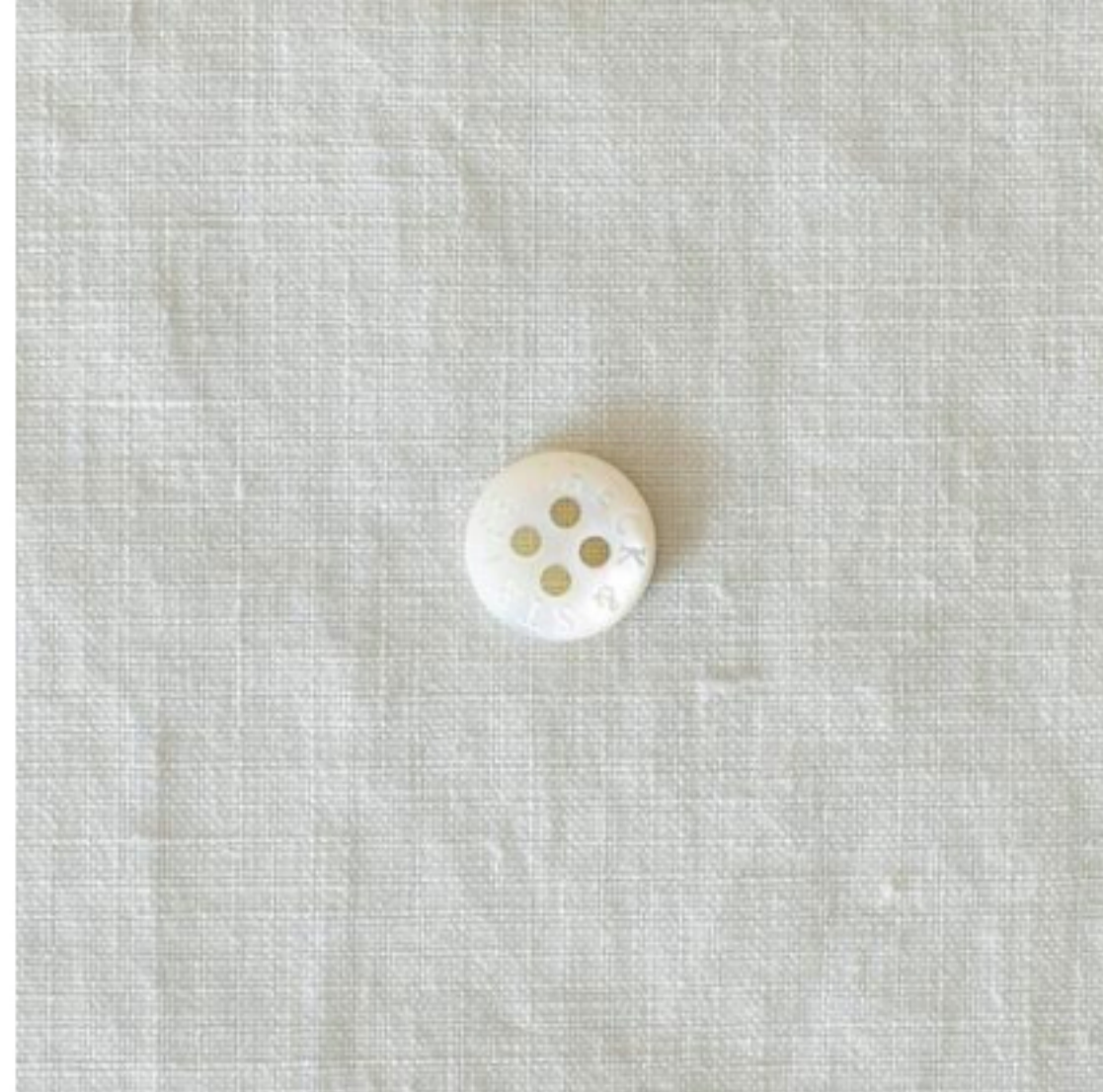
ホワイトグレージュ