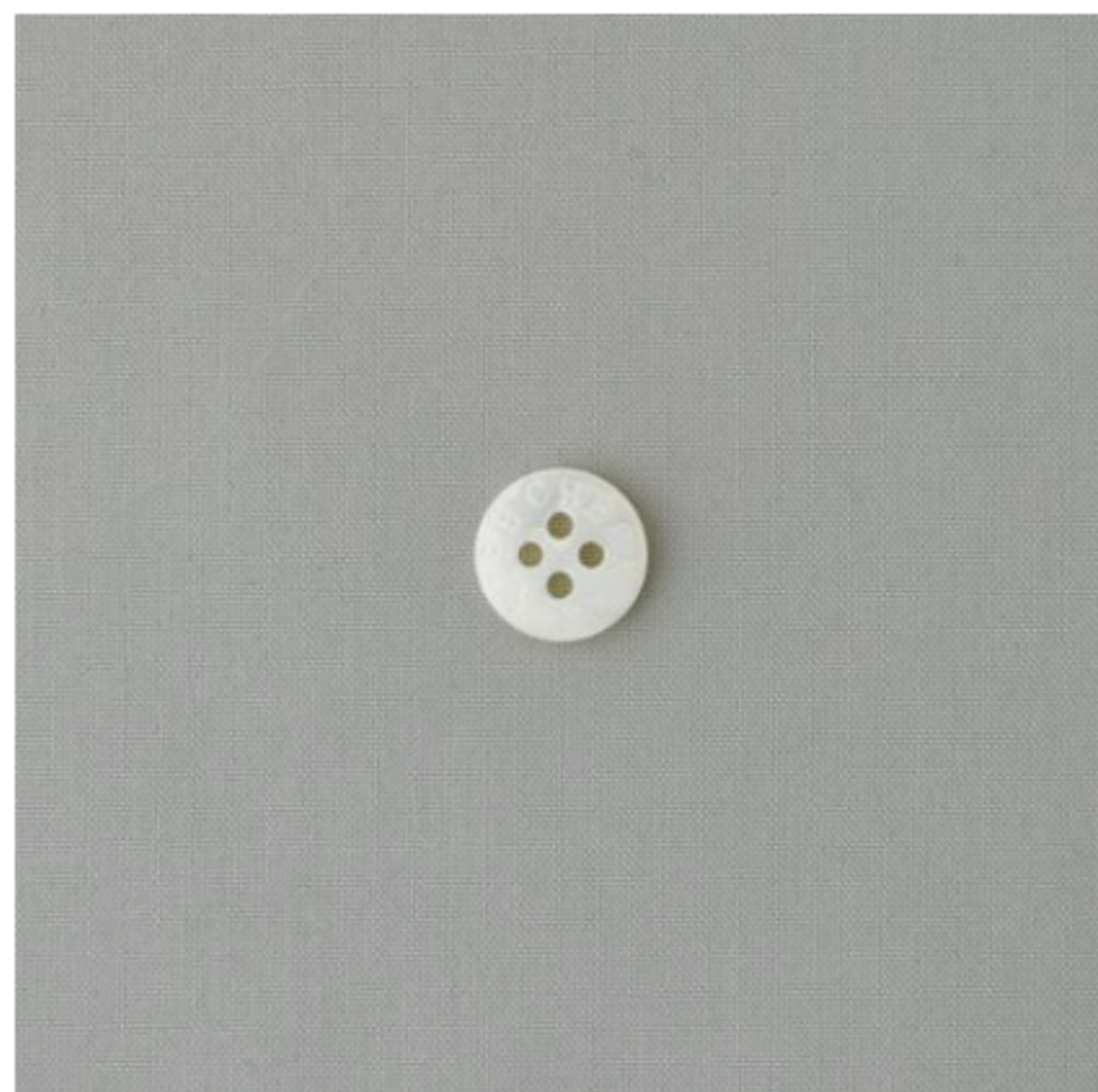
ライトグレイージュ