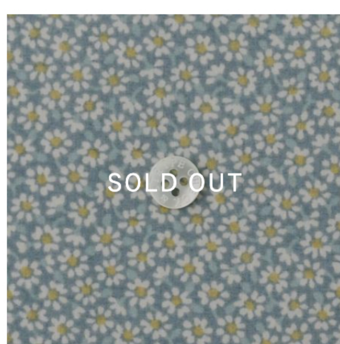
スモークブルーグレー地