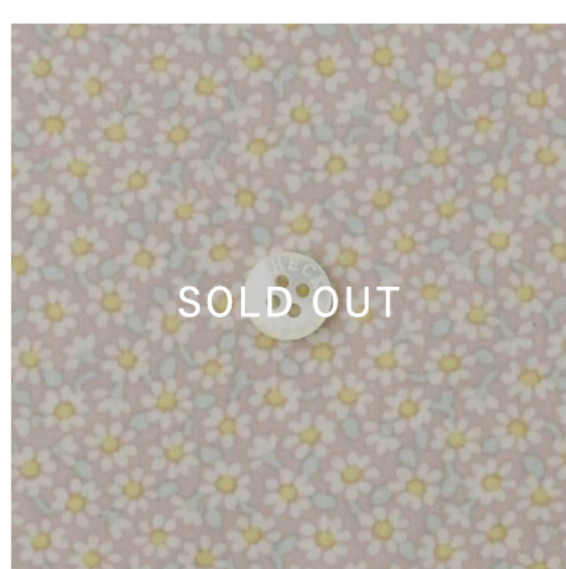
グレイッシュピンク地