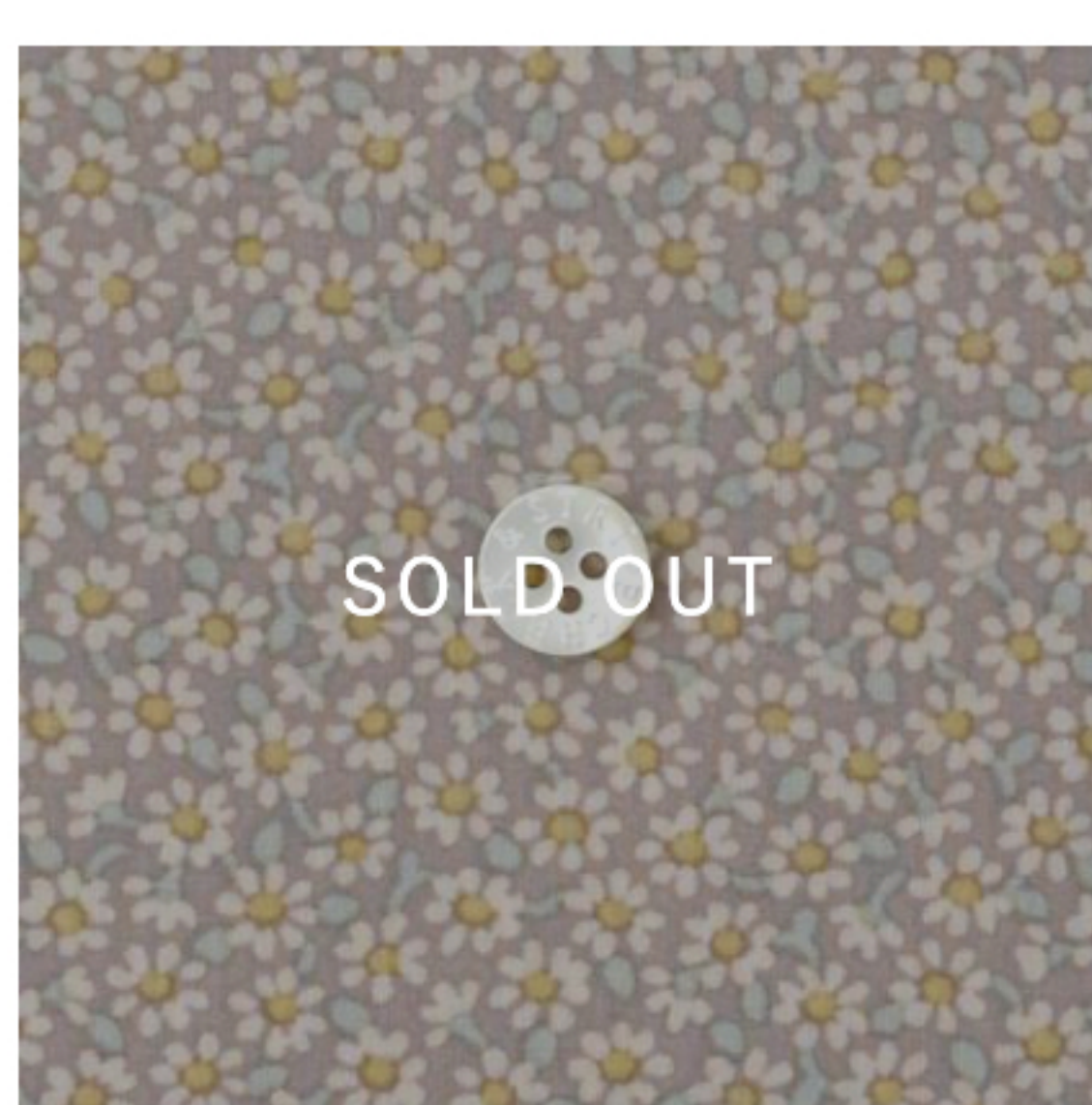
あずきクリーム地