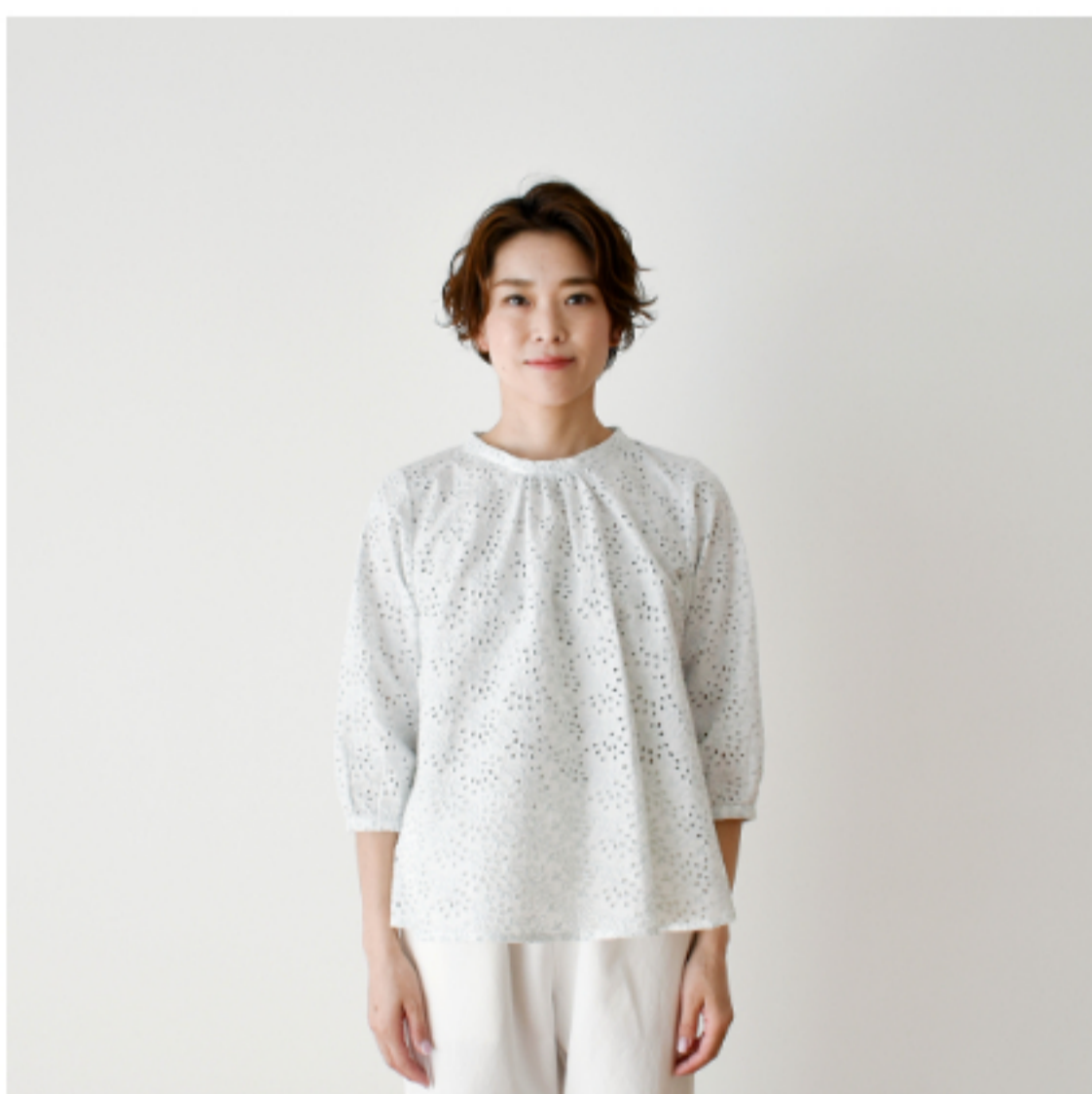
ホワイトにアクア： 『CHECK&STRIPE Sewing Diary in Paris パリのソーイング ダイアリー』（世界文化社） 小さな立ち衿のブラウス