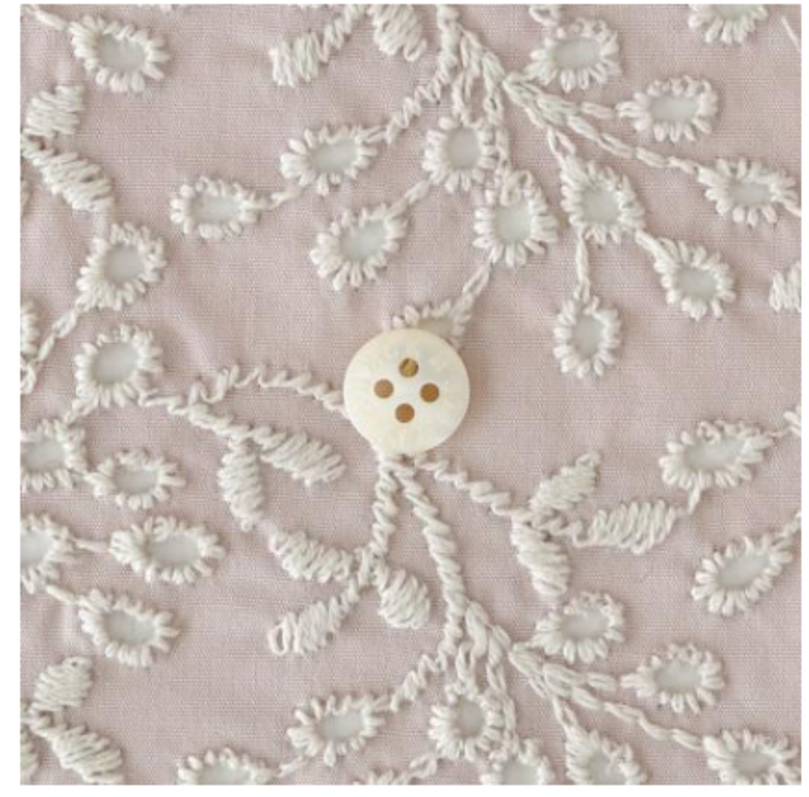
グレイッシュピンクにアイボリー