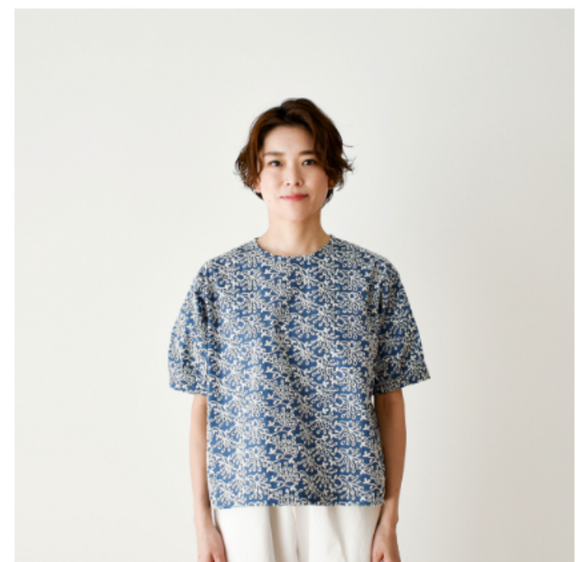
スモークブルーにアイボリー： 『CHECK&STRIPE Sewing Diary in Paris パリのソーイング ダイアリー』（世界文化社）パ フブラウス