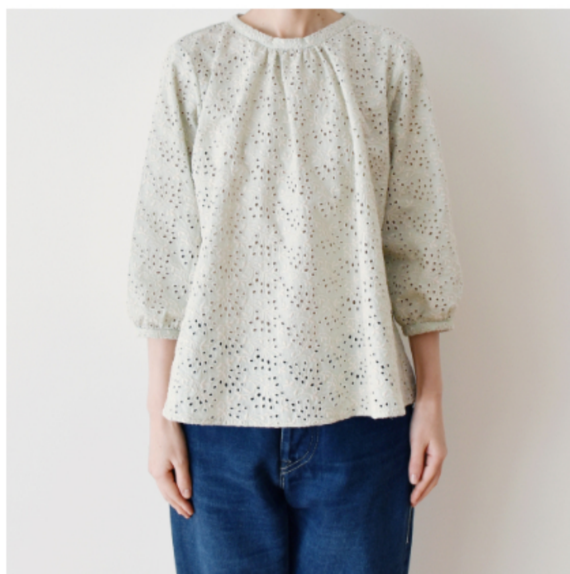
ミンティーにアイボリー： 『CHECK&STRIPE Sewing Diary in Paris パリのソーイング ダイアリー』（世界文化社） 小さな立ち衿のブラウス