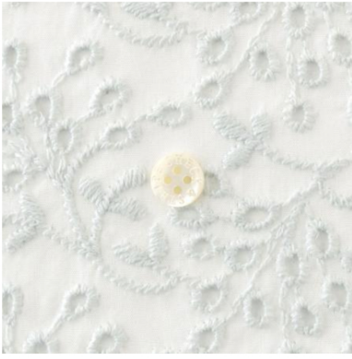
ホワイトにアクア