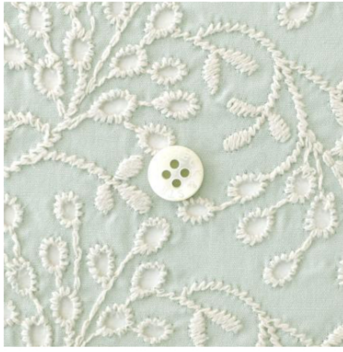
ミンティーにアイボリー