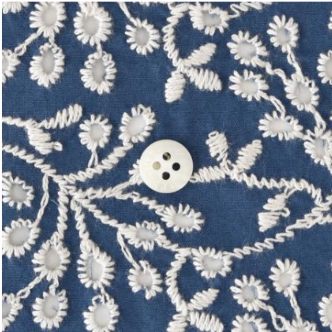
スモークブルーにアイボリー