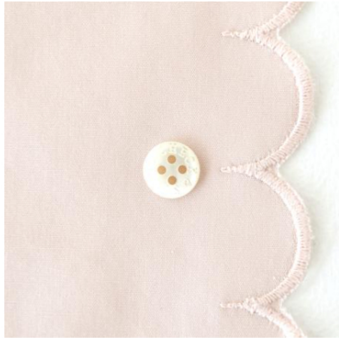
グレイッシュピンク