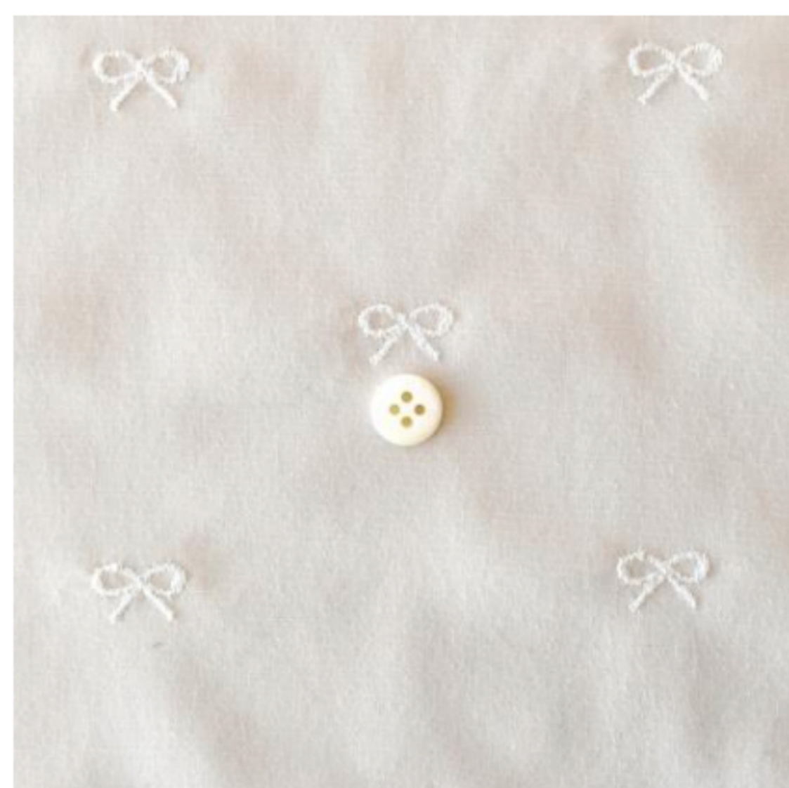
マッシュルームにオフホワイト