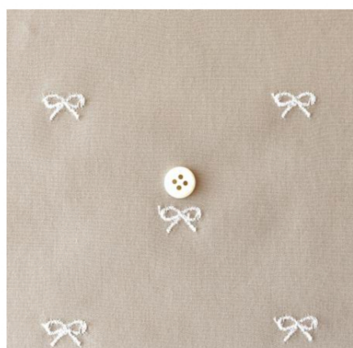
ソイラテにオフホワイト