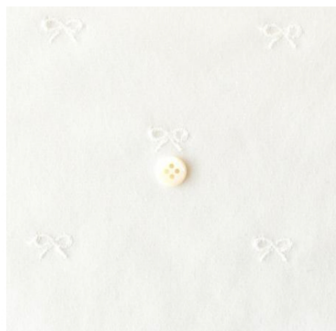
ホワイトにオフホワイト