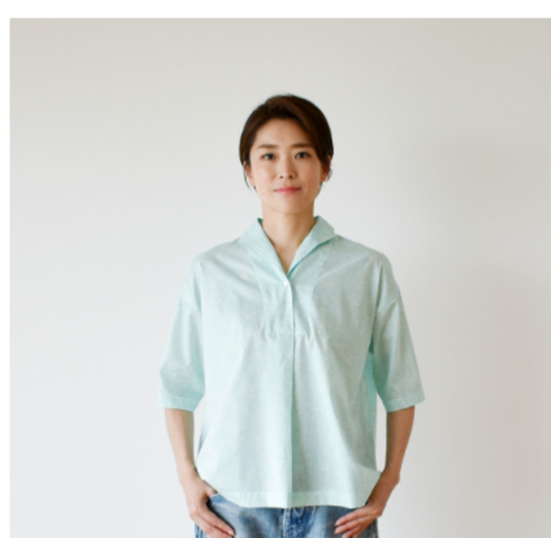
©J23C(ペールグリーン): 『CHECK&STRIPE Sewing Diary in Paris パリのソーイングダイアリー』(世界文化社) ウィークエンドのブラウス