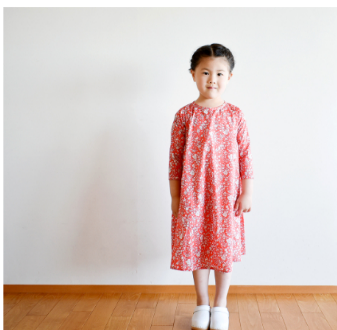
©J23A(バーミリオンレッド): 『CHECK&STRIPE Sewing Diary in Paris パリのソーイングダイアリー』(世界文化社) サイドギャザーのワンピース 子ども