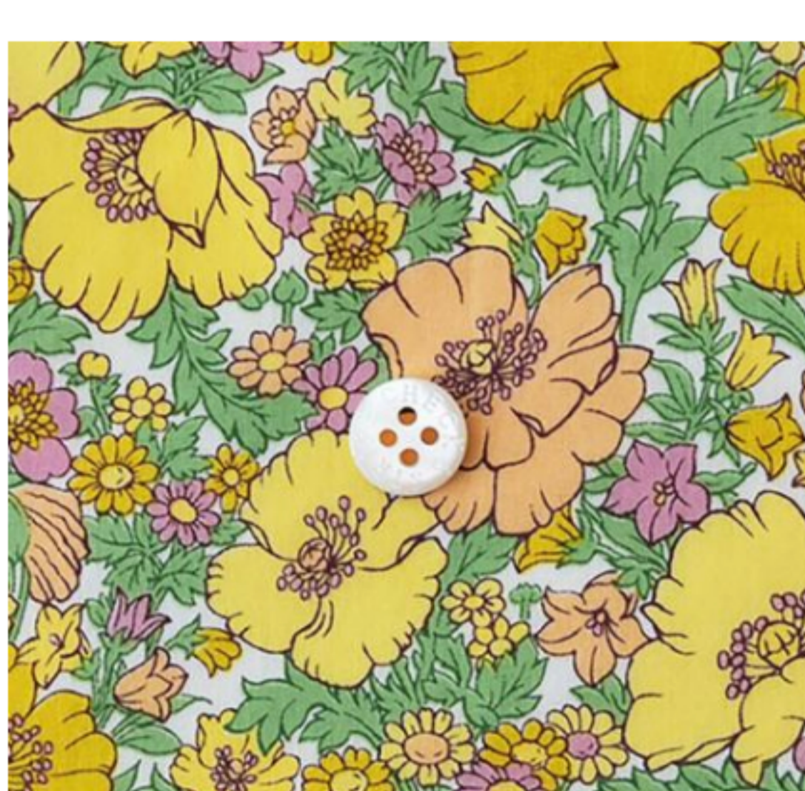
Meadow Song 22BT(イエロー系)