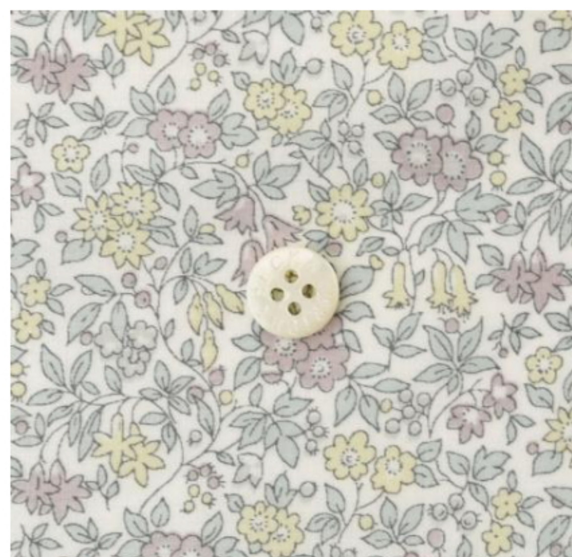
Chamomile Lawn ©J22B(パステルブラウン・イエロー系)