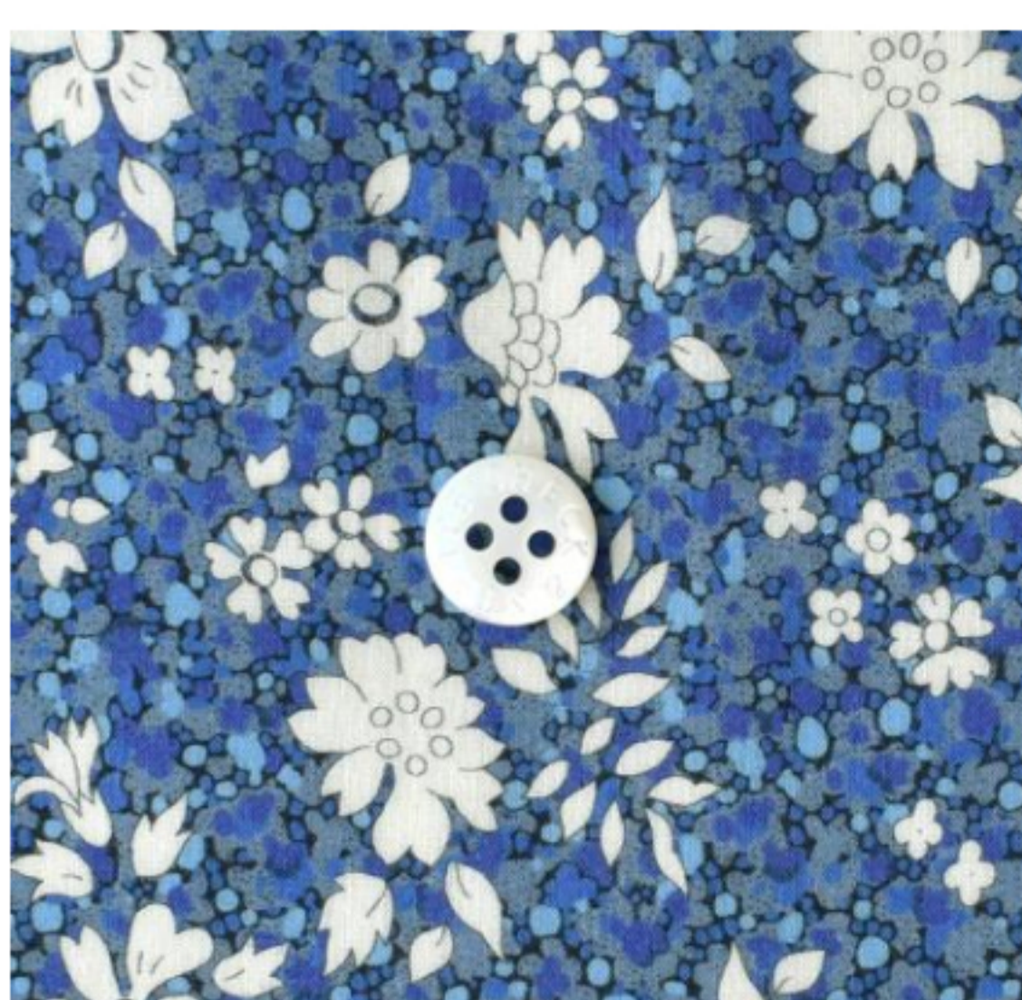
Capel Pepper ©J24B(ブルー系)