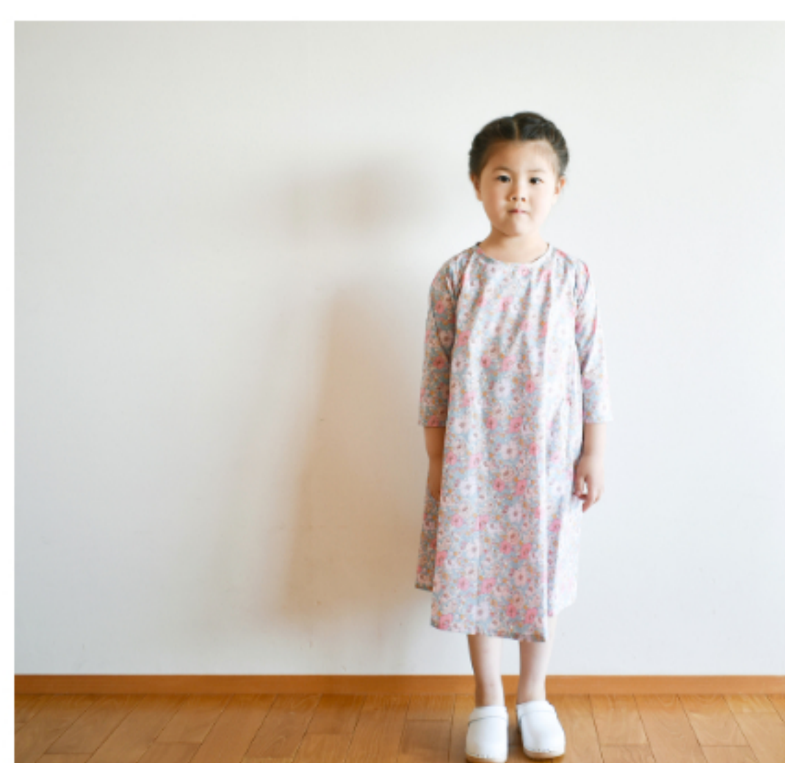
22AT(ピンク系): 『CHECK&STRIPE Sewing Diary in Paris パリのソーイングダイアリー』(世界文化社) サイドギャザーのワンピース 子ども