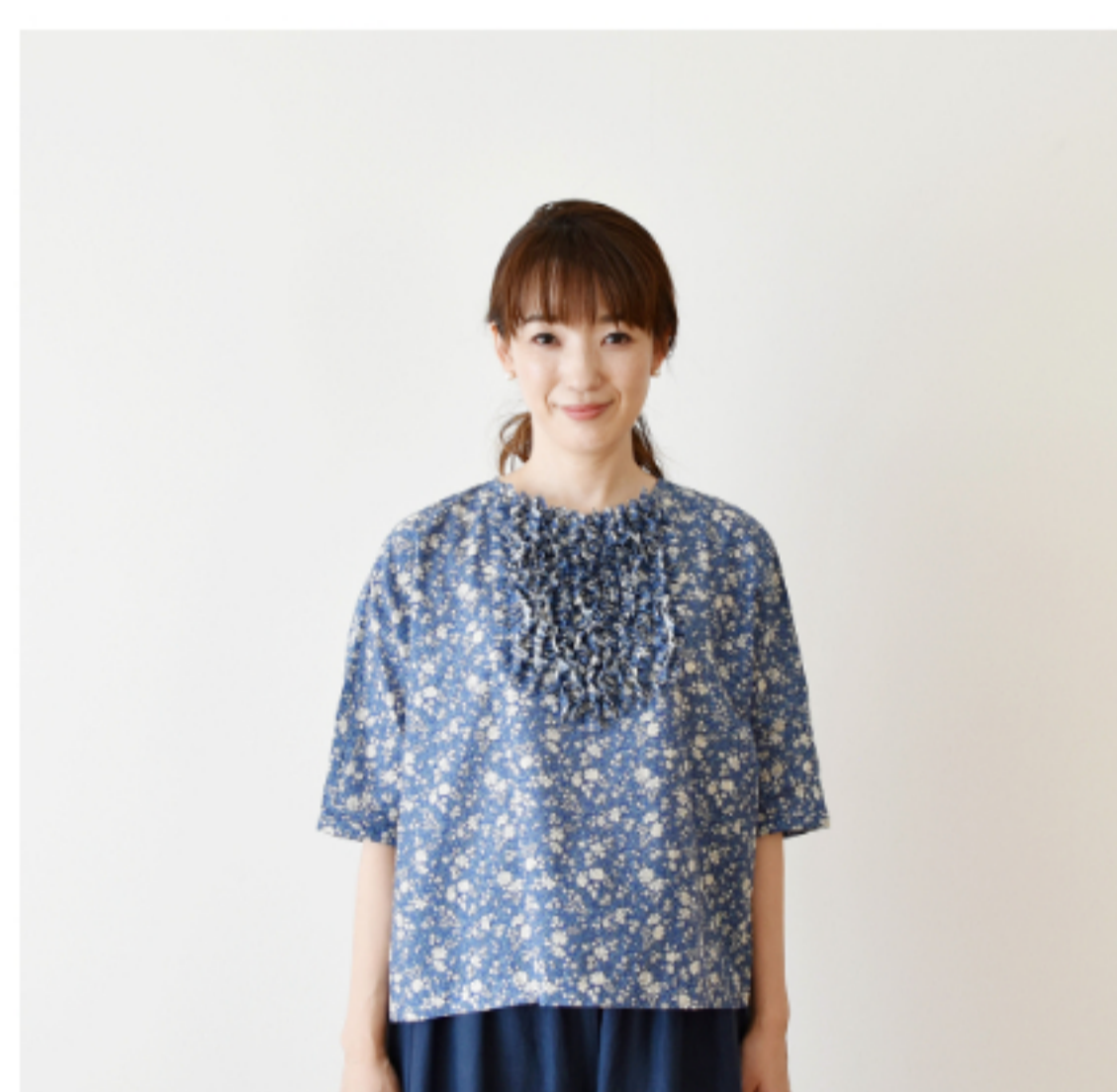
©J24B(ブルー系): 『CHECK&STRIPE COLOUR BOOK 色を楽しむソーイングブック』(文化出版局) ホワイトセージのブラウス