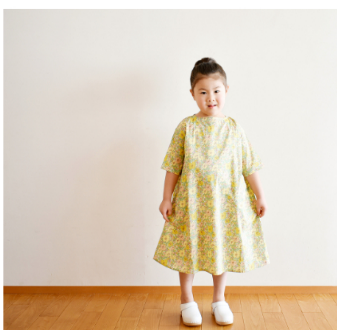
22BT(イエロー系): 『CHECK&STRIPE Sewing Diary in Paris パリのソーイングダイアリー』(世界文化社) ポートネックのワンピース 5分袖 子ども