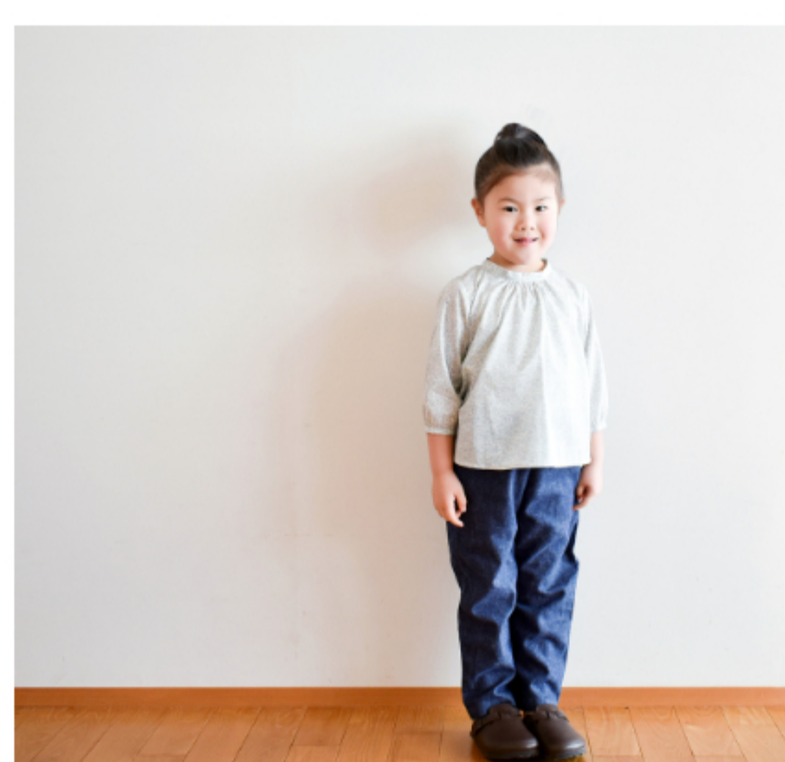
©J22B(パステルブラウン・イエロー系): 『CHECK&STRIPE Sewing Diary in Paris パリのソーイングダイアリー』(世界文化社) 小さな立ち衿のブラウス 子ども