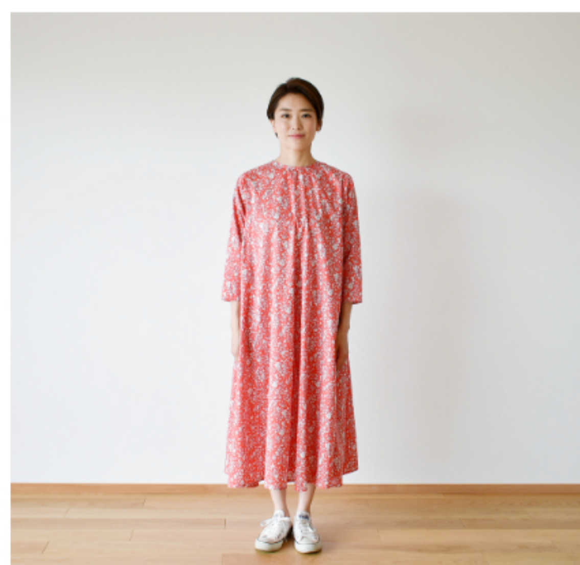
©J23A(バーミリオンレッド): 『CHECK&STRIPE Sewing Diary in Paris パリのソーイングダイアリー』(世界文化社) サイドギャザーのワンピース