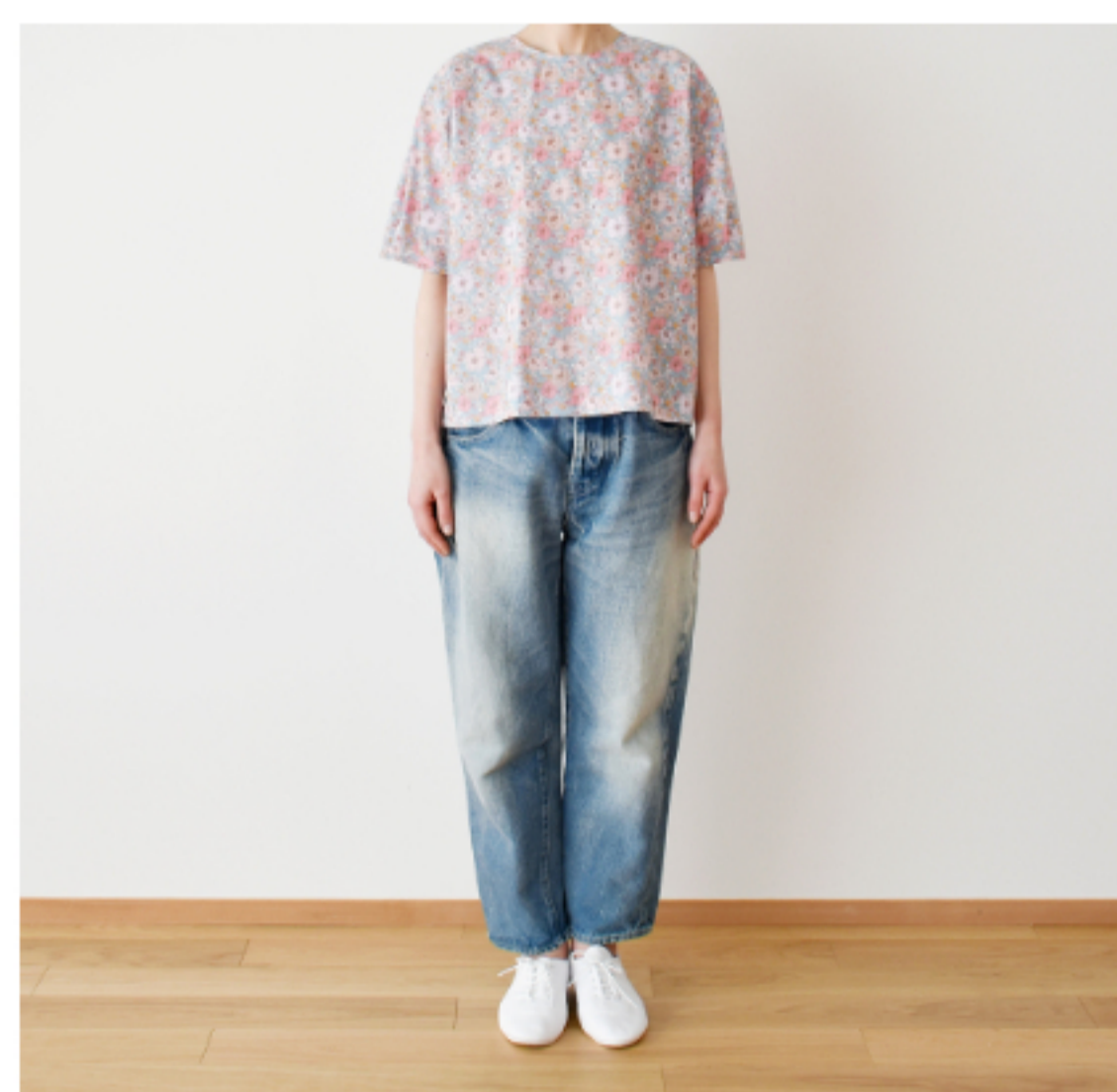
22AT(ピンク系): 『CHECK&STRIPE Sewing Diary in Paris パリのソーイングダイアリー』(世界文化社) パフブラウス