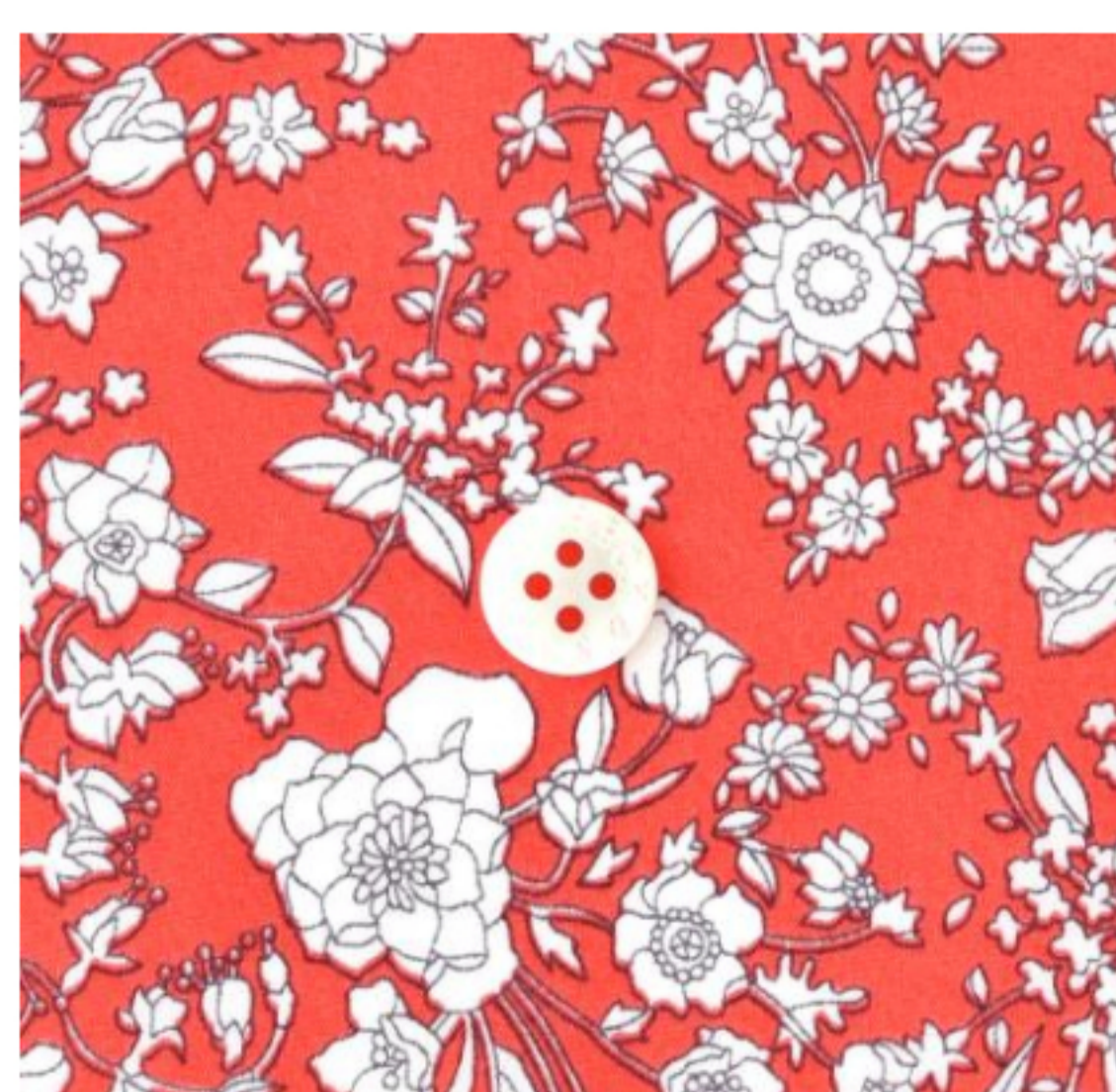
Summer Blooms ©J23A(バーミリオンレッド)