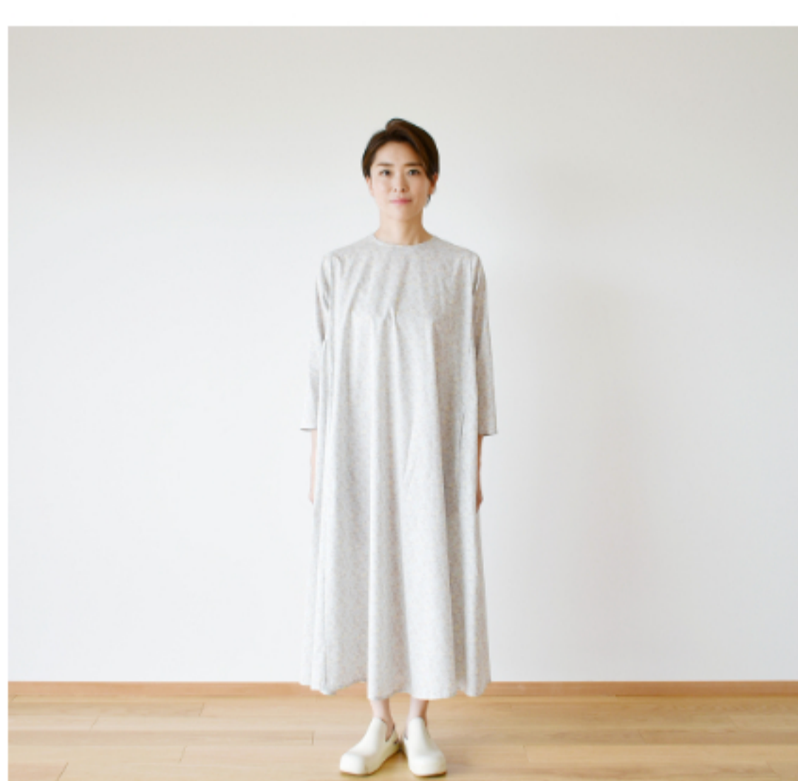
©J23A(ラベンダーグレー系): 『CHECK&STRIPE Sewing Diary in Paris パリのソーイングダイアリー』(世界文化社) サイドギャザーのワンピース