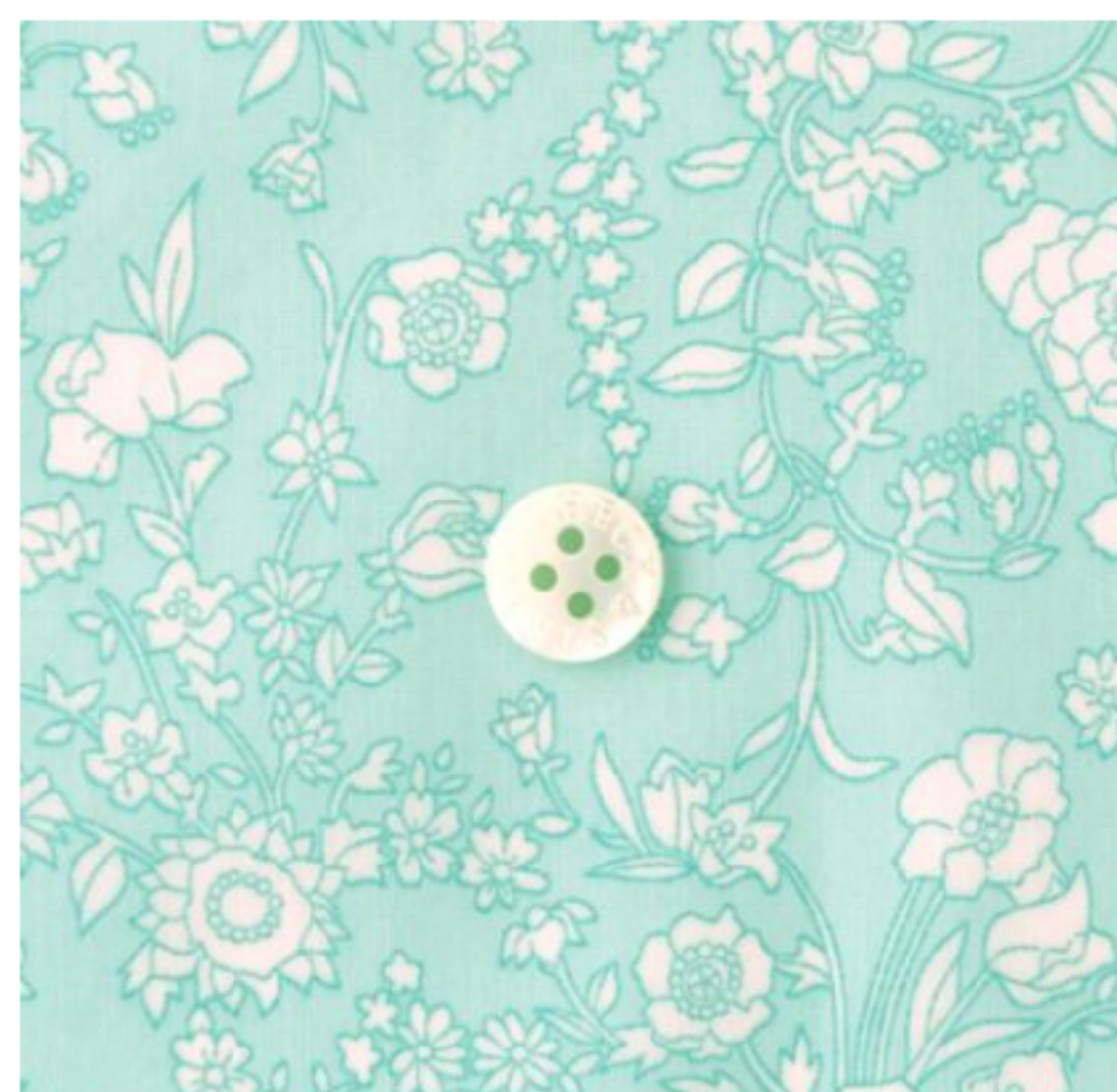
Summer Blooms ©J23C(ペールグリーン)