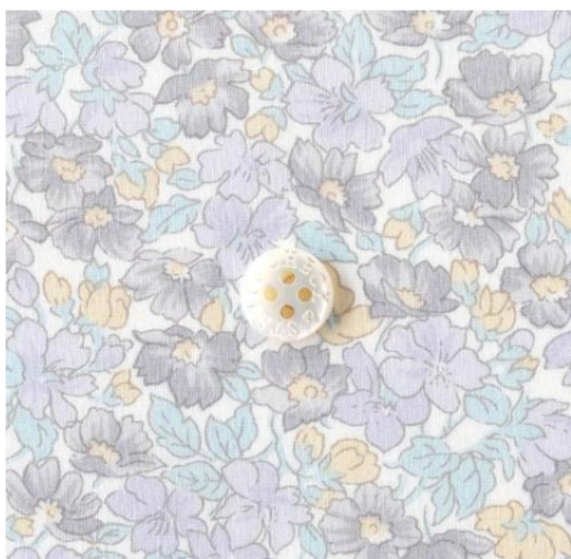
Coriace ©J23A(ラベンダーグレー系)