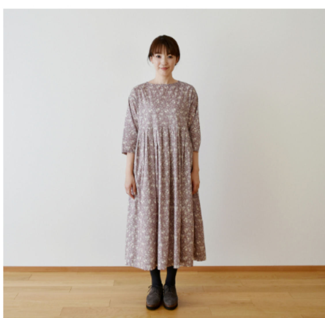
©J24C(ピンク系): 『CHECK&STRIPE my favorite 私の好きな服』(主婦と生活社) タックワンピース ※袖丈を-5cmしています。