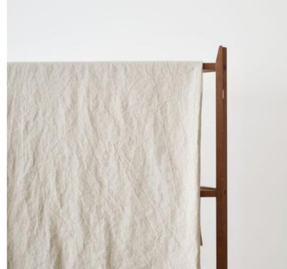
ハーフリネンツイル(2色)