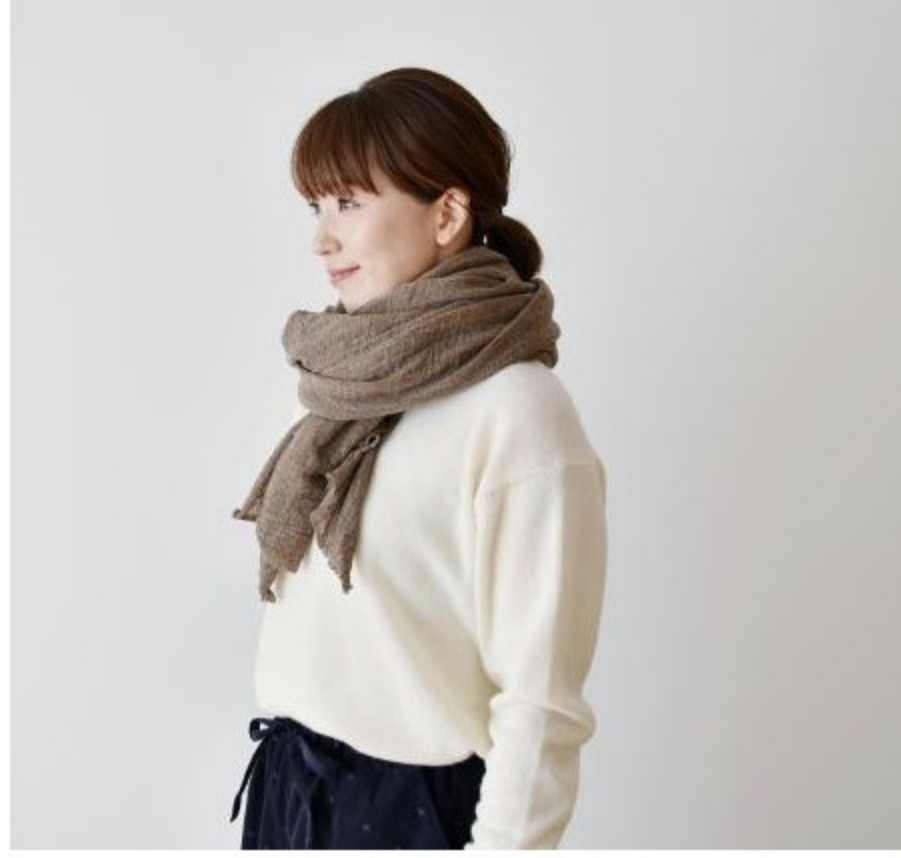
縫わずにそのまま使える！C&Sオリジナルウールガーゼストールニット(9色)