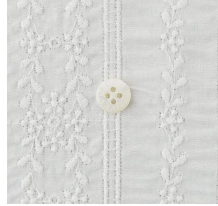
C&Sオリジナルコットンエッセルレース(2 items)