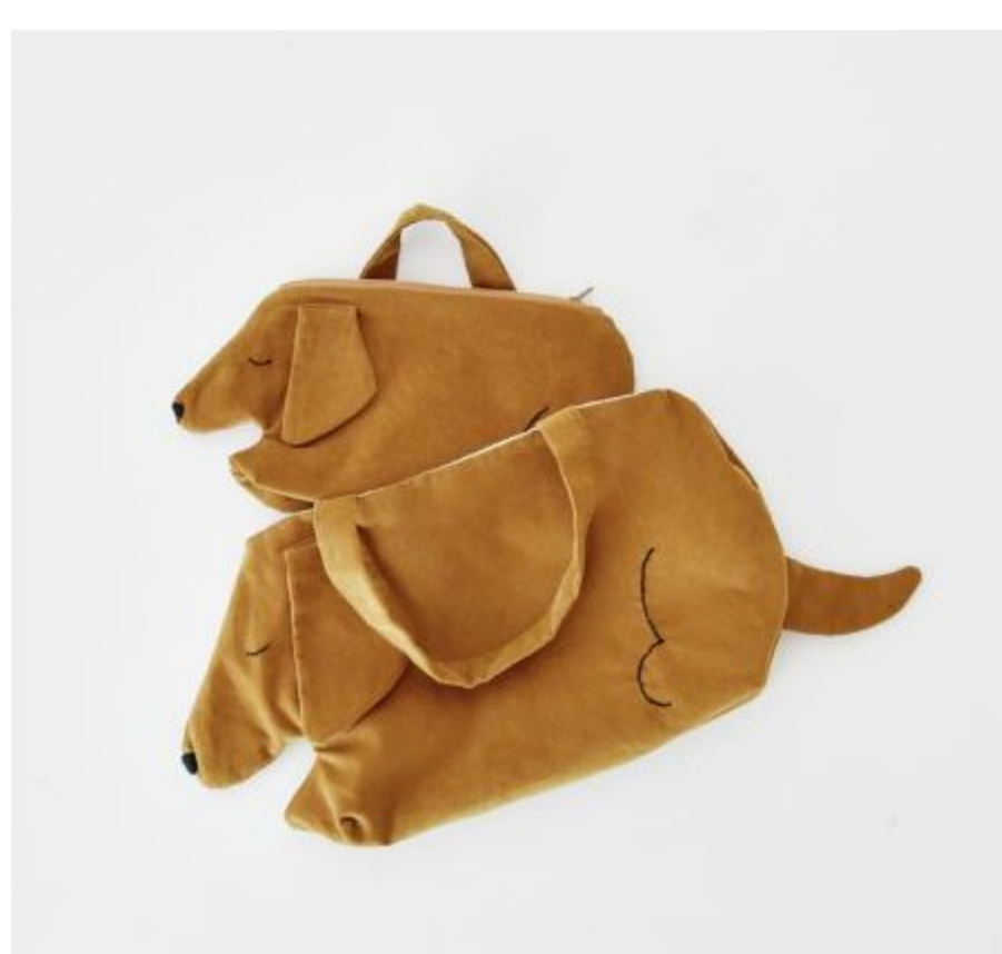
数量限定！INU bagとINU pouch(HANDMADE完成品) 3 items