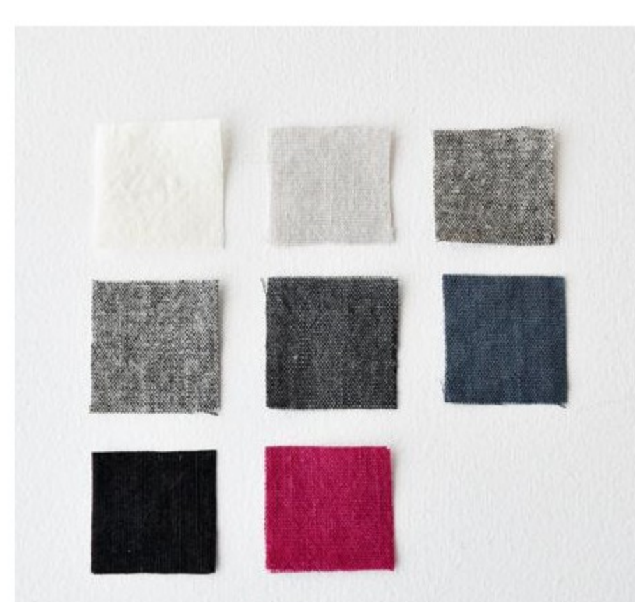
C&Sオリジナルリネウールリンレイヌ(8色)