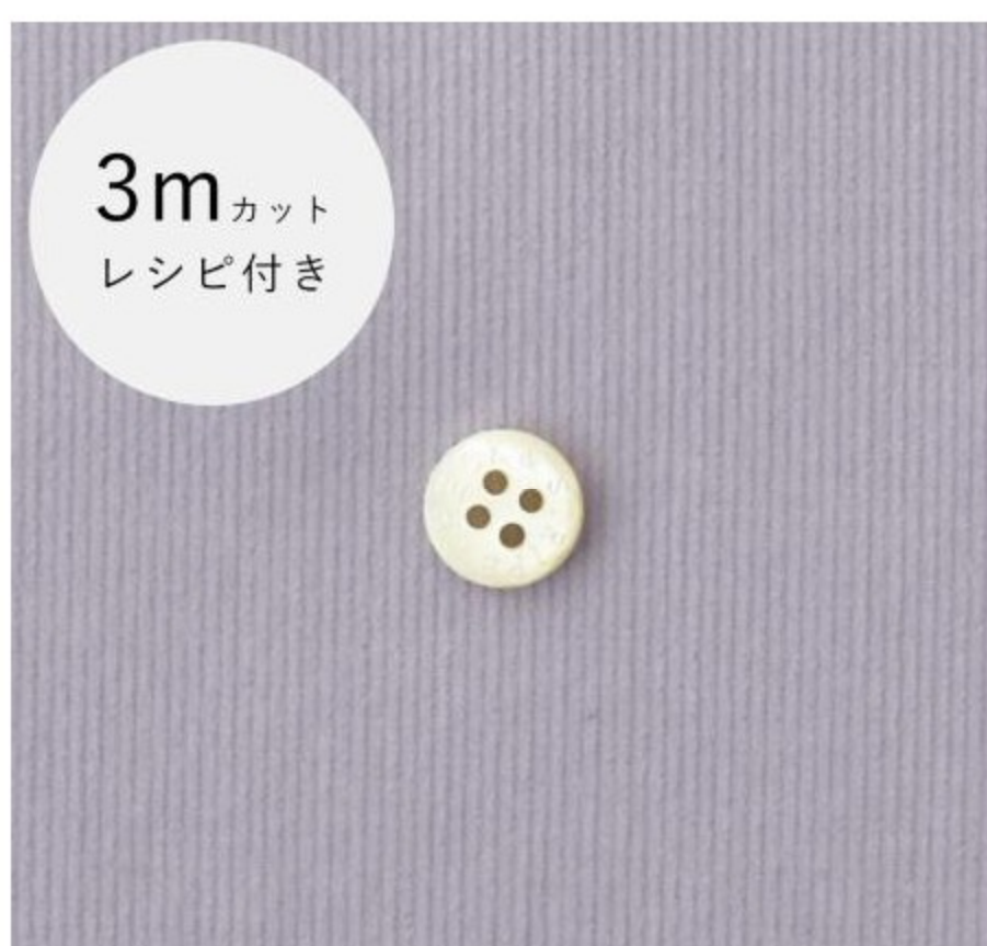
(10%OFF！着分3mカット)C&Sフレンチコーデロイ(レシピ付き)(11 items)