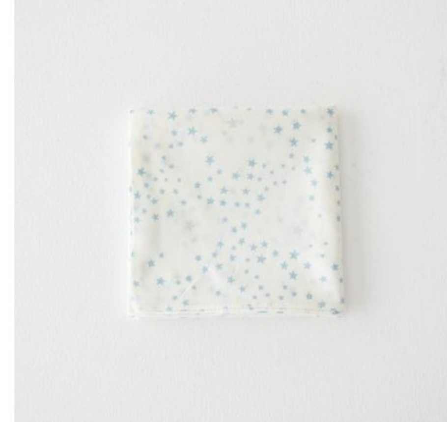
リバティプリントのハンカチ(3柄)