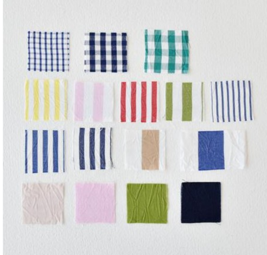
C&Sオリジナルsunny daysシリーズ(16 items)