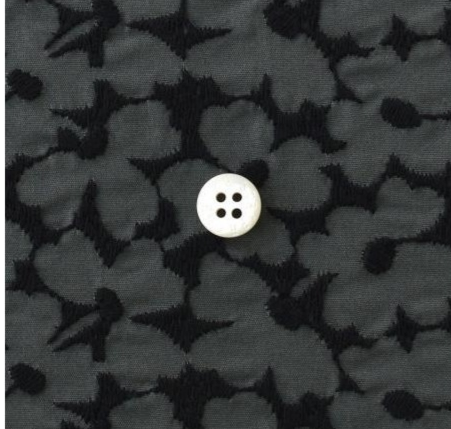
C&Sオリジナルコットンmarie flower(3 items)