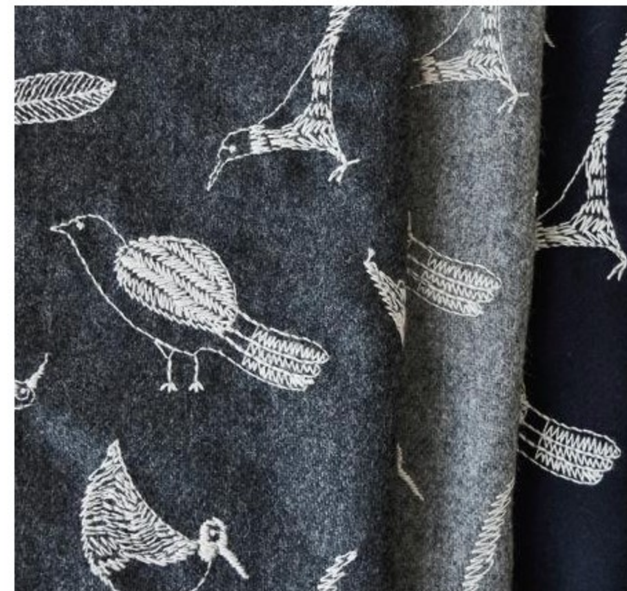
トラネコ手芸店 ウールに刺しゅう BIRD(3色)