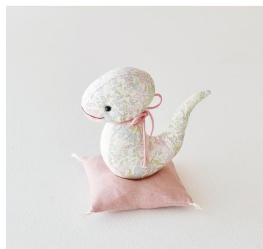
へびのぬいぐるみ(干支)のキット