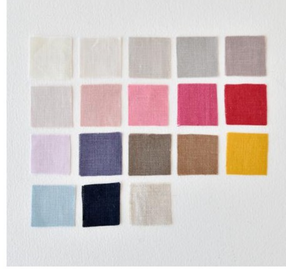
C&Sオリジナルカラーリネン(18色)