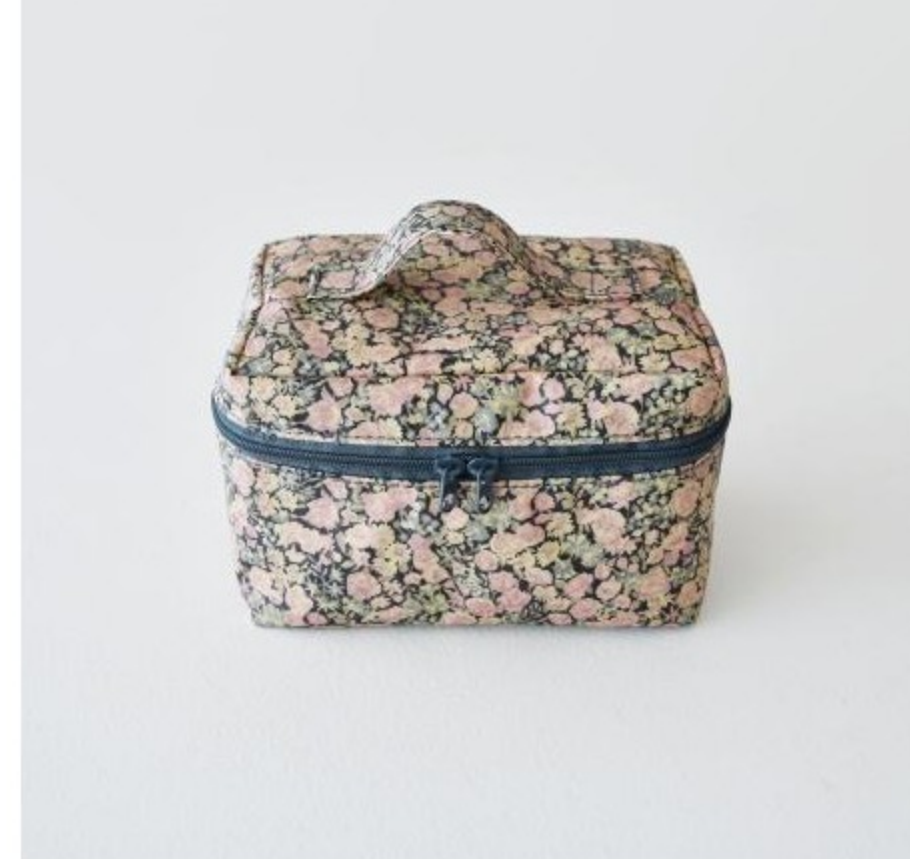
CHECK&STRIPEオリジナルリバティプリントラミネートのポーチ(6 items)