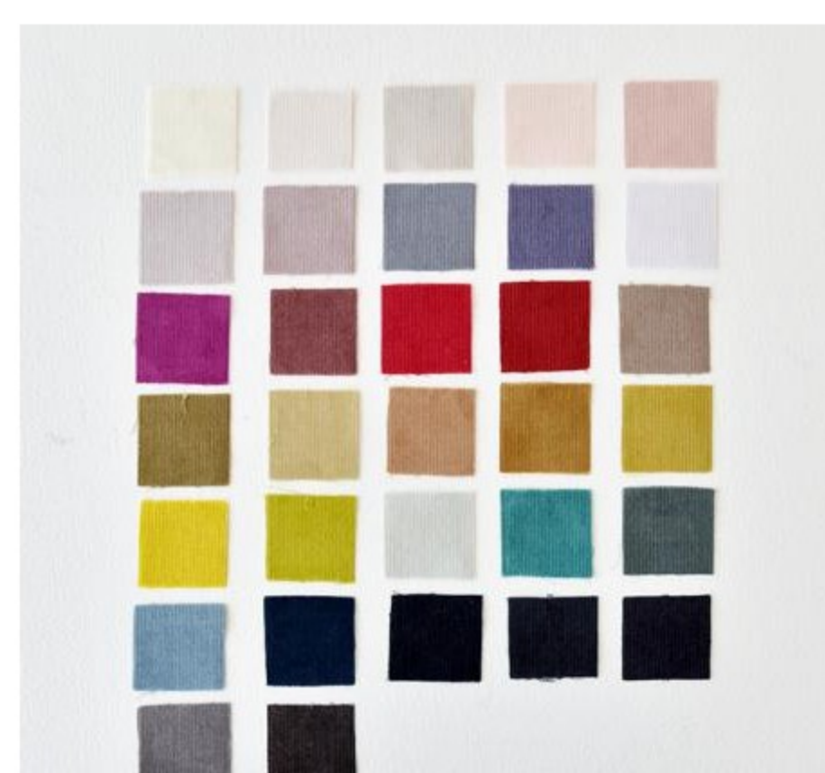
C&Sオリジナルフレンチコーデロイ(32色)