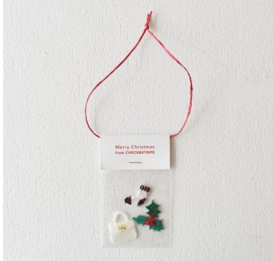
タグ・アップリケセット(2 items)