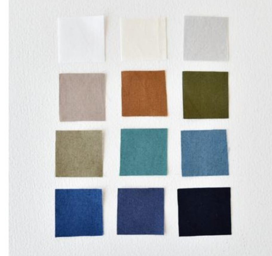
C&SオリジナルナチュラルコットンHOLIDAY(12色)