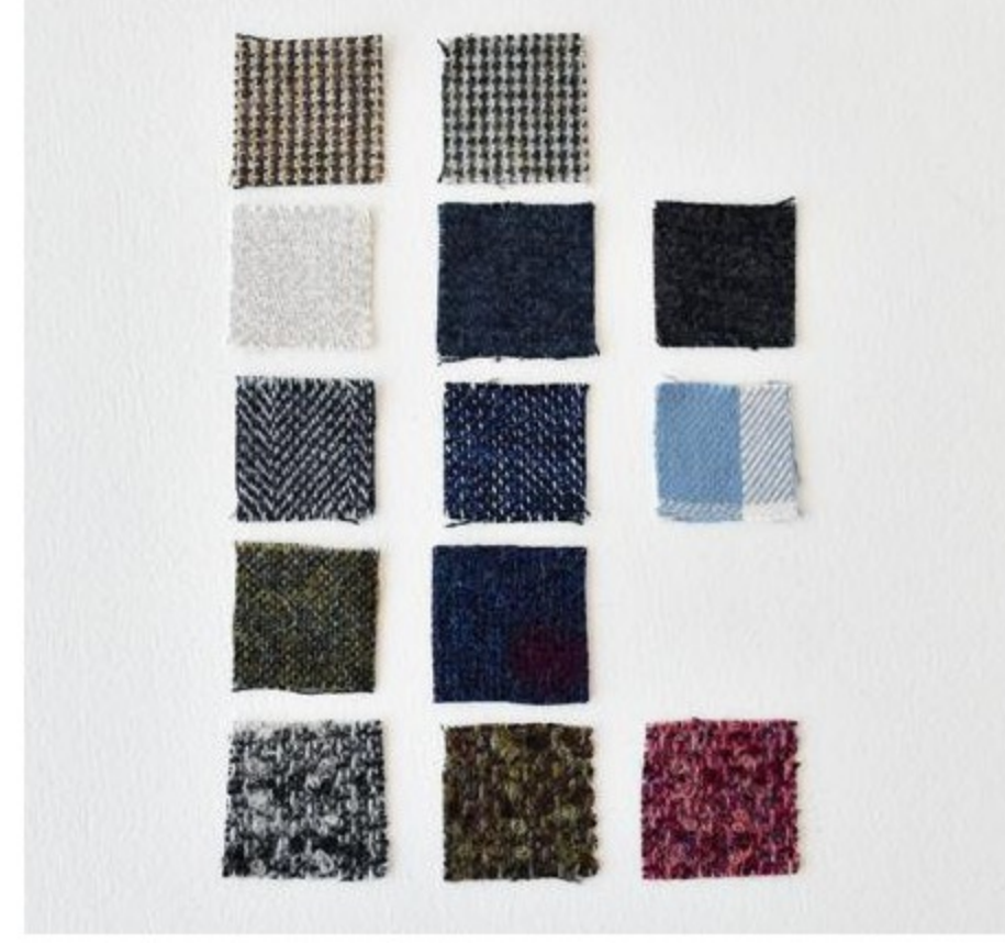
その他のウールや起毛コットンの布(13 items)