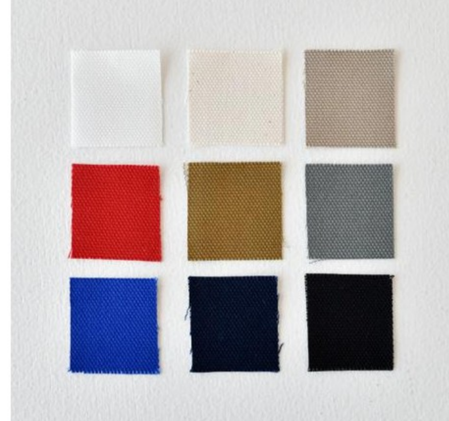
キャンバスライクなコットン「ハンパティくん」(9色)