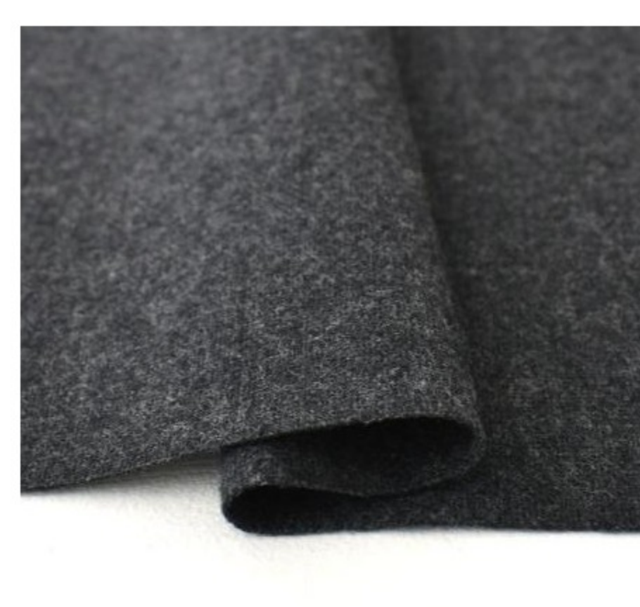
薄手のカシヤ混ウール(4色)