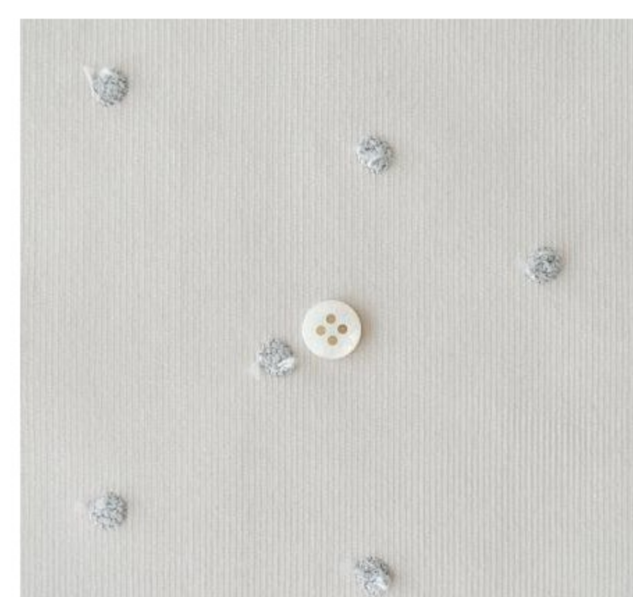
C&Sフレンチコーデロイに林檎の刺しゅう(3色)