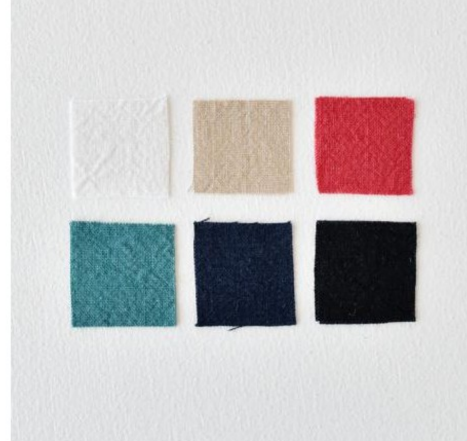
C&Sオリジナル洗いざらしのハーフリネンナチュラル(6色)