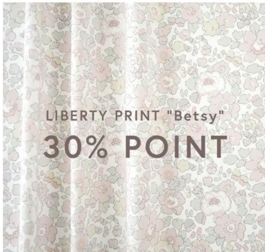
30%ポイント！リバティプリントBetsy特集(6 items)