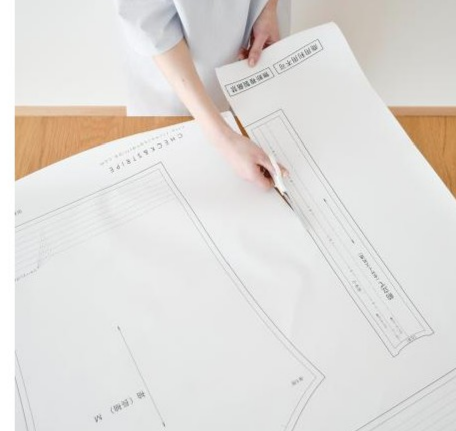
カットしてgood!パターン(40 items)