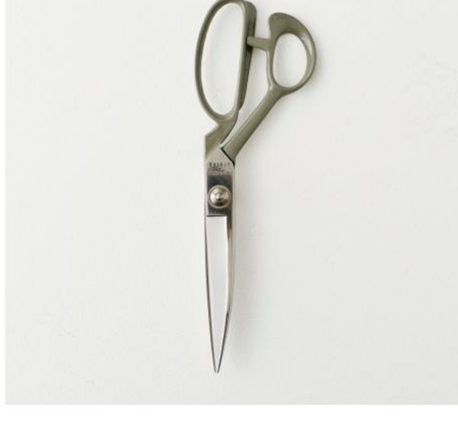
CHECK&STRIPEオリジナルはさみ(12 items)