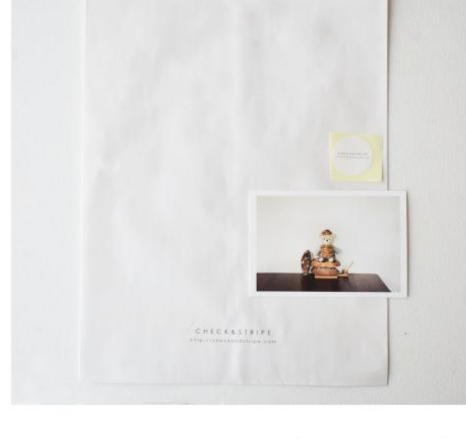
ラッピングセット(2 items)