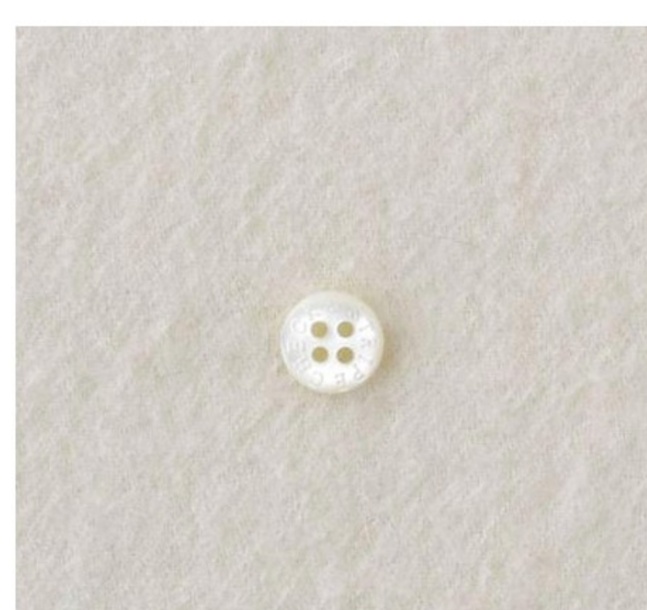
C&Sウールマフィユ(4色)