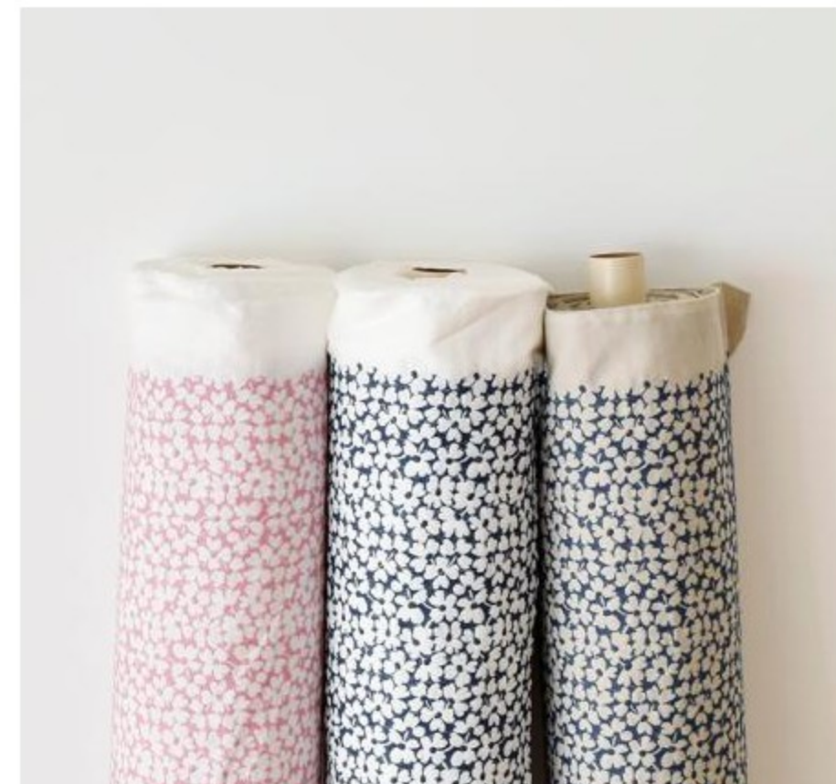
新色登場！C&Sオリジナルコットンmarie flower petite(6色)