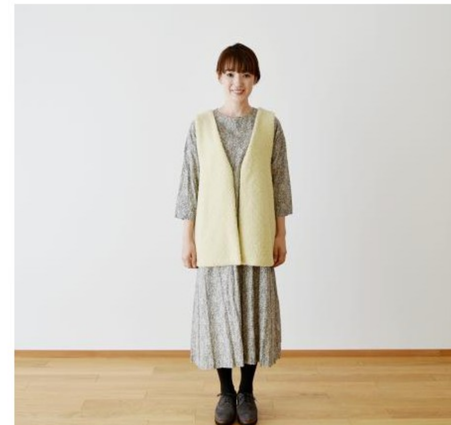
ムートンライクプレミアムポア(4色)