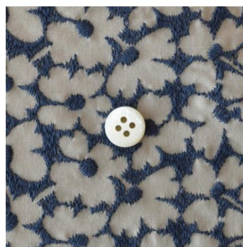
ソイラテにアイアンブルー(新色)