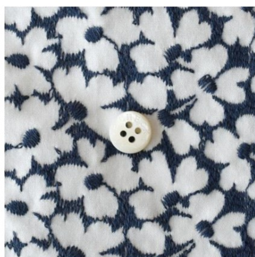
白にアイアンブルー(新色)