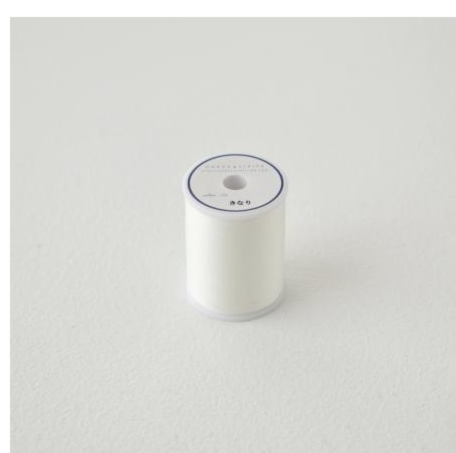
副資材(ミシン糸など)