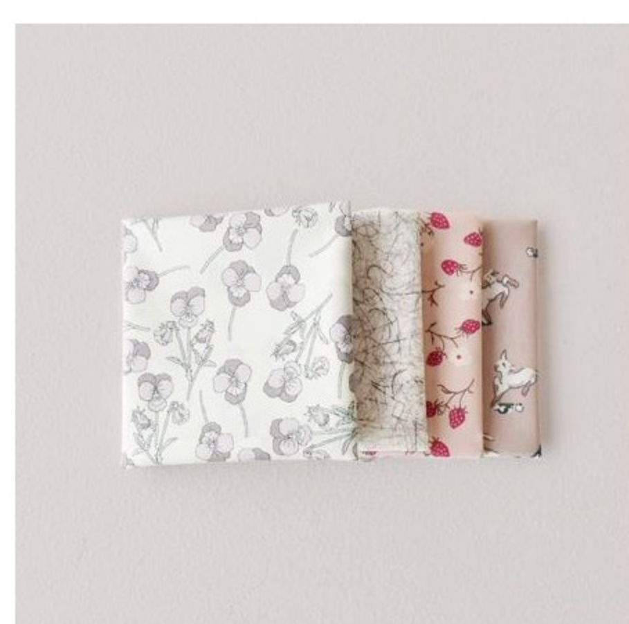
フレンチカラー系