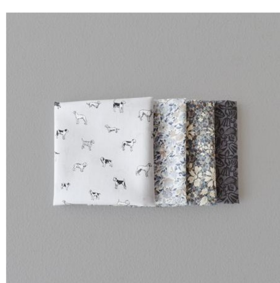
グレー・ブラウン系