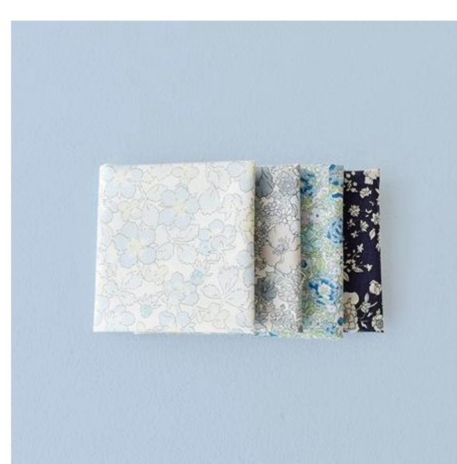
ブルー・ネイビー系