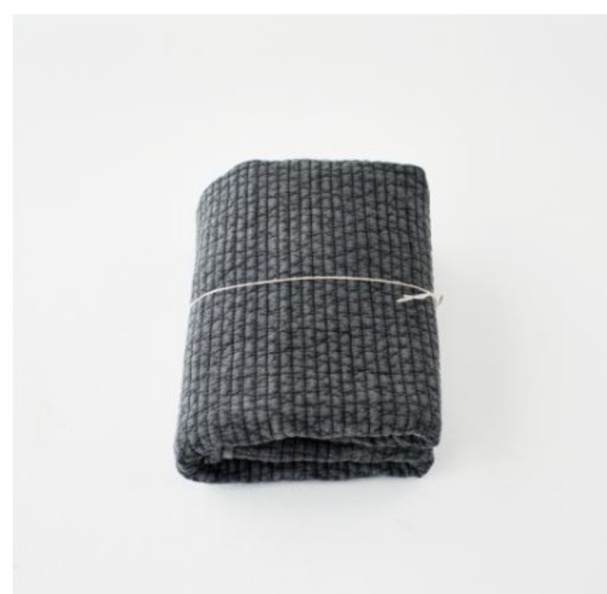
チャコールグレー