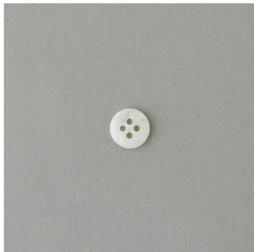
ライトグレージュ