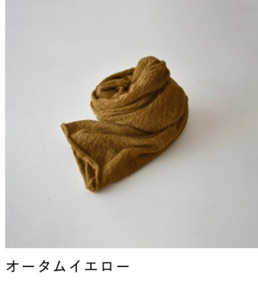
オータムイエロー