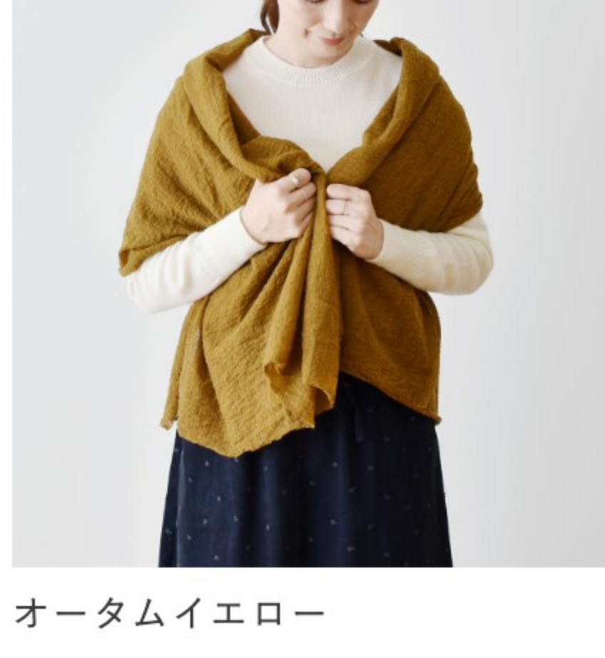
オータムイエロー