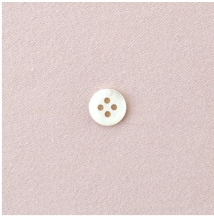
グレイッシュピンク