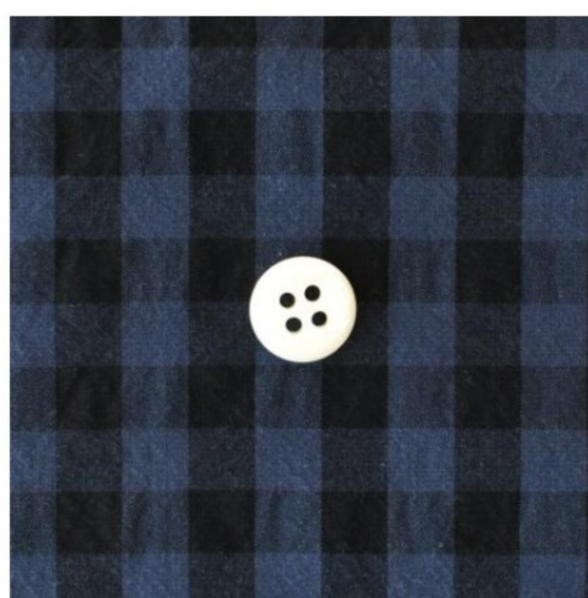
ギンガム ブルー×ブラック(7mm幅)(新色)