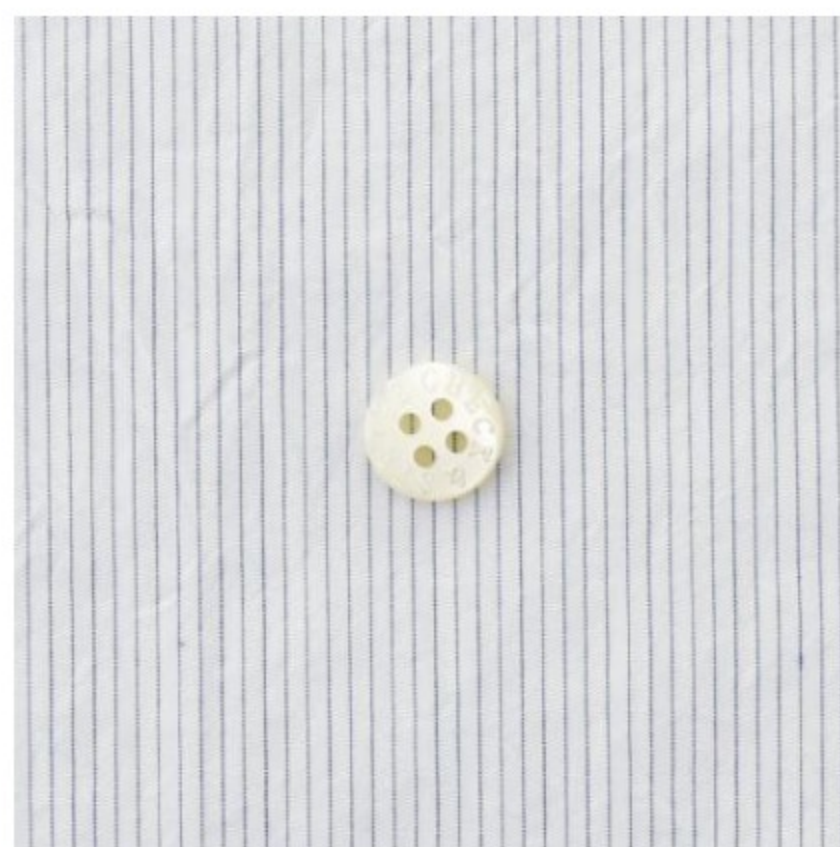
ピンストライプ ブルー