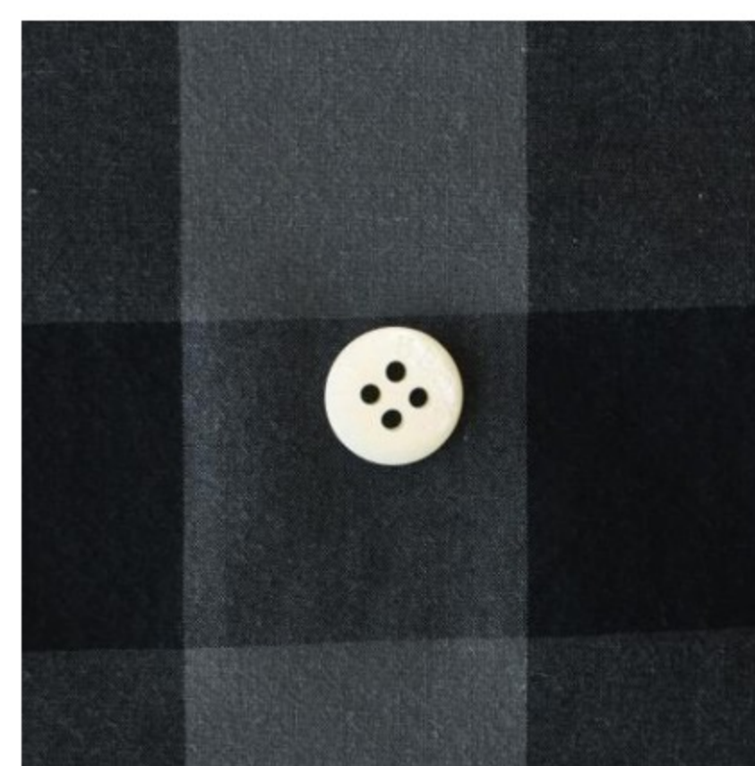
ギンガム ダークグレー×ブラック(ブロックチェック)(新色)