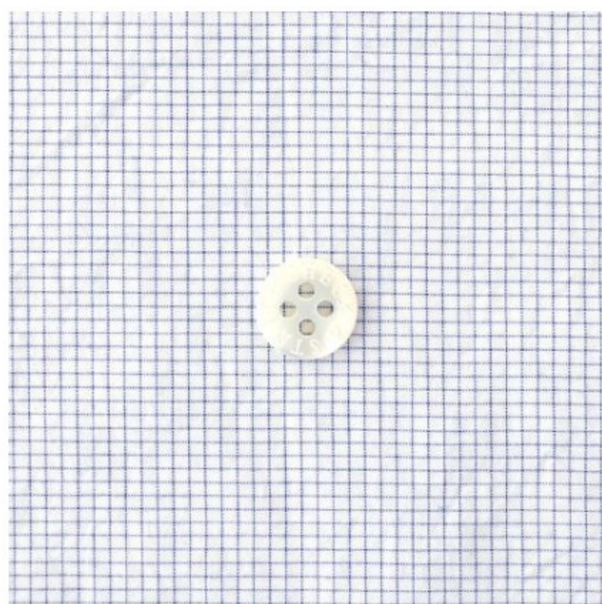
ピンチェック ブルー