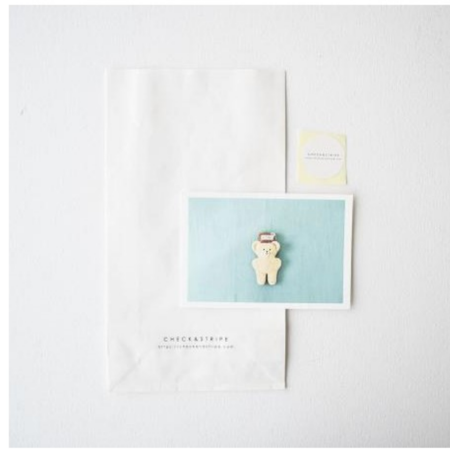
ラッピングセット (2 items)