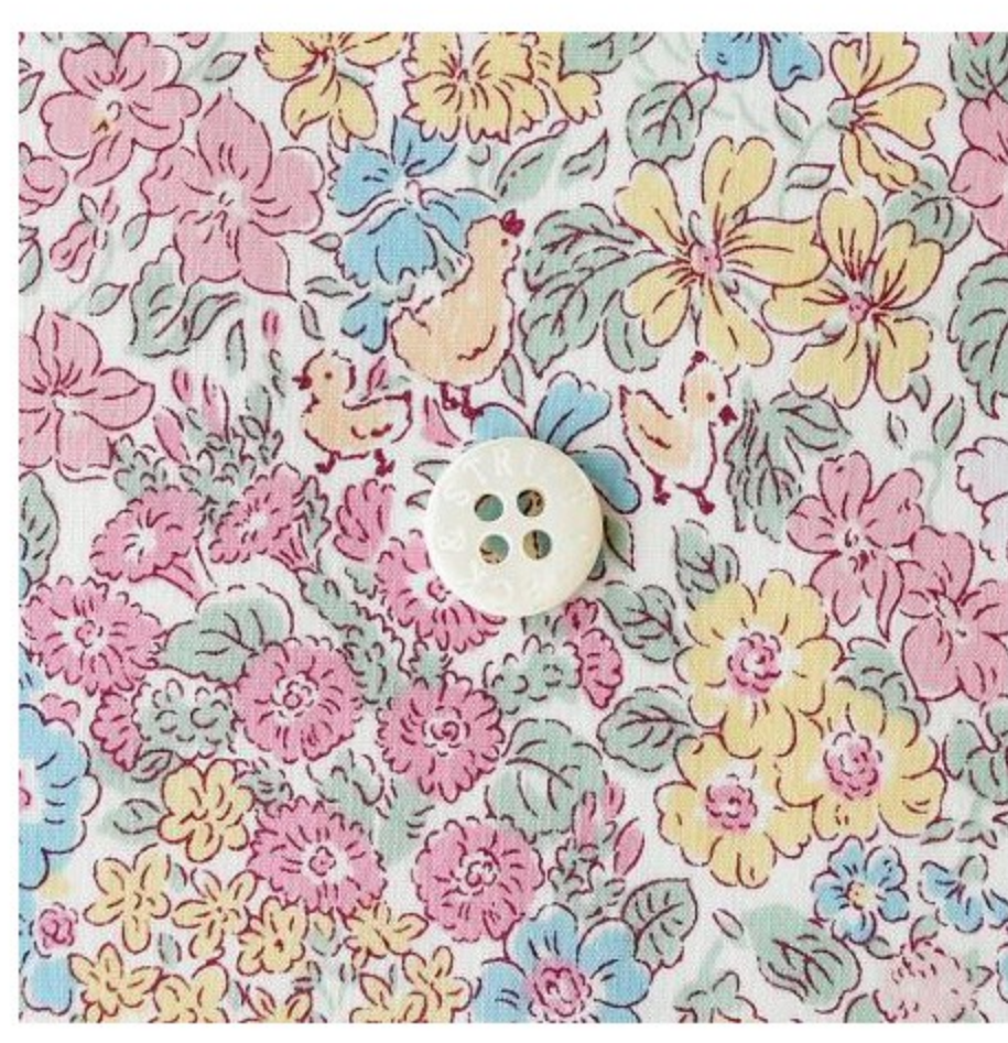
タナローン Sana Louise (4色)