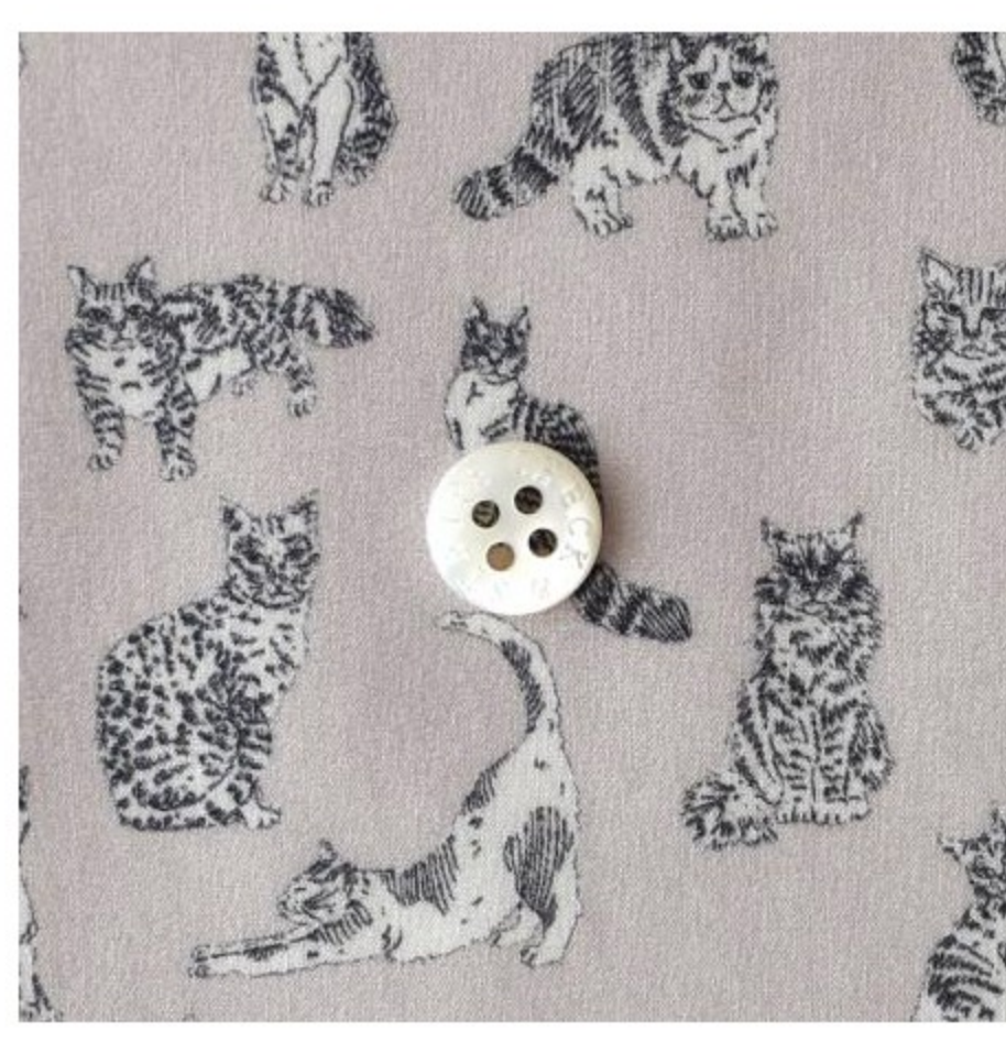
タナローン Meow-petit (3色)