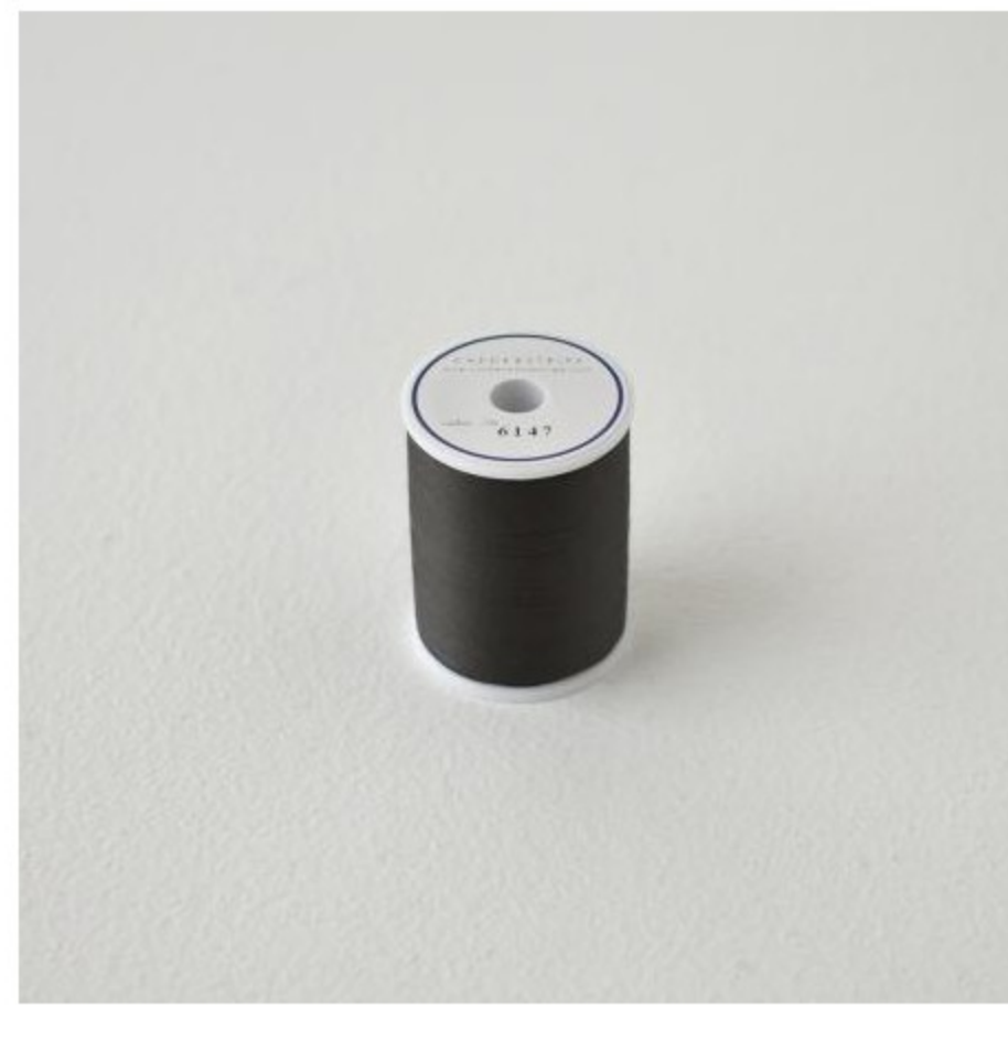
副資材・ミシン糸など