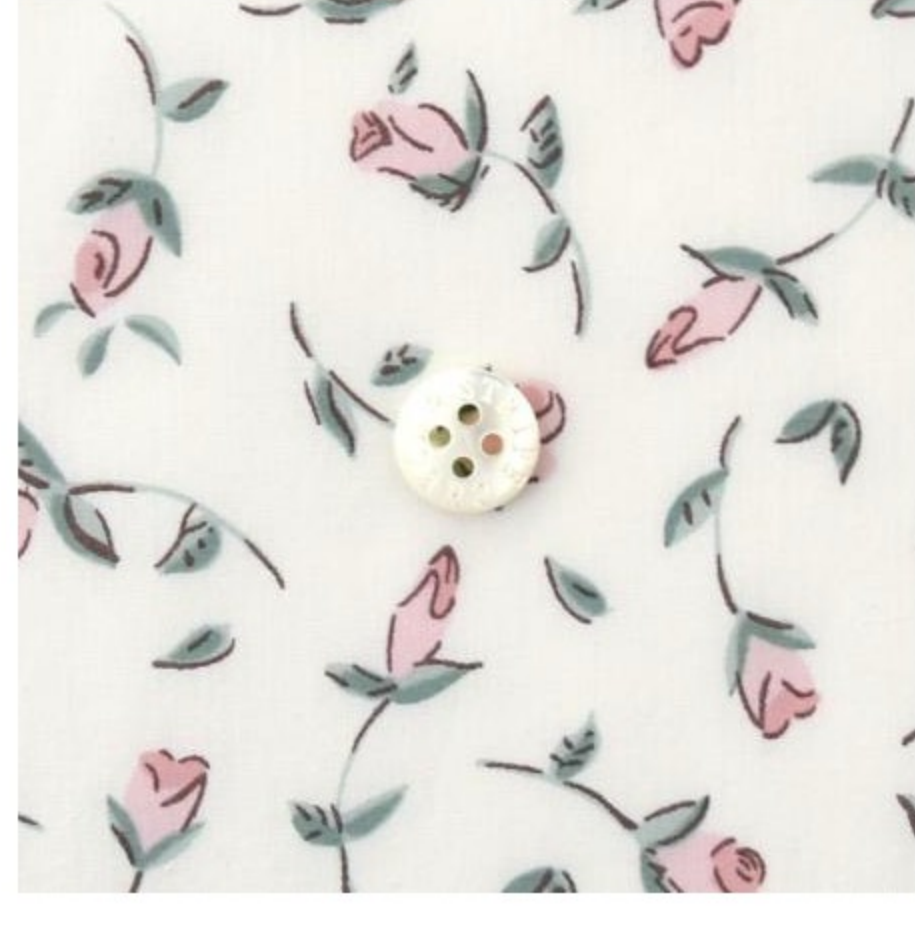
CHECK&STRIPE セレクト ラミネート (8 items)