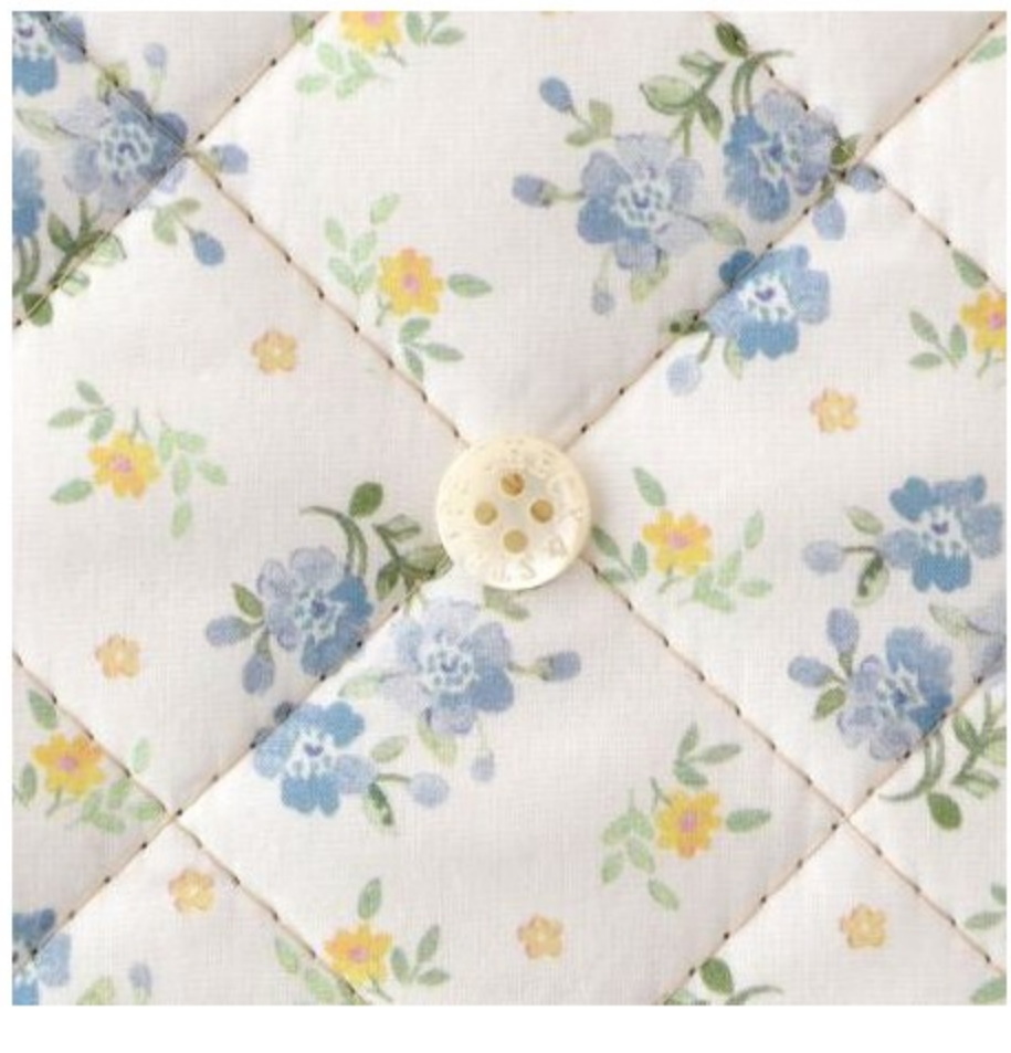
CHECK&STRIPE セレクト キルティング (4 items)