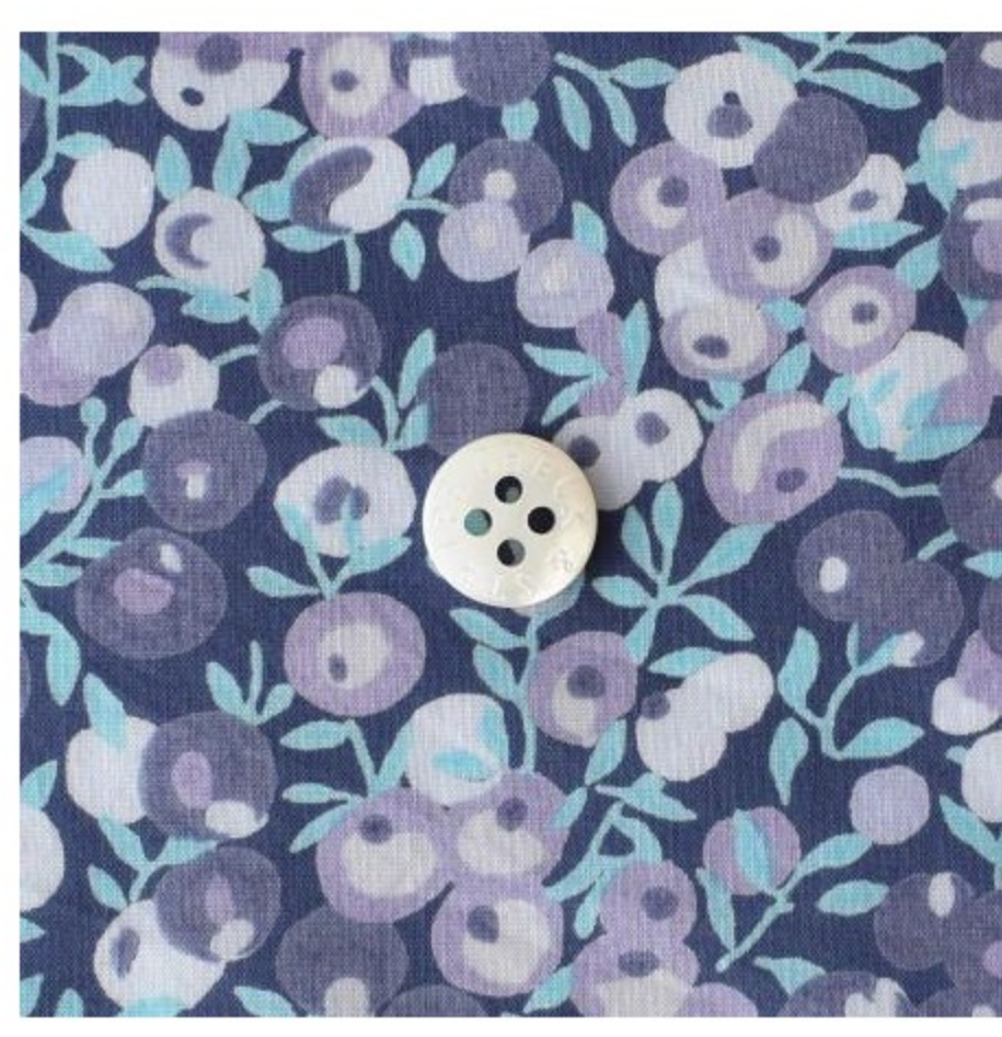
タナローン Wiltshire (3色)