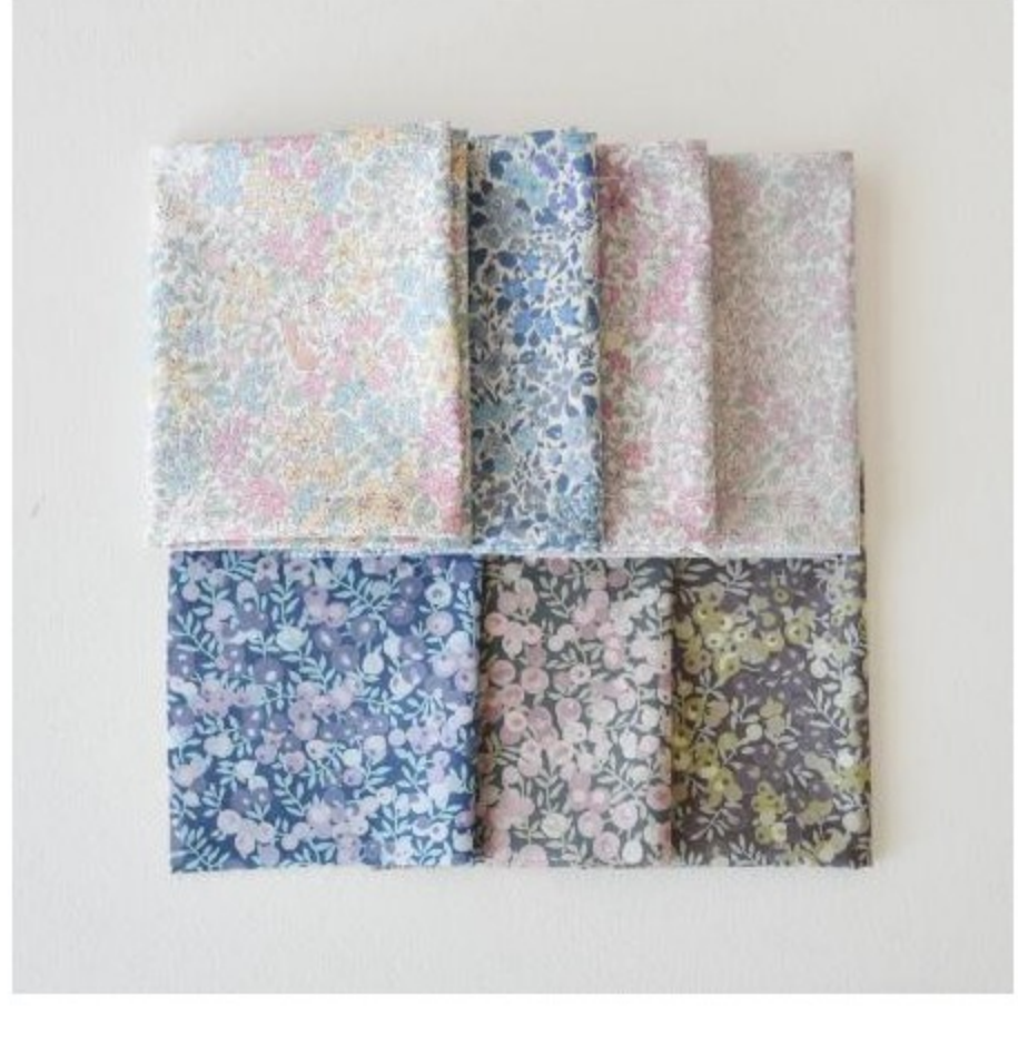
タナローン カットクロス セット (2 items)