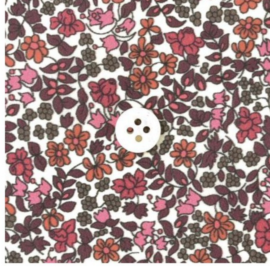
CHECK&STRIPE セレクト ナイロンタフタ (7 items)