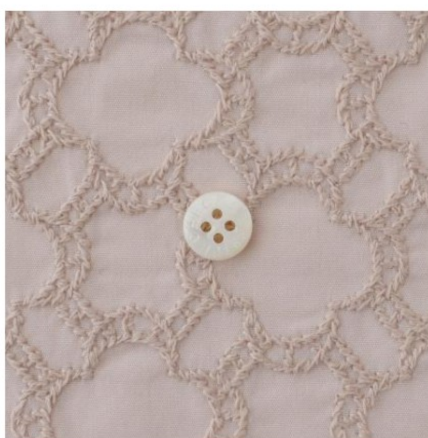
グレイッシュピンクにピンクベージュ