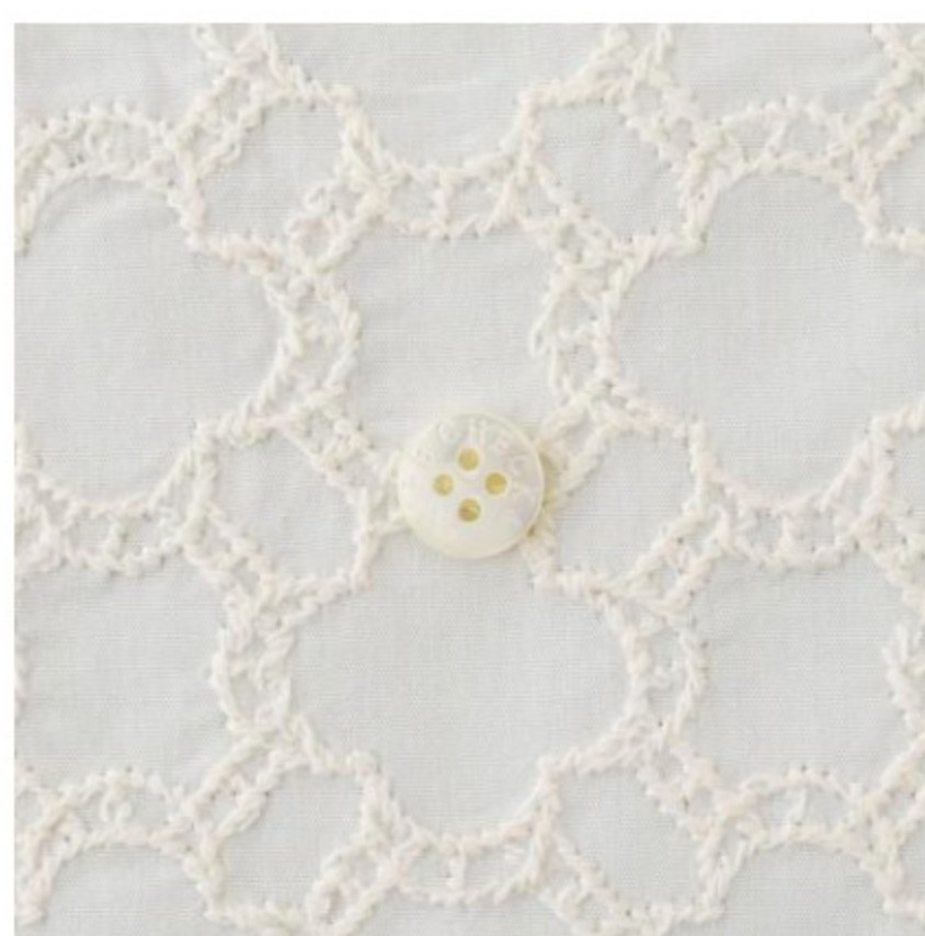
ホワイトにアイボリー