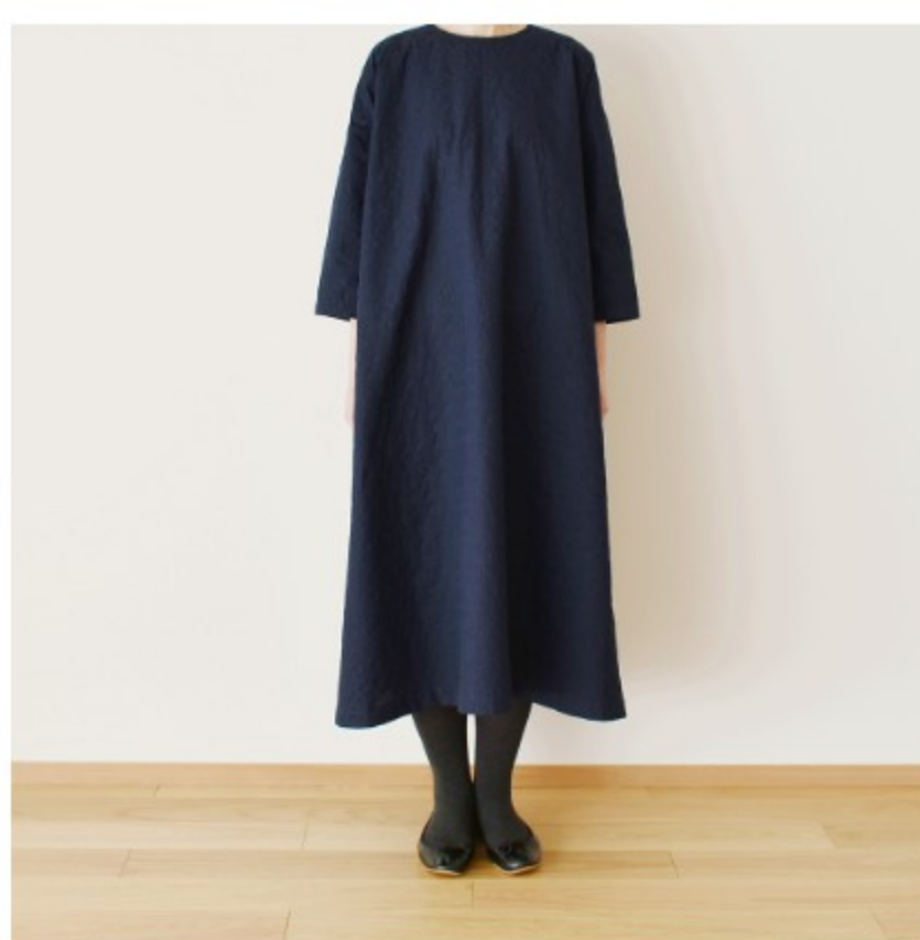
スタンダードネイビーにダークネ イビー:『CHECK&STRIPEのお とな服 ソーイング・レメディ―』 (文化出版局) シンプルAライン ワンピース ※用尺:S 3.1m、M 3.4m、L 3.5m