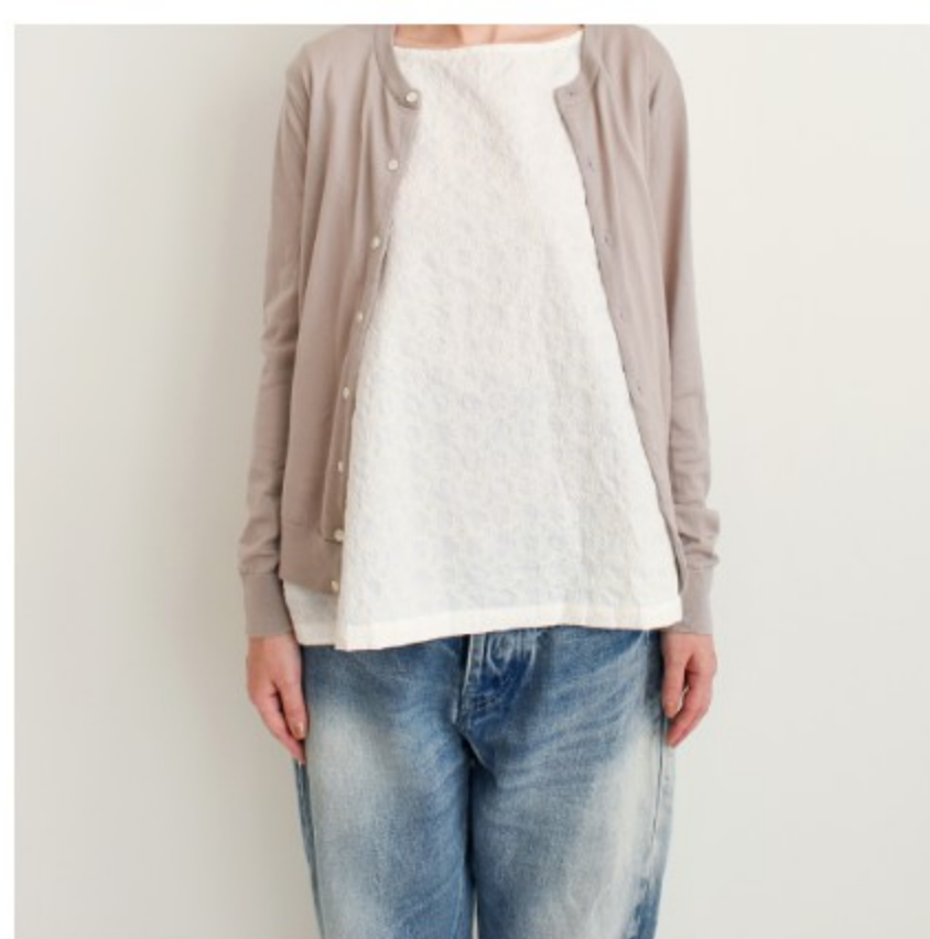
ホワイトにアイボリー: 『CHECK&STRIPE SEW HAPPY』(世界文化社)サイドタ ックのポートネックブラウス