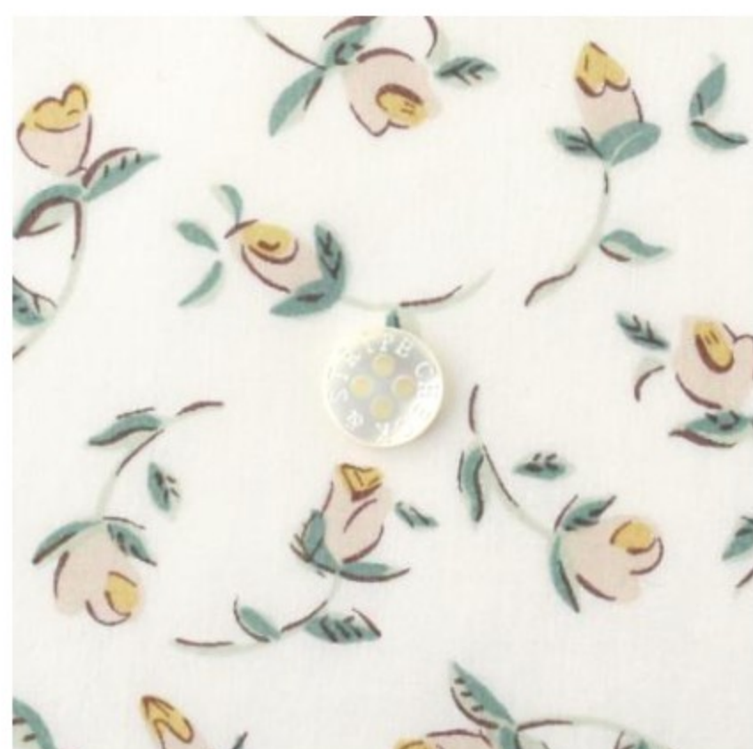
◎J20D(マッシュルーム系)