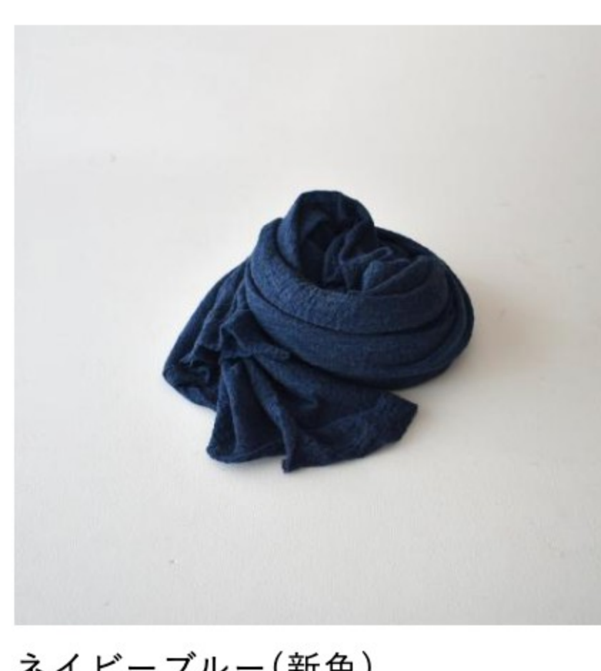
ネイビーブルー(新色)