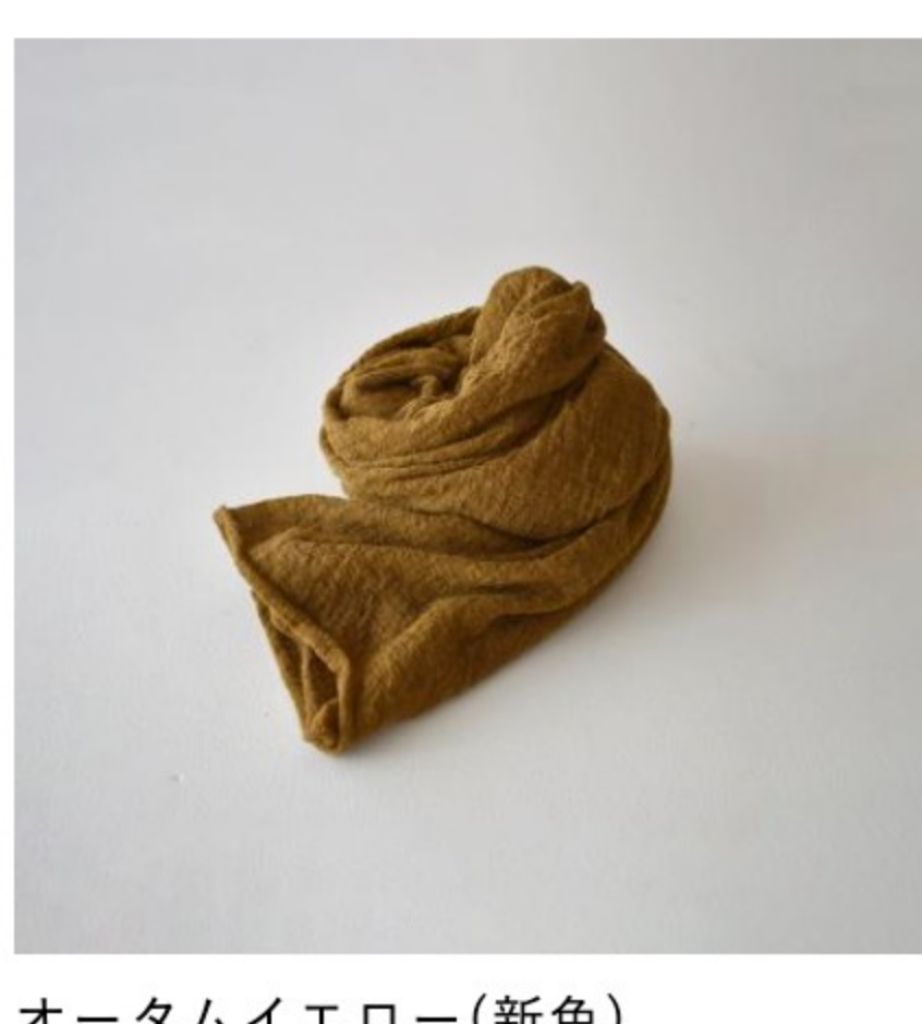
オータムイエロー(新色)