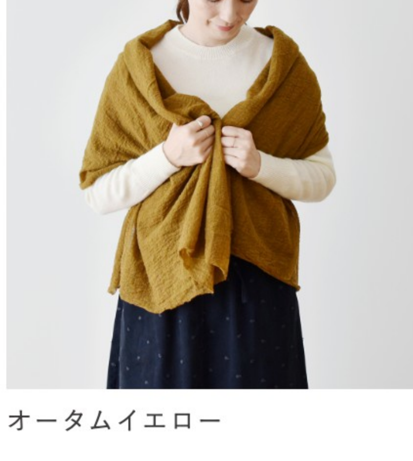
オータムイエロー