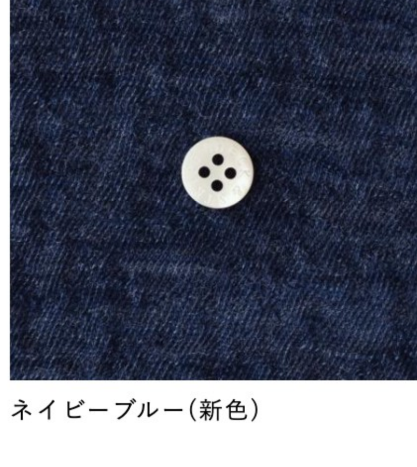
ネイビーブルー(新色)