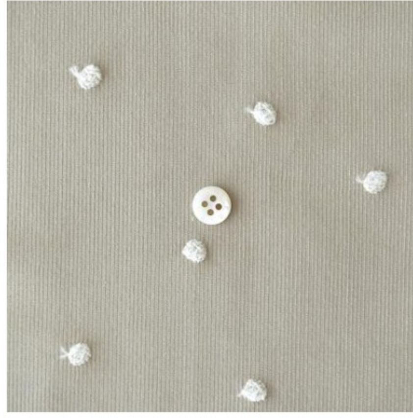
ソイラテにアイボリー(新色)