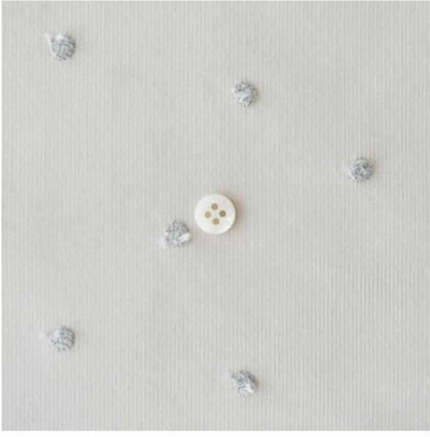
マッシュルームにアッシュ(新色)