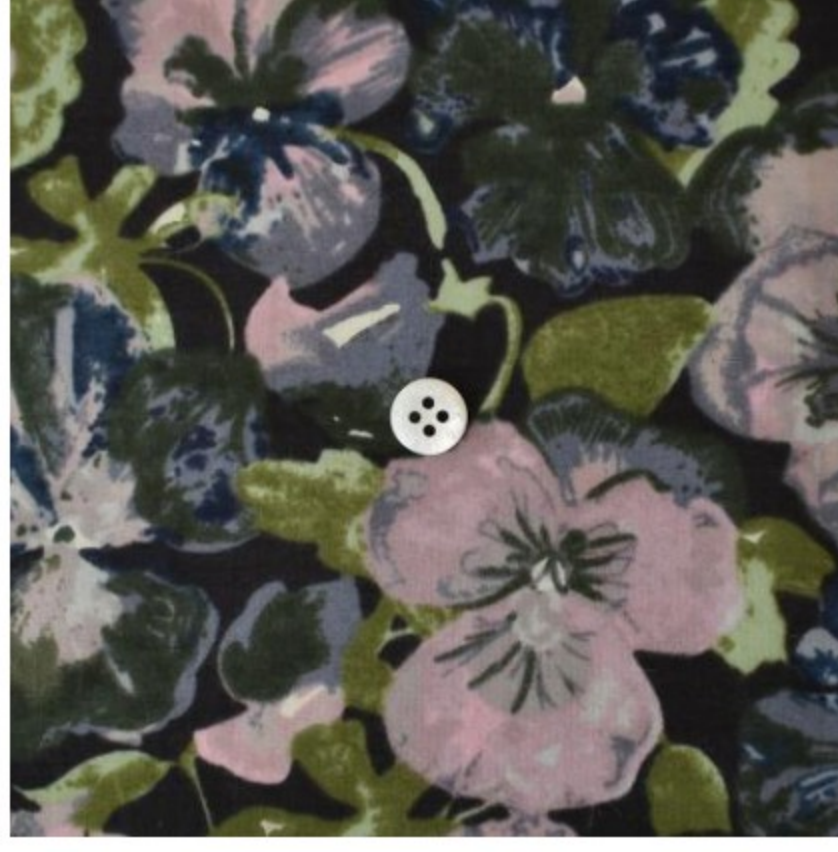
WCS(ピンク・ブルー系)