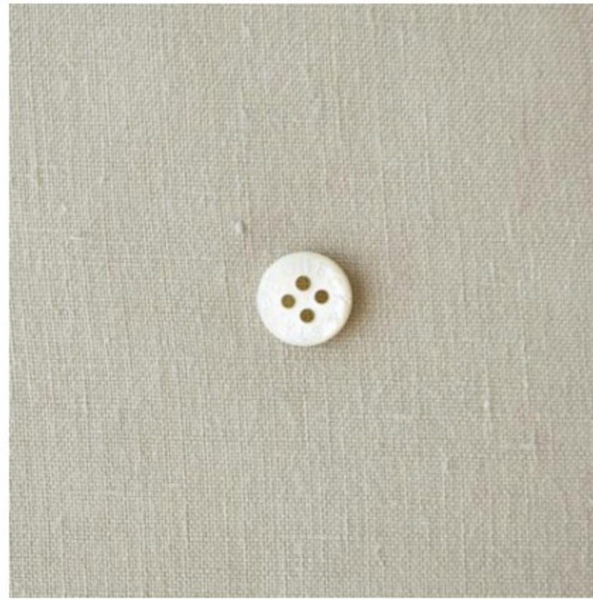
ライトグレージュ