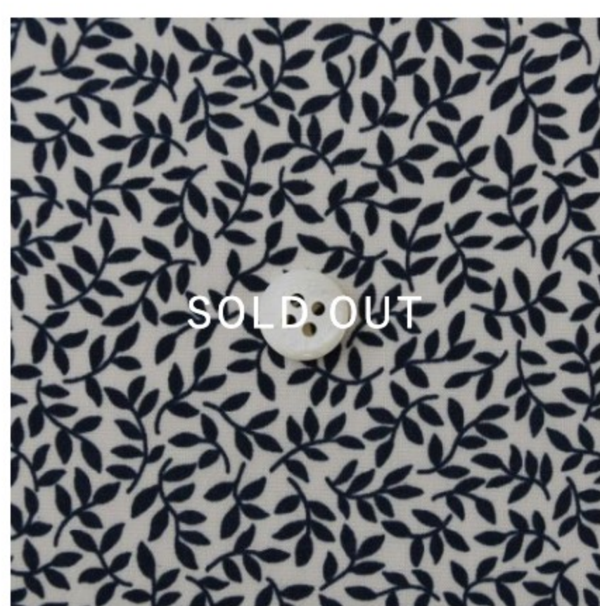
マッシュルーム地にネイビー