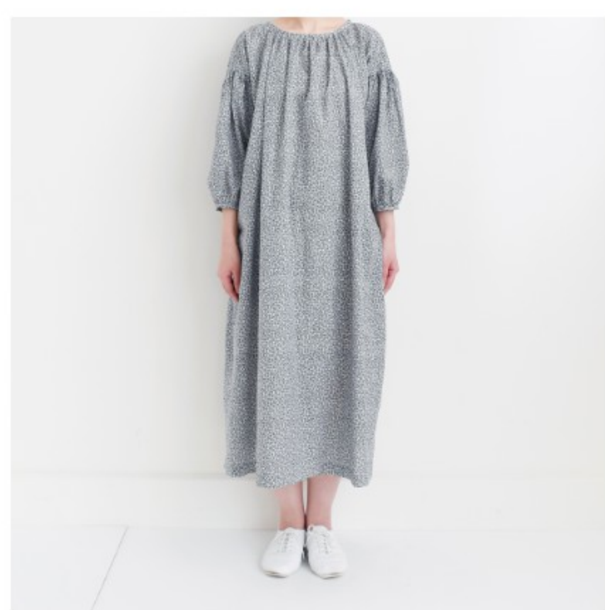
マッシュルーム地にネイビー: 『CHECK&STRIPEのおとな服 ソーイング・レメディ―』(文化 出版局) スタンダードギャザー ワンピース