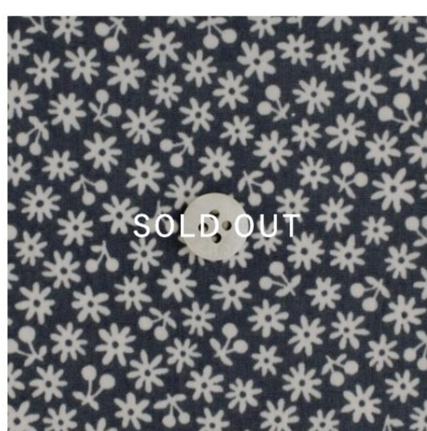
ダークグレー地にマッシュルーム