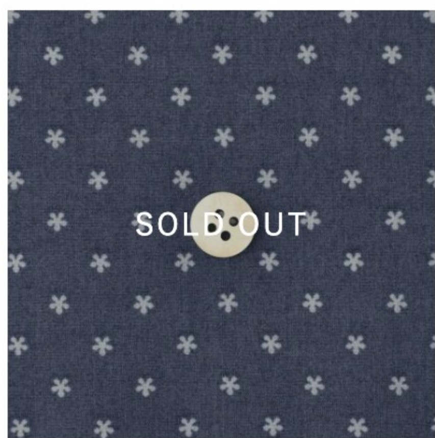
ネイビーラベンダー