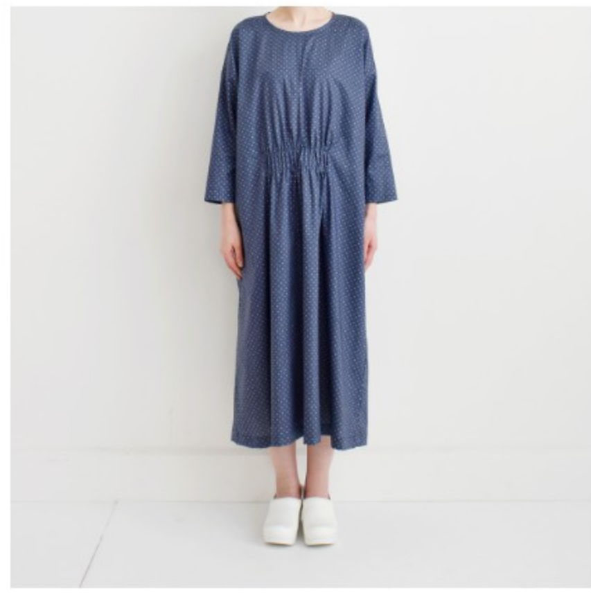
ネイビーラベンダー: 『CHECK&STRIPEのおとな服 ソーイング・レメディ―』(文化 出版局) フロントギャザーのワン ピース