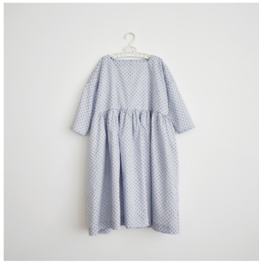
ベールラベンダー: 『CHECK&STRIPEの子ども服 ソーイング・ナーサリー』(文化 出版局) スクエアネックのギャザ ーワンピース