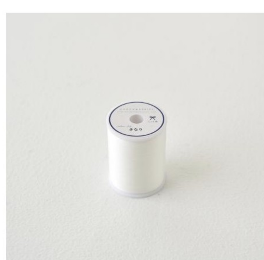
ミシン糸・本など