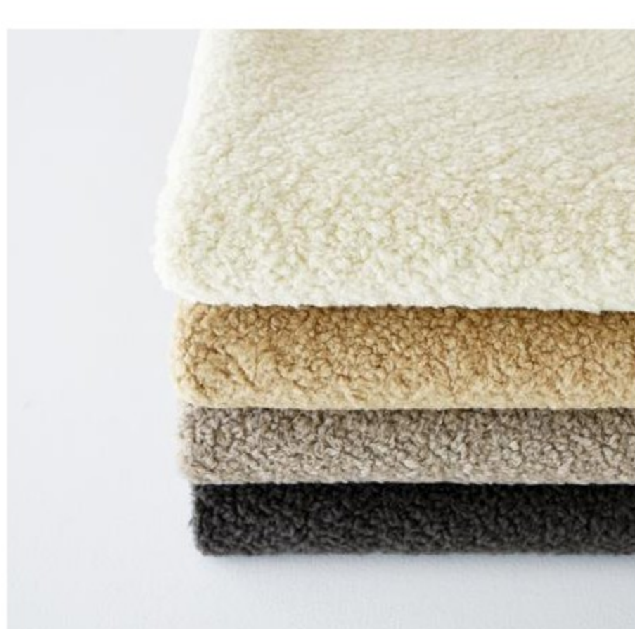
新商品！ムートンライクブレミアムボア(4色)