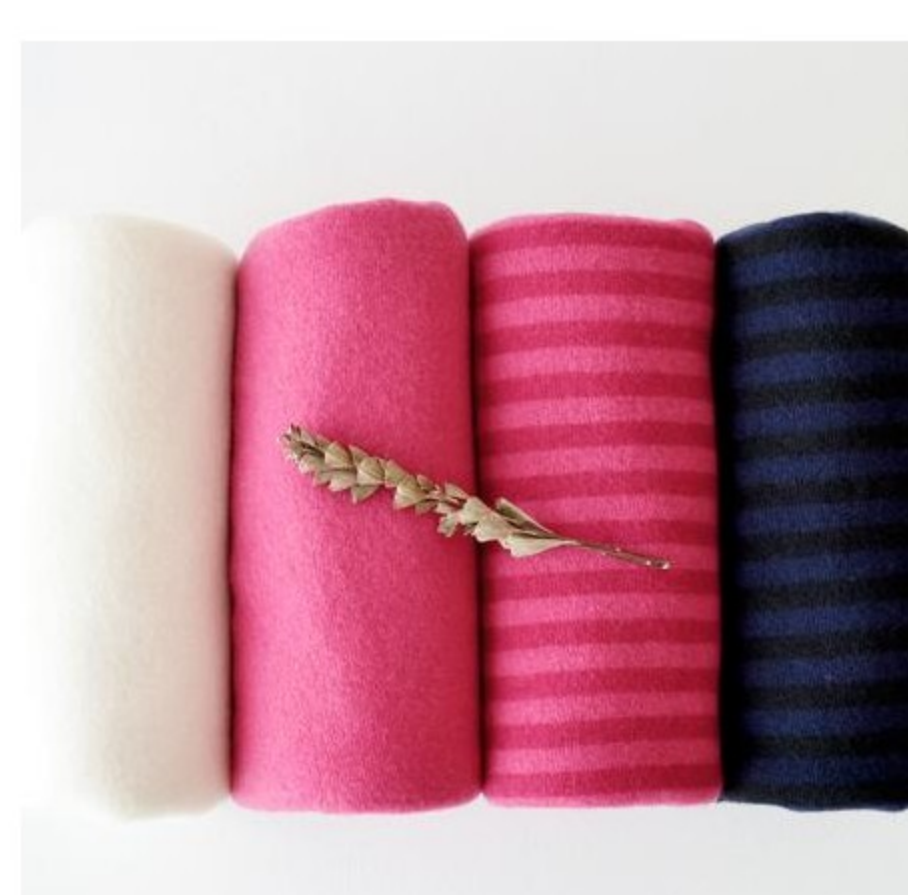
C&Sオリジナルカシミアフェイユ(22色)