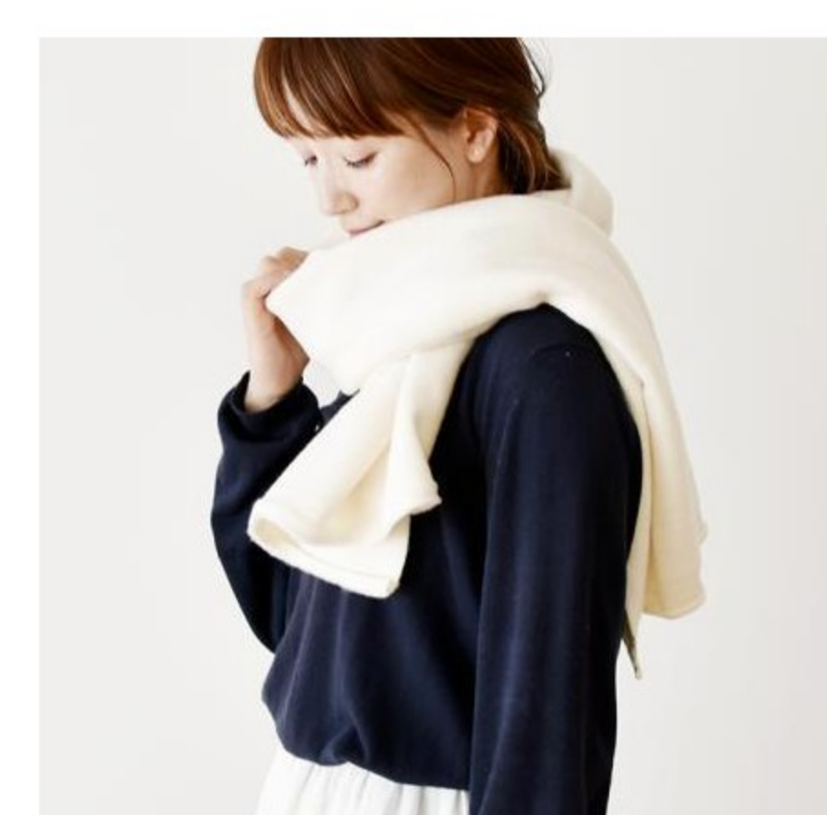
C&Sオリジナルシルクフリース(2色)