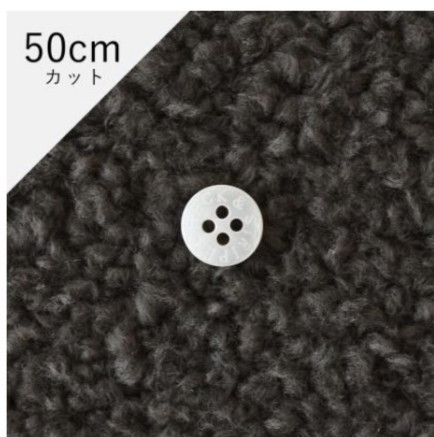
グレイッシュブラウン