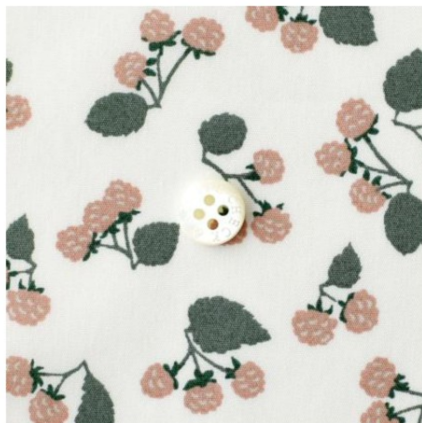
ホワイトにストロベリークリーム