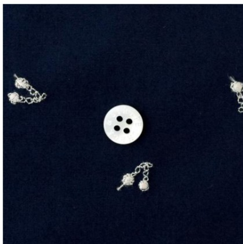
スタンダードネイビー