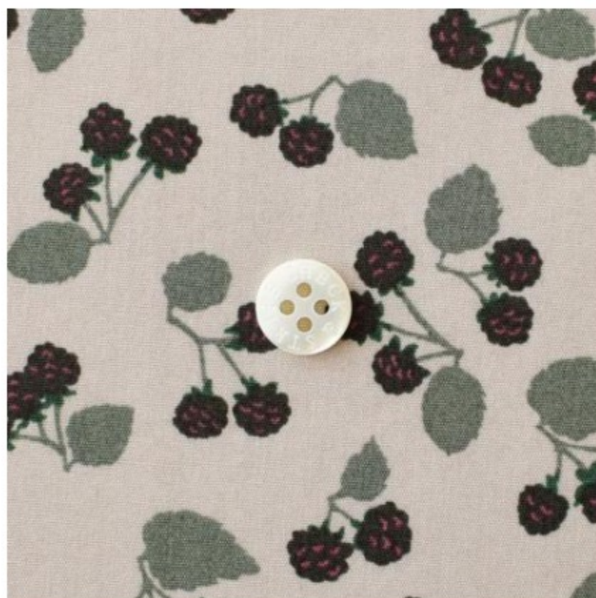
グレージュに木いちご