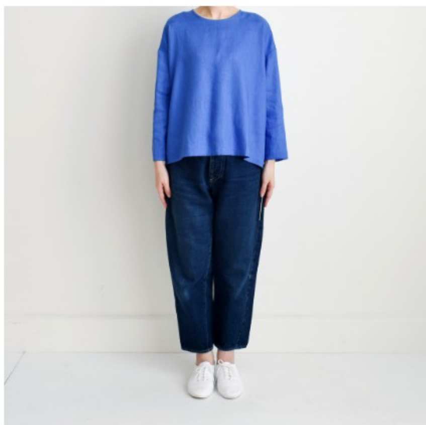
マリンプルー:『CHECK&STRIPE my favorite 私の好きな服』(主婦と生活社)後ろボタンのプルオーバー