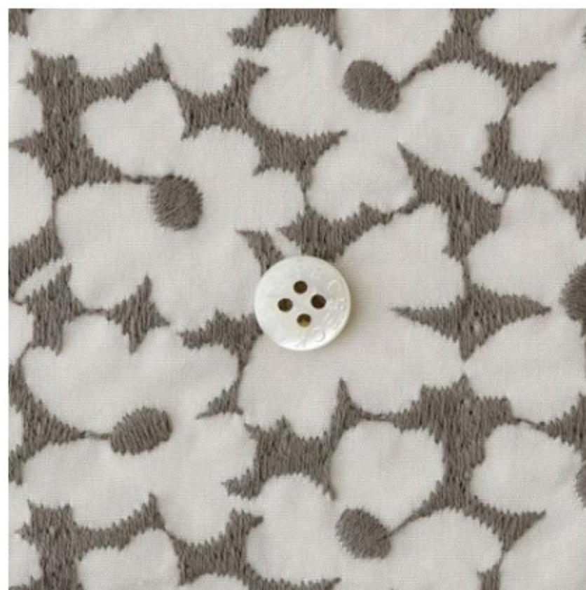
マッシュルームにダークグレー