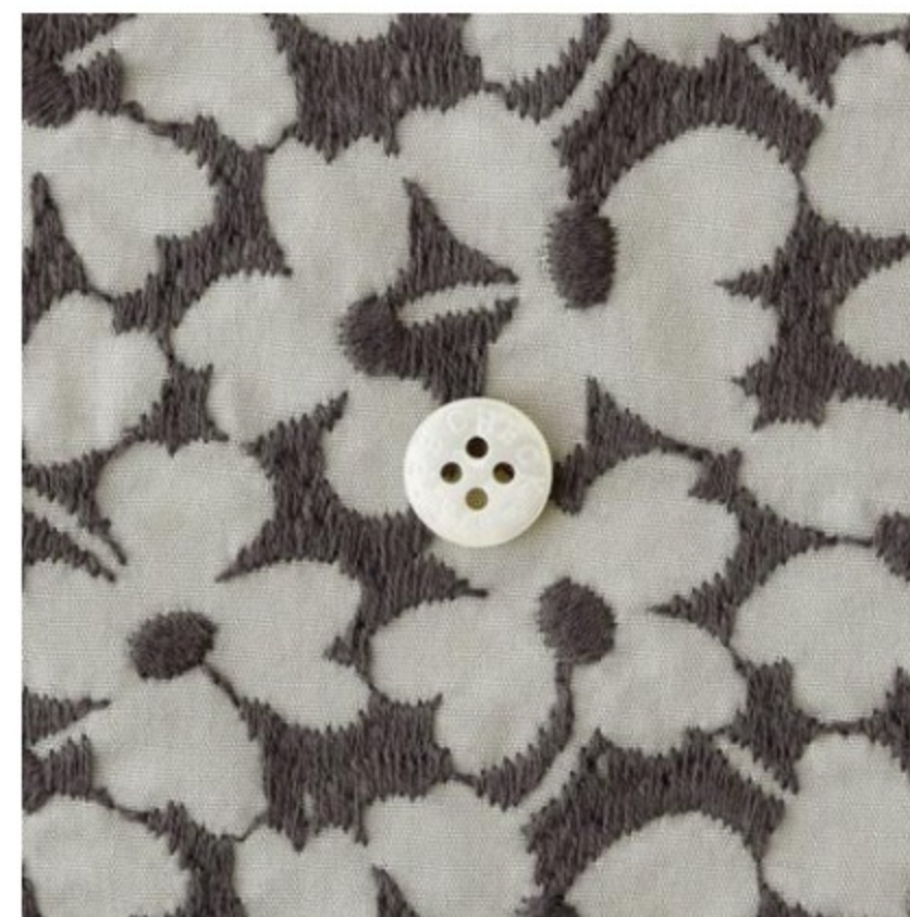
ストーンにスチールグレー