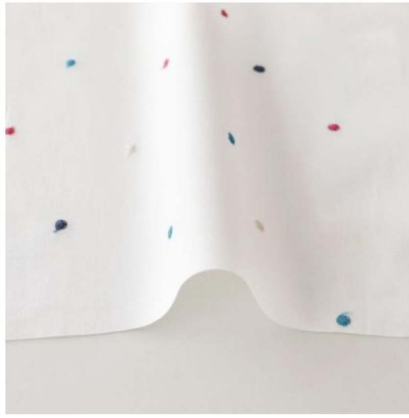
ホワイトにトリコロール風カラー