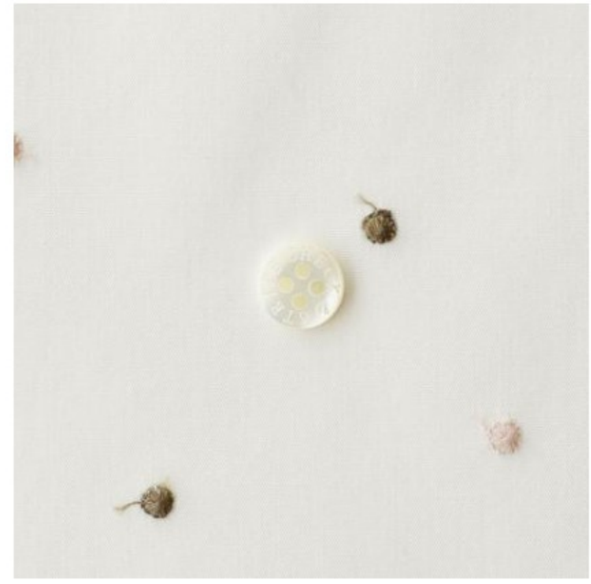
ホワイトにフレンチカラー