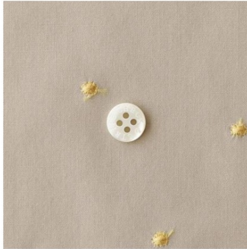
ソイラテにコールドイエロー