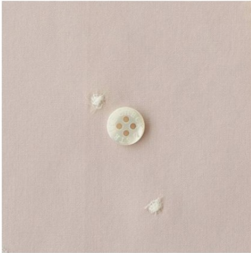
グレイッシュピンクにオフホワイト