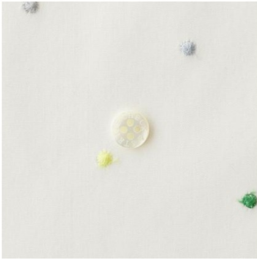
ホワイトにフレッシュカラー