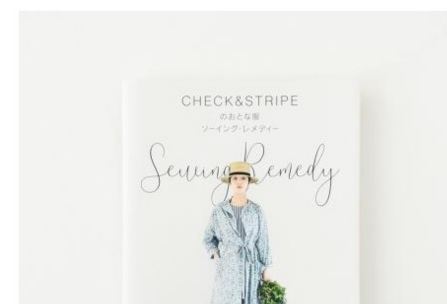
本・ミシン糸・テープ