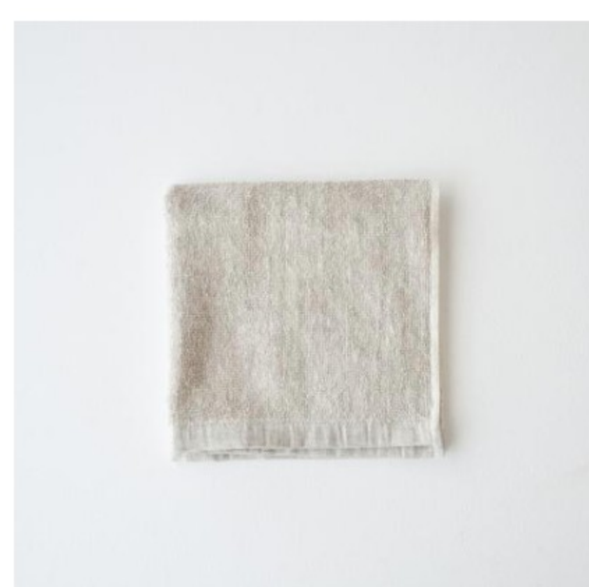
フラックス(生成り)