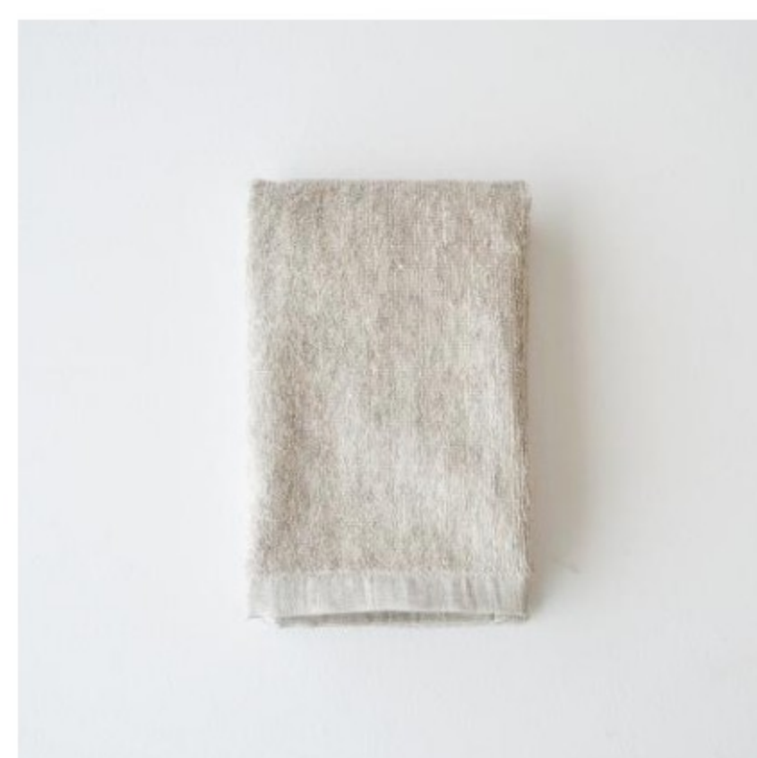
フラックス(生成り)