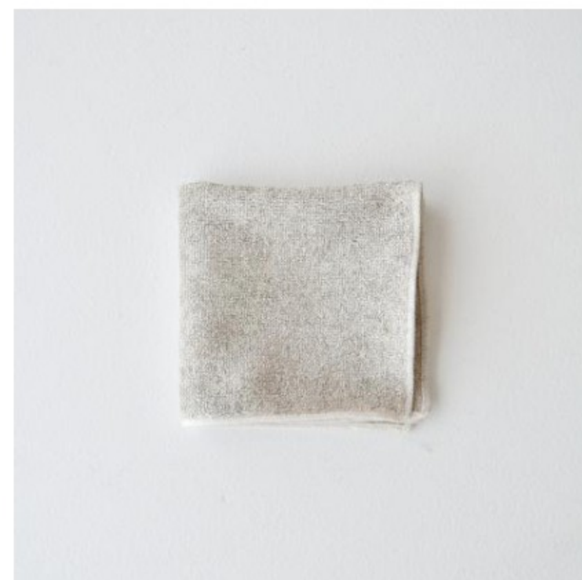
フラックス(生成り)