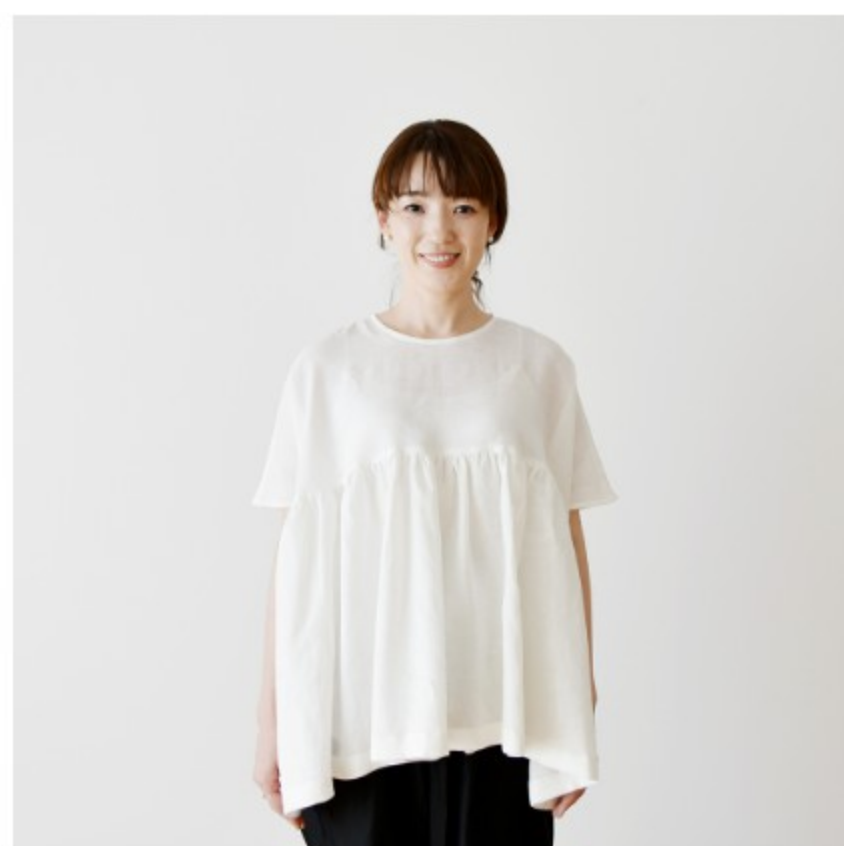
ホワイト:『CHECK&STRIPE COLOUR BOOK 色を楽しむソーイングブック』(文化出版局) ハイウエストのギャザーブラウス