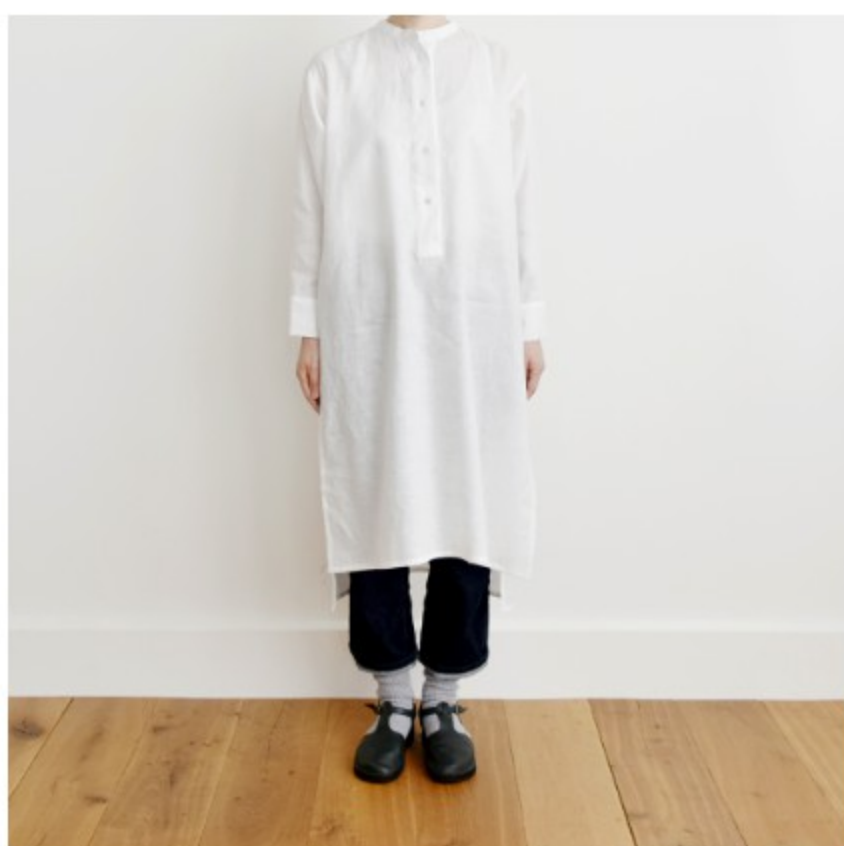
ホワイト:『CHECK&STRIPE SEW HAPPY』(世界文化社) ヘンリーネックのシャツワンピース