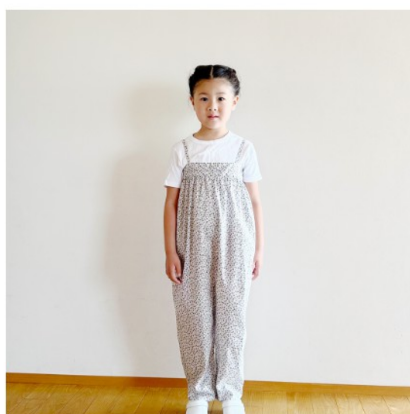
◎J24B (ラベンダー系): 『CHECK&STRIPE COLOUR BOOK 色を楽しむソーイングブック』(文化出版局) 後ろギャザーサロペット 子ども