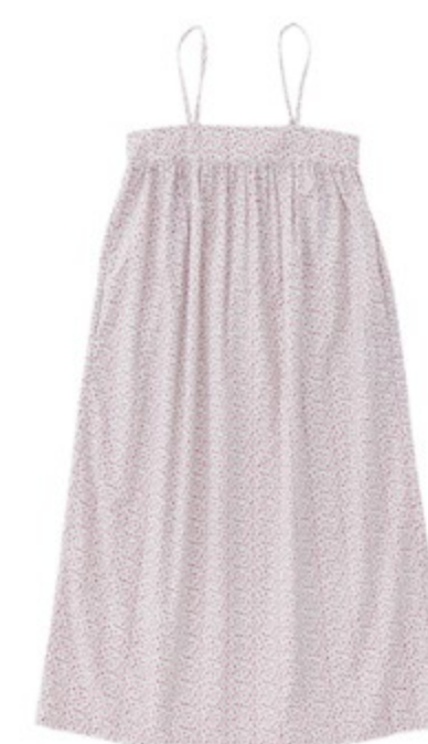
Z(ピンク系): 『CHECK&STRIPE COLOUR BOOK 色を楽しむソーイングブック』(文化出版局) 後ろゴムのギャザードレス 用尺:S 2.5m/M 2.5m/L 2.5m