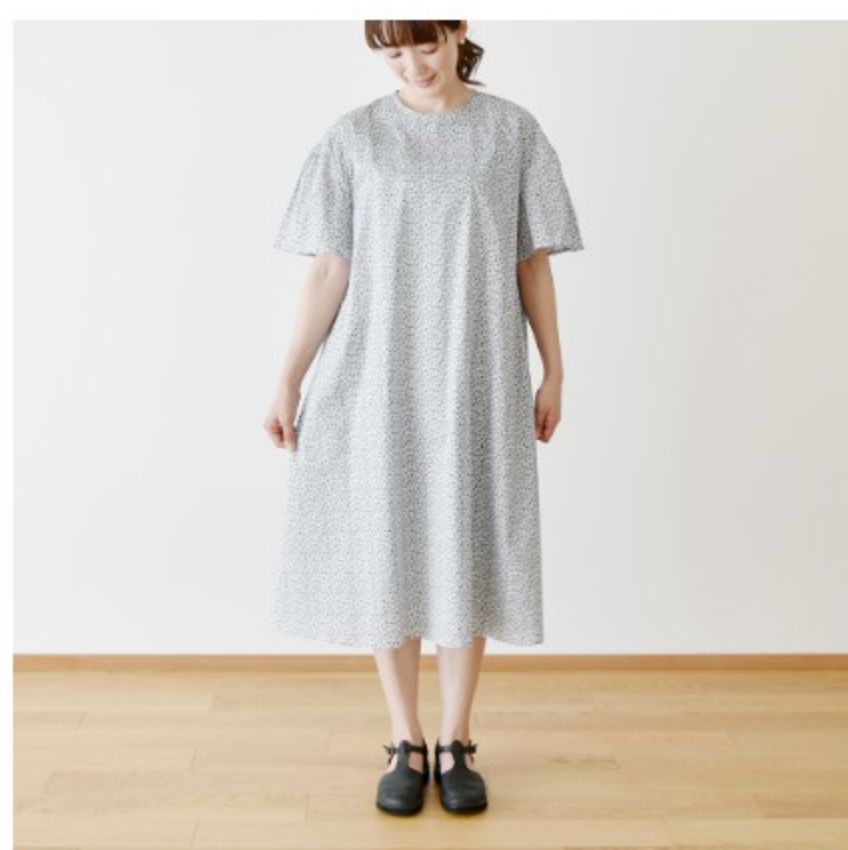
◎J24A (ネイビー系): 『CHECK&STRIPE COLOUR BOOK 色を楽しむソーイングブック』(文化出版局) ギャザースリーブのワンピース