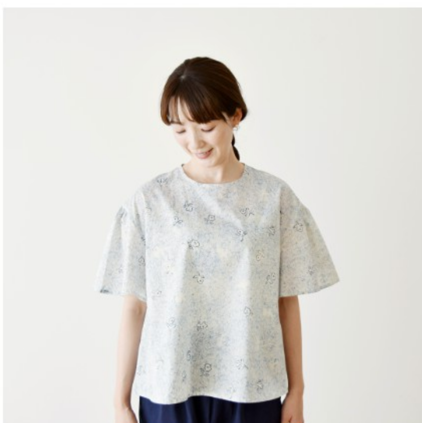
©J12A(ネイビー系): 『CHECK&STRIPE COLOUR BOOK 色を楽しむソーイングブック』(文化出版局) ギャザースリーブのブラウス