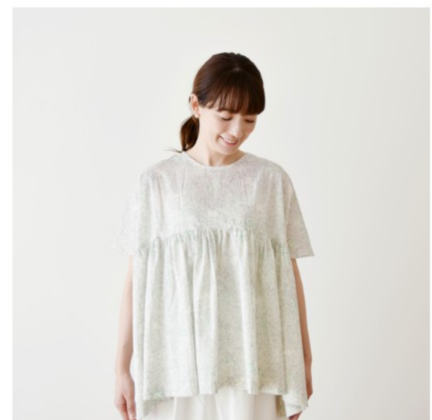
©J15C(グレーにグリーン): 『CHECK&STRIPE COLOUR BOOK 色を楽しむソーイングブック』(文化出版局) ハイウエストのギャザーブラウス