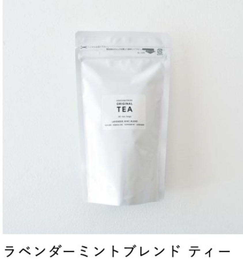
ラベンダーミントブレンド ティーバッグ20個入りのセット