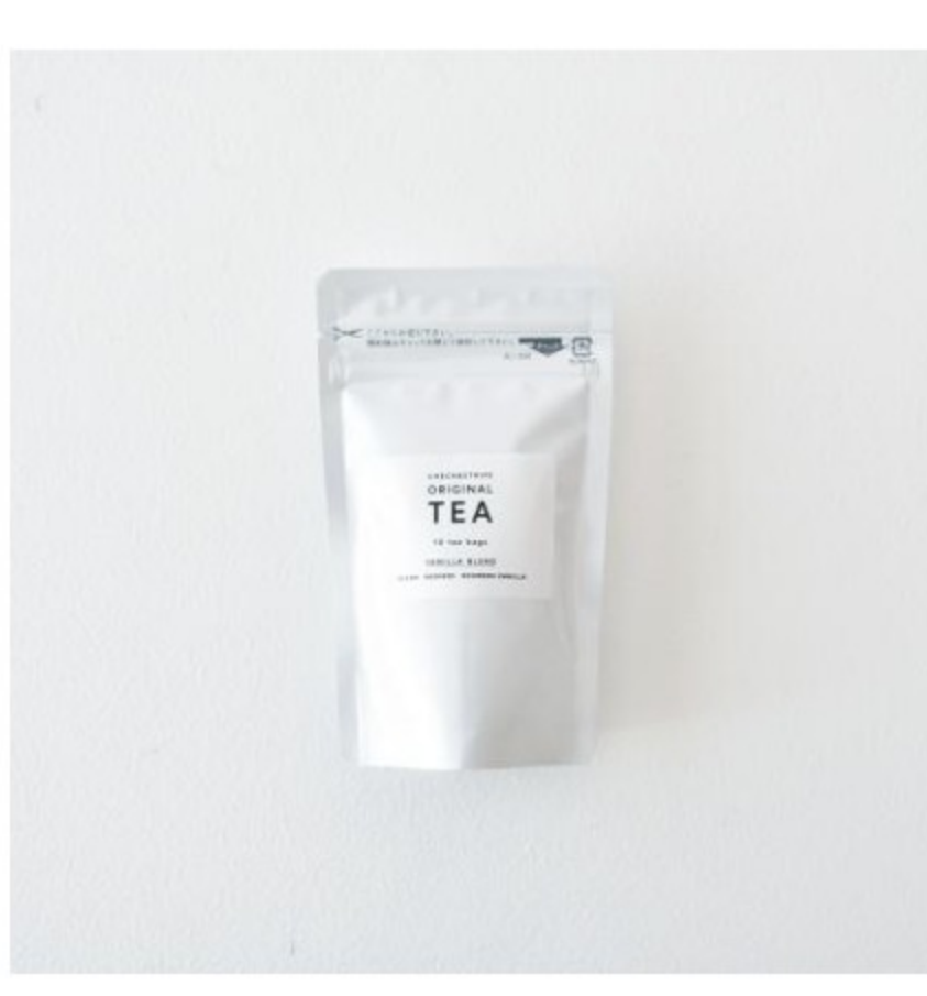
バニラブレンド ティーバッグ10個入りのセット