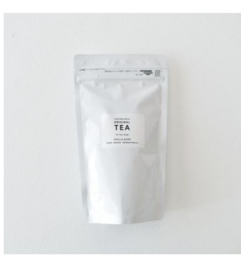
バニラブレンド ティーバッグ20個入りのセット