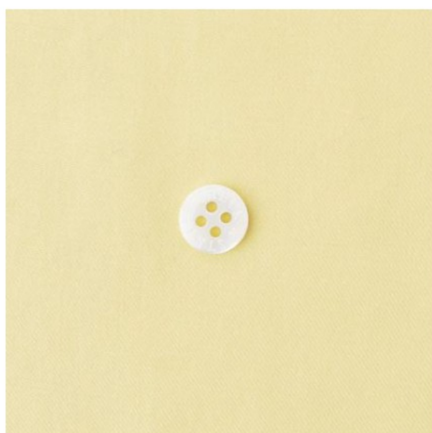
カナリーイエロー