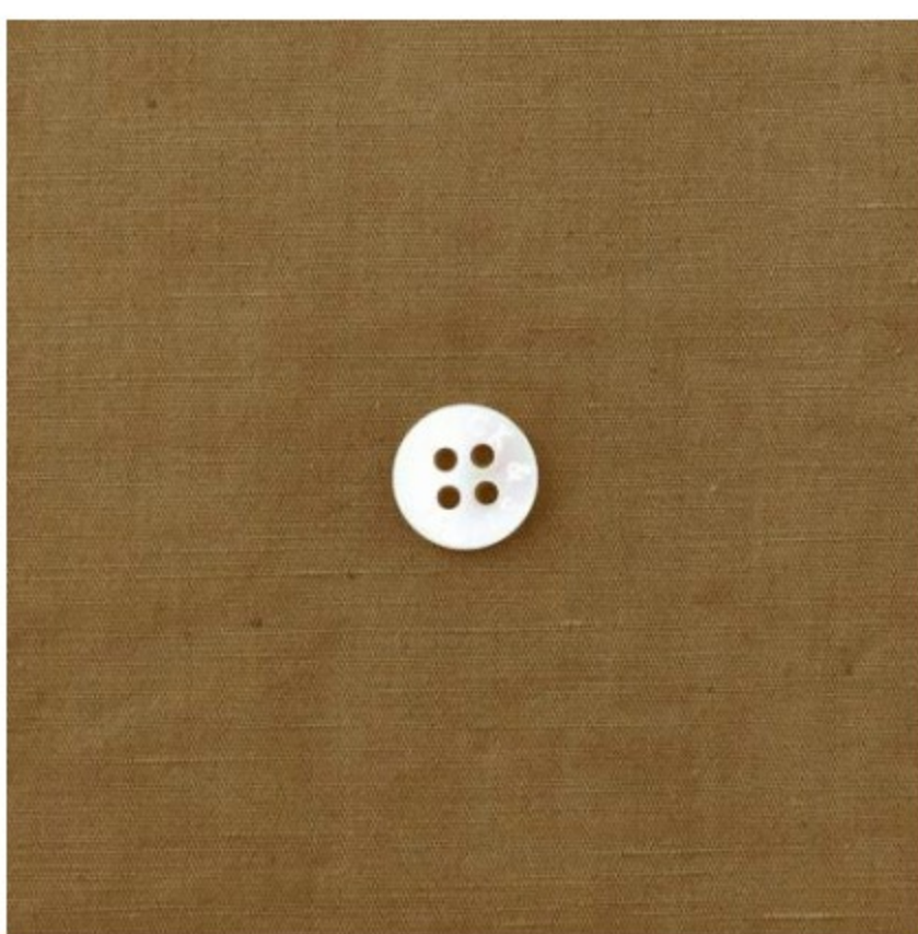
ゴールドブラウン