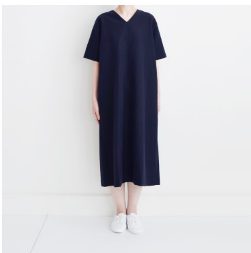
ダークネイビー:「パターン177」 (後ろボタンのVネックワンピース)