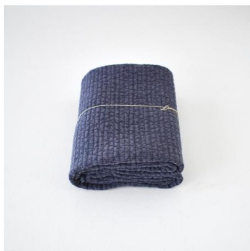
ネイビーパープル(新色)